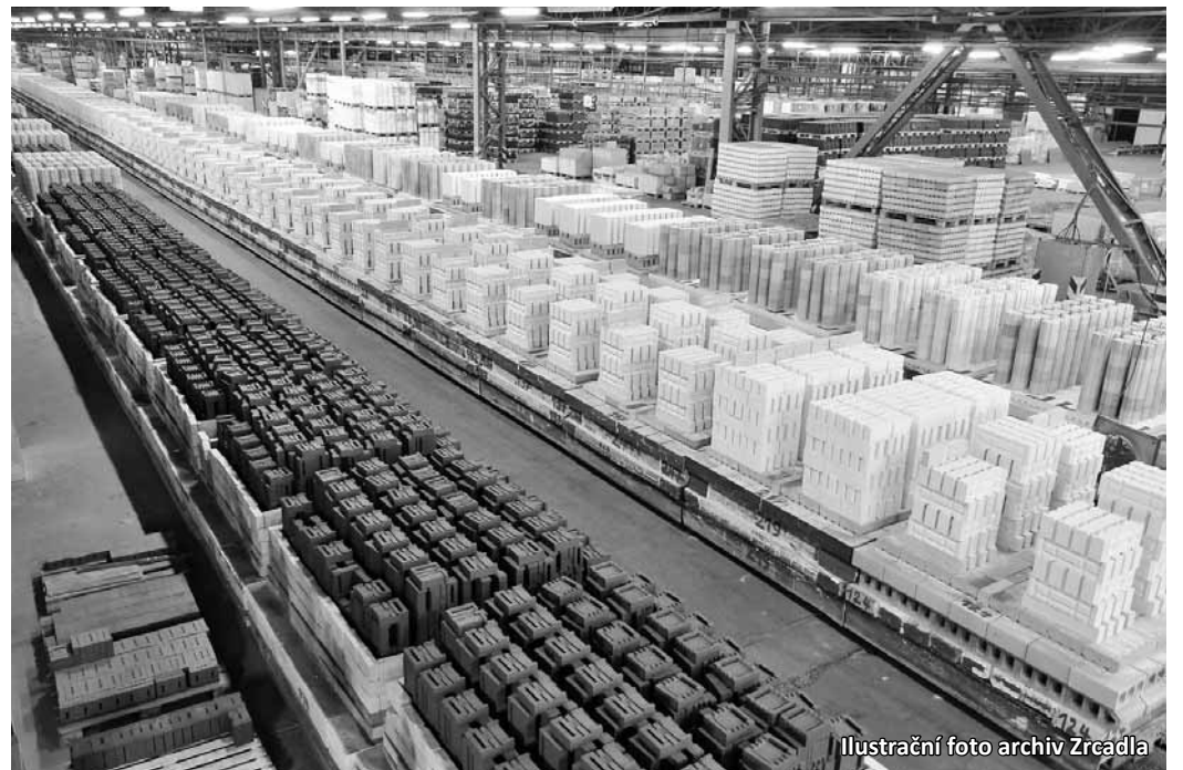
Ilustrační foto archiv Zrcadla

Společnost P-D Refractories vyrábí šamotky, vysoce hlinité, dinasové a izolační kameny,