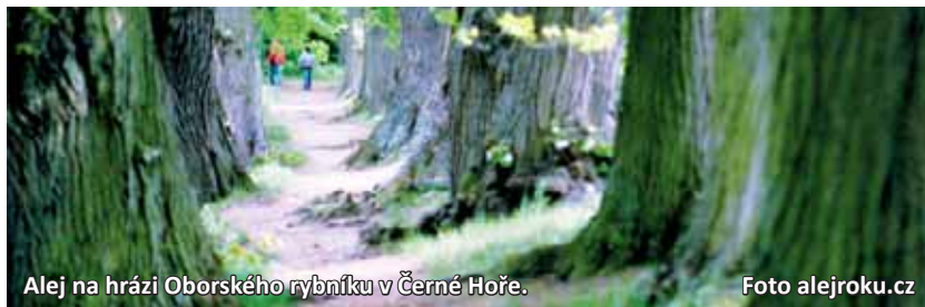
Alej na hrázi Oborského rybníku v Černé Hoře.

„Krásná stará alej, klasické dvouřadé zpevnění hráze. Místo procházek, výhledů na zámek a rybářského posezení,“