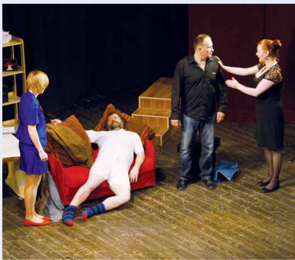
Premiéra. Ochtotnické divadlo Boskovice uvedlo v neděli premiéru konverzační komedie M. Cooneyho nájemníci pana Swana. Repríza je v boskovické sokolovně na programu 28. listopadu v 19 hod.

Pořádáte nevšední akci? Děje se u vás něco zajímavého? Volejte: 774 408 399 Pište: redakce@zrcadlo.net