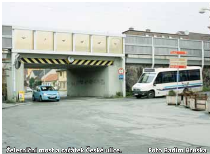
Železniční most a začátek České ulice.