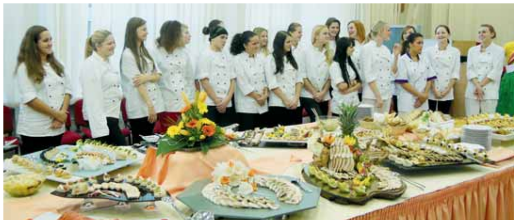
Kurz. VOŠ ekonomická a zdravotnická a Střední škola Boskovice uspořádala kurz studené kuchyně. Své práce představili absolventi na závěrečném rautu.