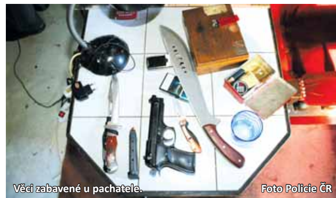
Věci zabavené u pachatele.