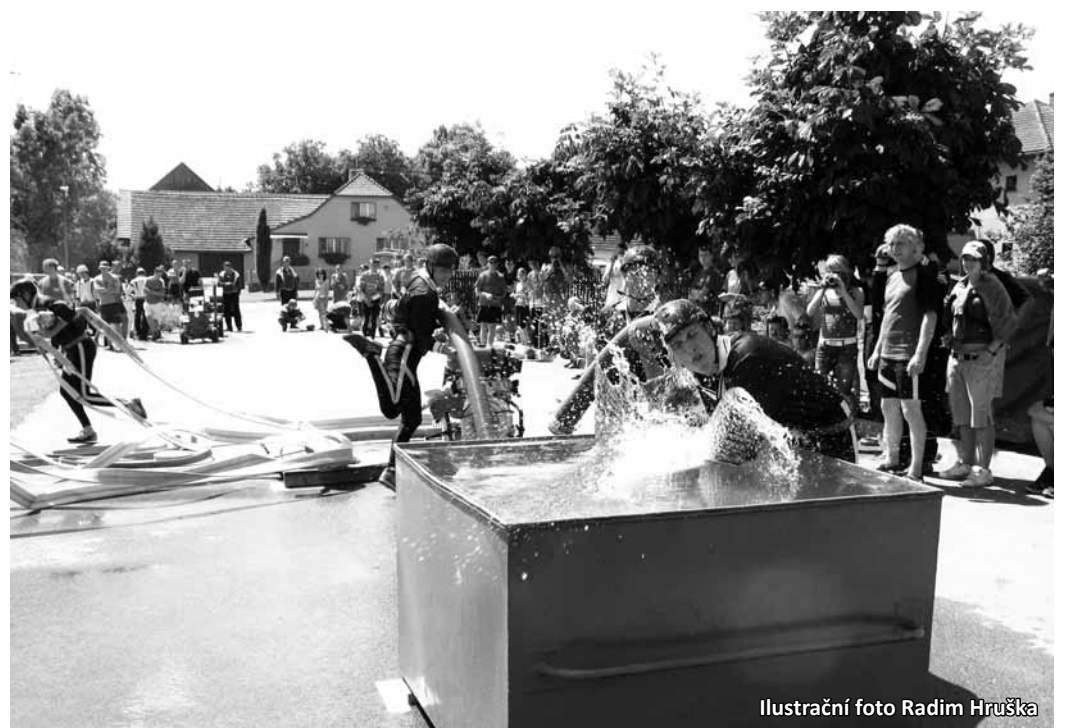
Ilustrační foto Radim Hruška

Musím říci, že moje odhady se nepotvrdily. Hodně jsem věřil ženskému družstvu Sebranic. Holky na dobré výsledky mají, ale vždy se něco pokazí. V mu-