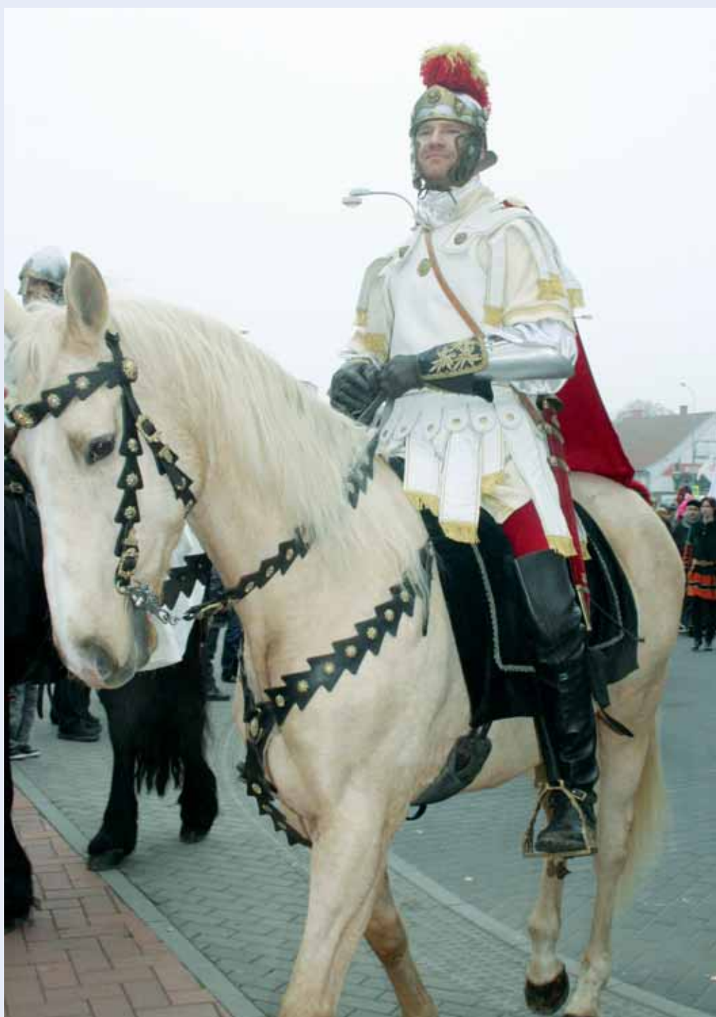
Tradice. V Blansku opět přivítali patrona města - svatého Martina. Kromě tradičního průvodu byla připravena také řada atrakcí a bohatý kulturní program. Fotoreportáž na str. 3.