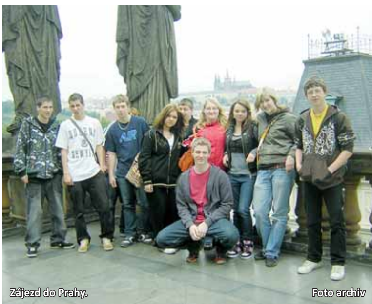
Zájezd do Prahy.

Že se u nás opravdu nenudíme, svědčí akce, které jsme již stihli od začátku září uskutečnit. Hned první týden jsme s nově přichozími studenty absolvovali poznávací vycházku po městě Letovice a jeho okolí. Dozvěděli se, kde sídlí důležité instituce, kde najdou oblíbené obchody a kde a jaké jsou ve městě památky. Ubytovaní studenti také mohou navštěvovat i řadu kroužků, které pro ně pořádáme. Svůj volný čas tak mohou trávit v posilovně, v tělocvičně při míčových hrách nebo v klubovně při kroužku multimediálním a hudebním. Učíme se hrát na kytary, zpíváme písničky k táboráku, sledujeme filmy nebo diskutujeme k tématům, která nás zajímají. Také pořádáme různé sportovní turnaje, např. na počátku listopadu proběhl