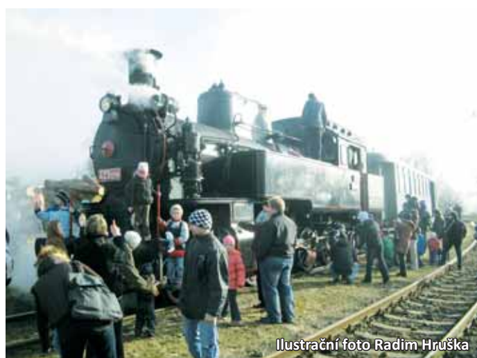
Ilustrační foto Radim Hruška

„Historickou soupravu, sestavenou z vozů bývalé třetí třídy, doprovodí nejen železniční per-