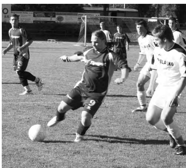
Jiskra naděje. Letovičtí fotbalisté překvapili výhrou na hřišti blanenské juniorky a zachovali si naději na záchranu v okresním přeboru. Rozhodne poslední kolo.

V Červené zahradě se nehrála pěkná kopaná. Po bezbrankové půli se přece jenom fotbalovější