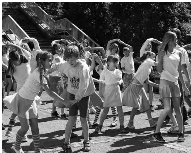
Tancovali všichni. Nadšení adamovských dětí nenechalo nikoho na pochybách, byly to oslavy jejich města.

Adamovští žijí tímto výročím už několik měsíců. Trvalou připomínkou této události je mimo jiné i znovuošetření Alexandrových rozhledny vysoko nad městem, která prošla náročnou rekonstrukcí. Všichni, zejména ti malí, se připravovali právě na uplynulý víkend, kdy oslavy vyvrcholily.