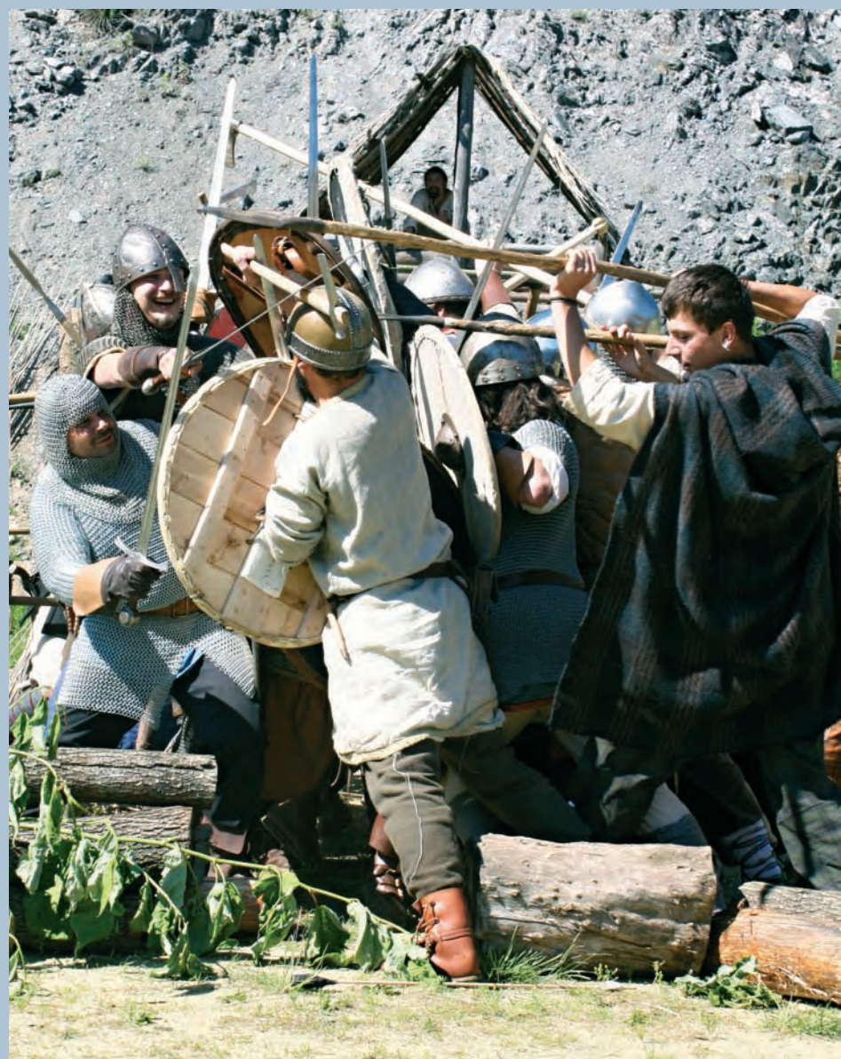
Bitva. Přenést se do dávných časů mohli o víkend návštěvníci keltského skanzenu Isarno nedaleko Letovic. Propukla v něm totiž nefalšovaná vikingsko-slovanská bitva, na kterou se sjeli válečníci z různých koutů naší republiky i zahraničí. Kromě hlavního představení mohli lidé zhlédnout také ukázky různých bojových technik a představení několika druhů historických zbraní.