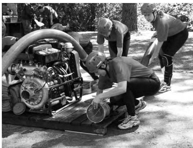
Závody. Trať v Míchově patří mezi nejrychlejší v seriálu podniků Kvasar Cupu.

Právě naopak, své dovednosti přijeli předvést hasiči z celého blanenského okresu v divácky nejatraktivnější disciplíně, a to požárním útoku. Na návštěvníky a soutěžící čekalo příjemné slunečné odpoledne doplněné o burácení motorů soutěžních stříkaček a o kamarádké povzbuzování.