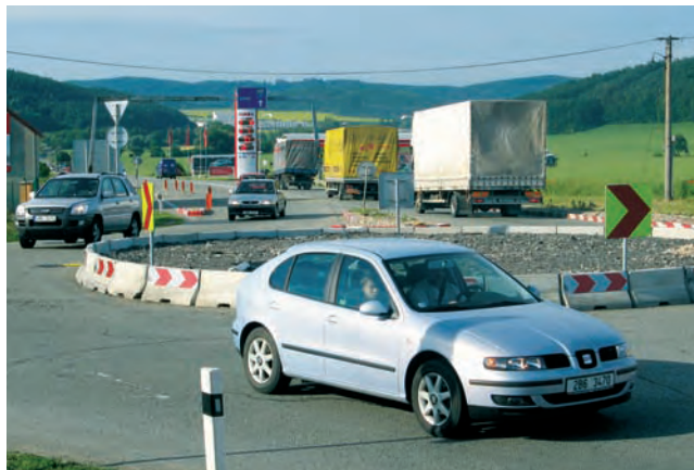
Úpravy. Kruhový objezd v Lipůvce se z provizorního změní na definitivní.

„Pokud to vezmeme ve směru od Brna, tak úpravy čekají pravděpodobně na jaře roku 2011 křižovatku Kuřim-Podle-