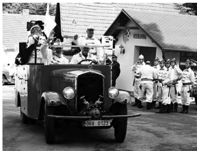
Propagační jízda. Kolona historických hasičských vozidel s olympijským ohněm se zastavila v Roubanině.

„Dneska jsme na cestě už třetí den. Etapa končí v neďalekém Jevíčku a uzavře sto