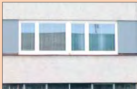
Obrázek 1: Systém oken SULKO PROFI Line byl využit i pro energeticky uvědomělou výměnu oken a meziokenních vložek panelového domu typu HK69. Na snímcích lze pozorovat povrchové teploty rámu a skel téměř shodné s venkovní teplotou (žádné prohřívání konstrukcí okna unikajícím teplem).