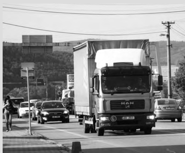
Tradiční obrázek. Kolony aut na I/43 trápí nejvíce obce, kterými silnice prochází.

pruhů v obou směrech. „Vůbec největší investice, za více než 603 milionů korun, se plánuje na úseku Letovice – Rozhraní. V tomto případě se jedná o odstranění několika dopravních závad. Konkrétně se počítá s rozšířením silnice a úpravou všech křižovatek a připojení. Souběžně je řešen návrh vedení hospodářského provozu, cyklo a pěší dopravy i systém zastávek autobusové dopravy. Stavba se nachází v katastrálním území obcí Letovice, Slatinka, Skrchov a Stvolova a termín realizace je plánovaný od dubna 2010 do června 2012. „Uváděné termíny výstavby jsou pouze plánované, mohou se změnit v důsledku problémů s majetkoprávním vypořádáním