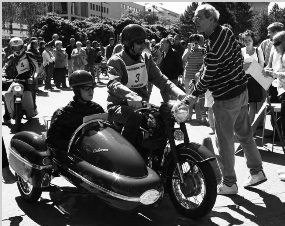
Krasavci. Na cestu z parkoviště u hotelu Dukla okolím Blanska se vydal průvod nablýskaných automobilů a motorek při Veterán Tour Macocha 2009.