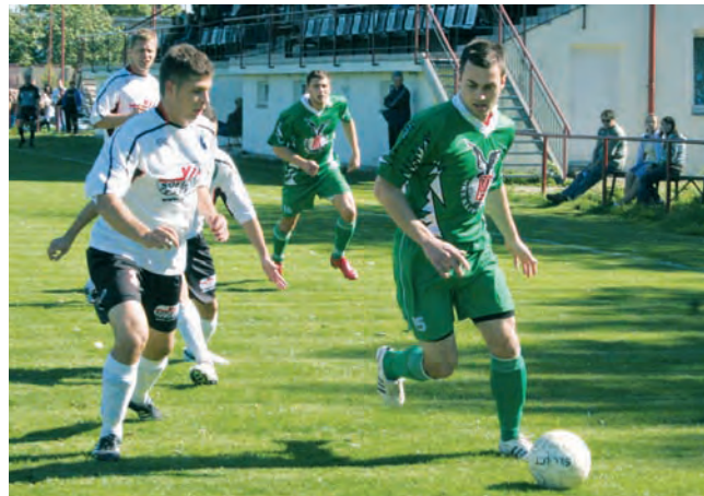
Labutí píseň. Zápasem v Protivanově skončilo divizní účinkování pro celek Rájce-Jestřebí.