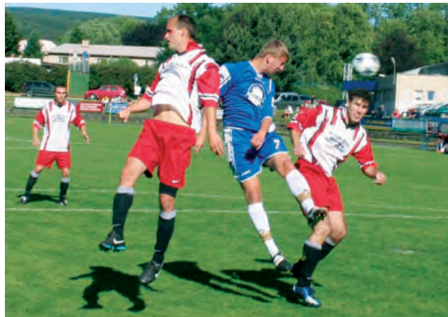
Záchrana. Boskovičtí potřebovali v posledním zápase alespoň remizovat. Podařilo se.