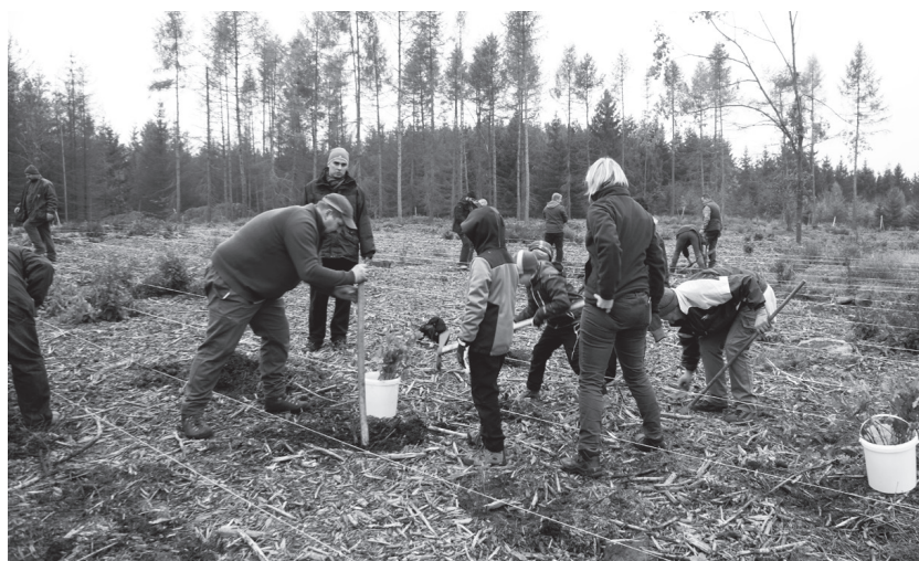
Velice vydařenou a prospěšnou akci uspořádali Starostové a nezávislí minulý týden. Místo nedělního odpočinku téměř 40 účastníků z celé jižní Moravy osadilo plochu, která zůstala holá po kůrovcové kalamitě z důvodu významného usychání lesa. Lesní správa v Černé Hoře jim připravila více než 1 700 sazenic modřínů, dubů a buků.