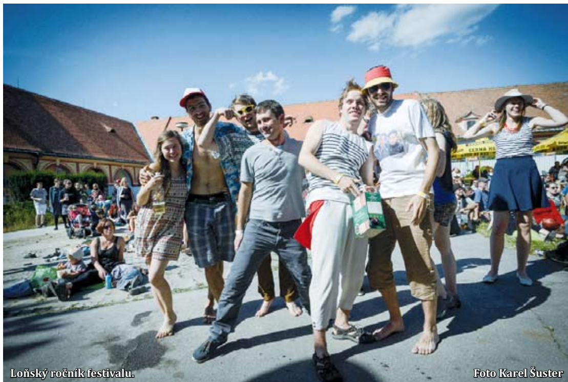
Loňský ročník festivalu.