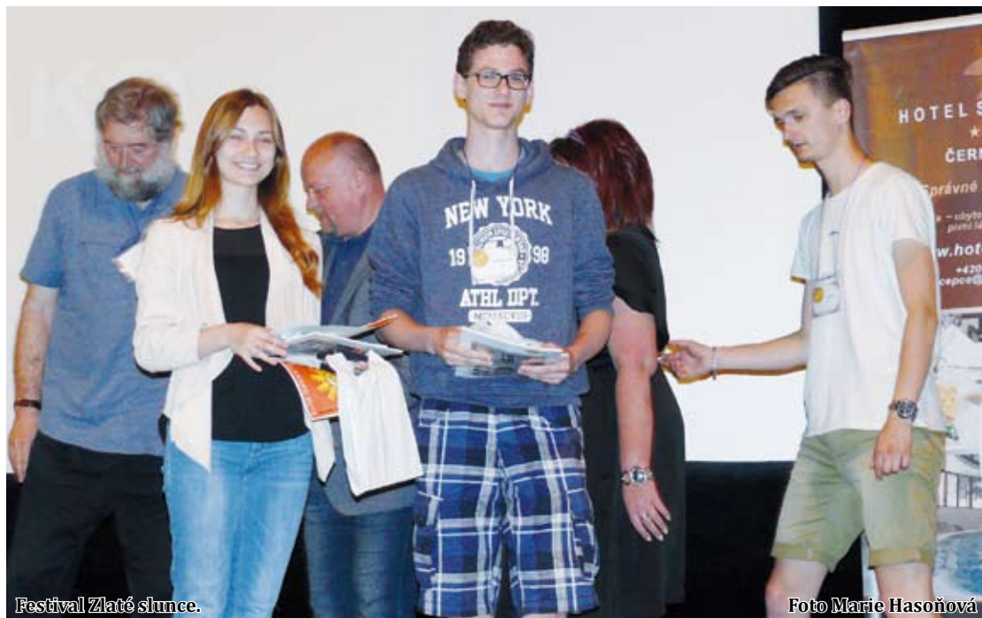
Festival Zlaté slunce.

Filmy hodnotila odborná porota složená z pěti významných osobností českého filmu, jejíž předsedkyní byla Lenka Poláková z České tele-