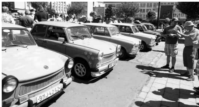
Trabi. Na náměstí Republiky v Blansku se v sobotu konal sedmý sraz vozidel trabant. Na setkání dorazila třicítka aut této proslulé značky. Po prohlídce se vozidla vydala na společnou projížďku.

„Questing je cesta za poznáním určitého území s pokladem objeveným na konci, jde o hru podobnou naší šipkové. Je určena především těm, kteří mají rádi pohyb ve volné přírodě a rádi se při svém putování dozvědí něco nového. Hráči putují po předem naplánované trase a během cesty řeší různé úkoly. Jejich výsledky si zapisují. V závěru, pokud luštitelé správně vyřeší tajenku, je čeká „poklad“,“ doplnila Kučerová. (hrr)