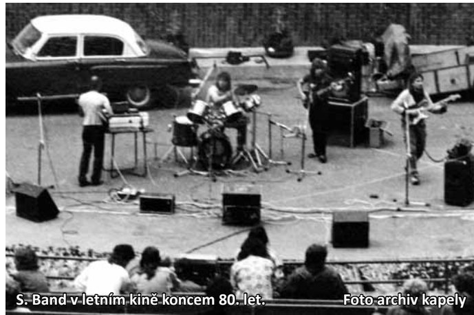
S. Band v letním kině koncem 80. let.

Největší slávu kapela S. band zažívala na přelomu osmdesátých a devadesátých let minulého století. Mezi zábavovými kapelami v okrese Blansko si vybudovala silnou pozici, především díky svému zcela osobitému repertoáru. Na jejich tancovačkách zněly vlastní skladby i písně převzaté od