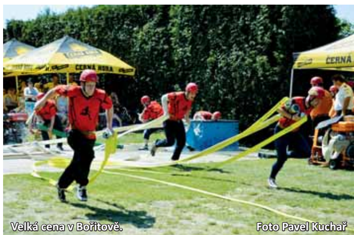
Velká cena v Bořítově.

V parném počasí si na travnatou mírně stoupající trať přijelo zazávodit třicet pět mužských a sedmnáct ženských družstev. Celou soutěž opět otevírali muži.