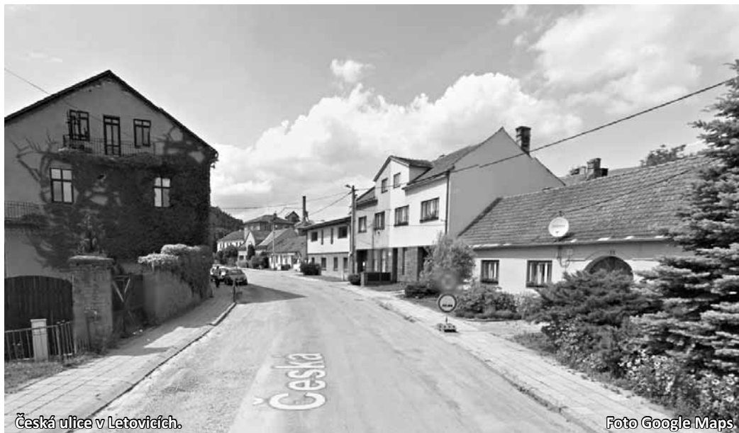
Česká ulice v Letovicích.

„Čekají nás velké obtíže, protože v České ulici žije řada lidí, pro které je používání auta nutností a v lokalitě sídlí také několik firem. Místo musíme navíc zajistit tak, aby se tam dostala záchrana a hasiči. Pravděpodobně tak zprůjezdíme pro motorovou dopravu cyklostezku, která vede podél řeky Křetínky,“ popsal Palbucha.