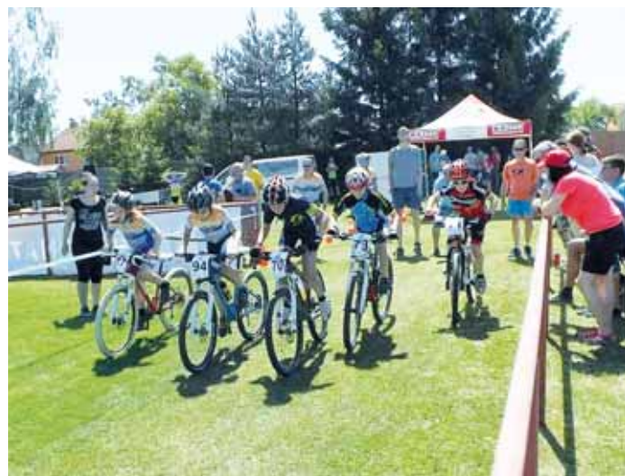
Bikeři. Závod horských kol v Protivanově se po roční pauze vrátil do kalendáře Poháru Drahanské vrchoviny. V sobotu 6. června proběhl na místním fotbalovém hřišti sprint eliminátor a závod smíšených štafet.