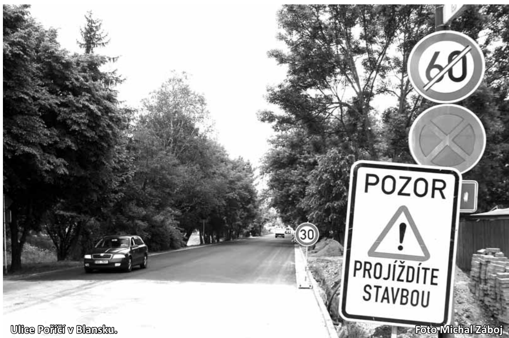
Ulice Poříčí v Blansku.

Stavební firma se teď přesunula do ulice Svitavské. Tam po výměně vodovodního potrubí a přípojek přijde na řadu oprava vozovky, chodníků a veřejného