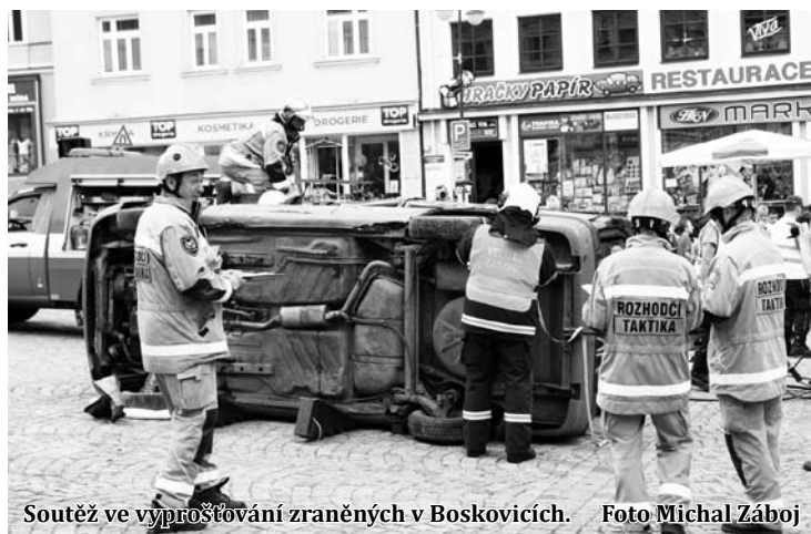
Soutěž ve vyprošťování zraněných v Boskovicích.

Mimo soutěž: Hradec Králové (373), Svitavy (296), Trnava SK (285). Michal Záboj