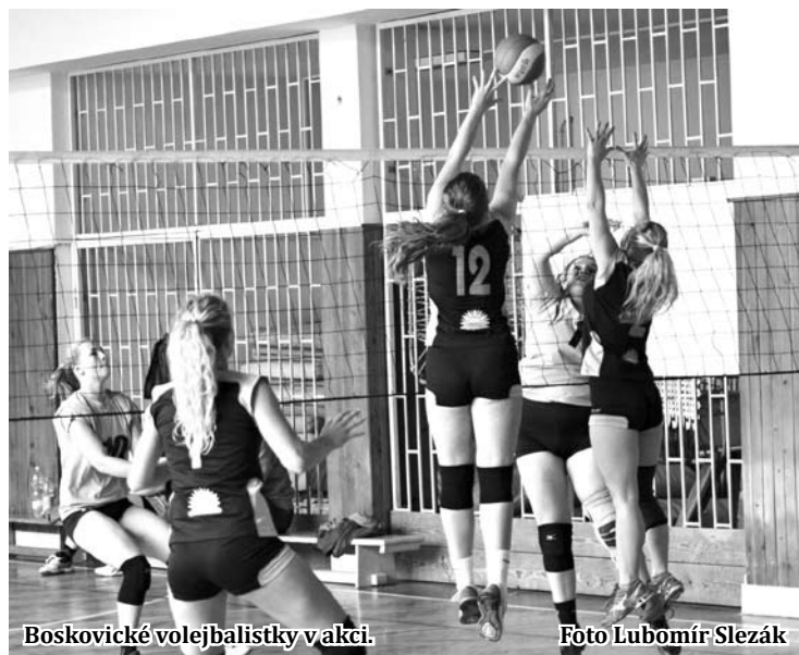
Boskovické volejbalistky v akci.