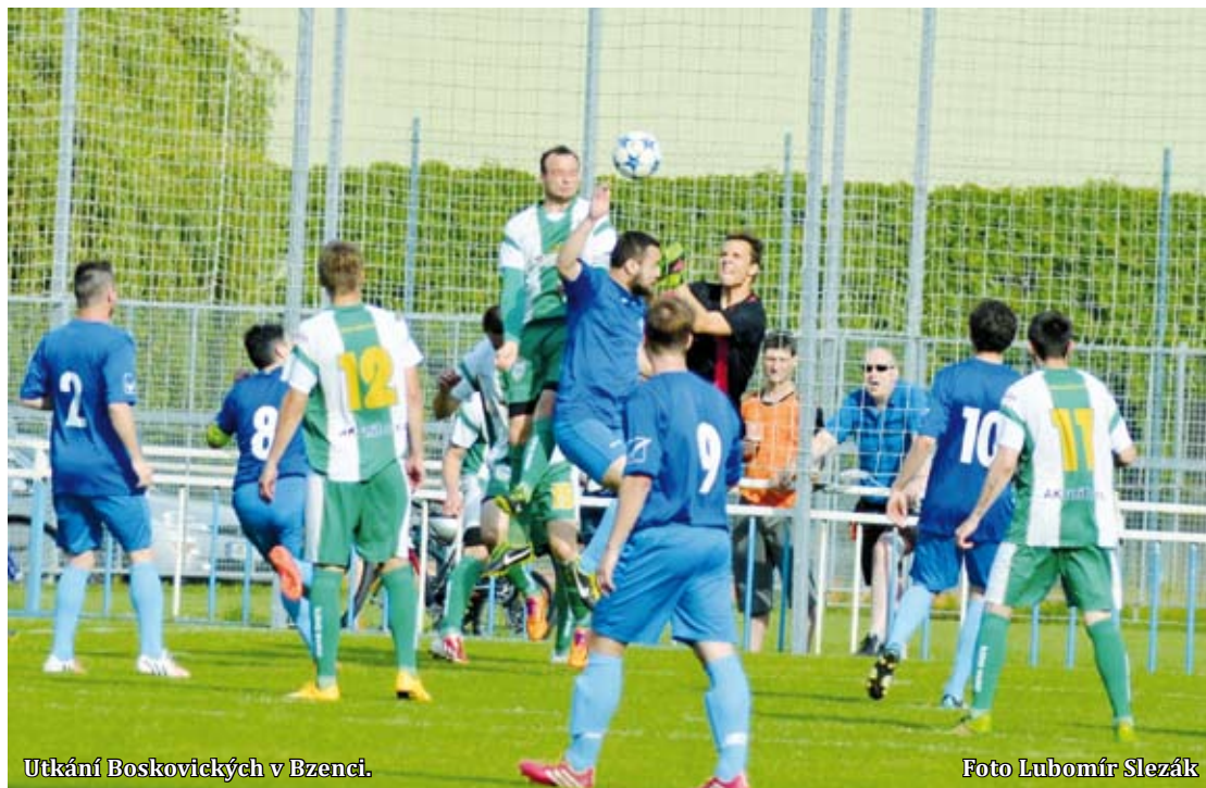
Utkání Boskovických v Bzenci.