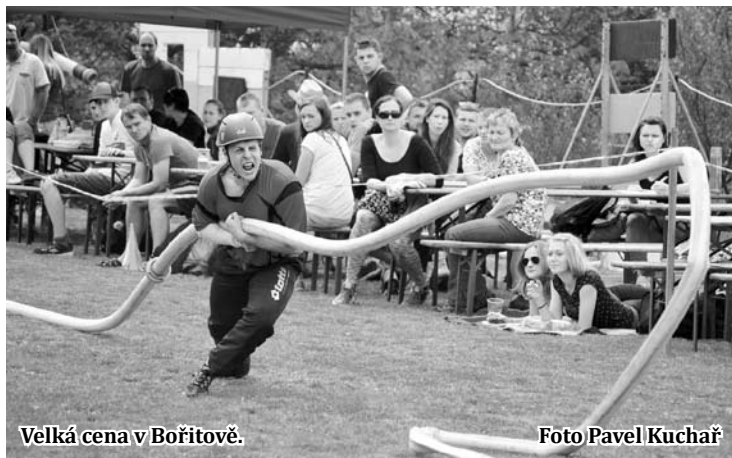
Velká cena v Bořitově.