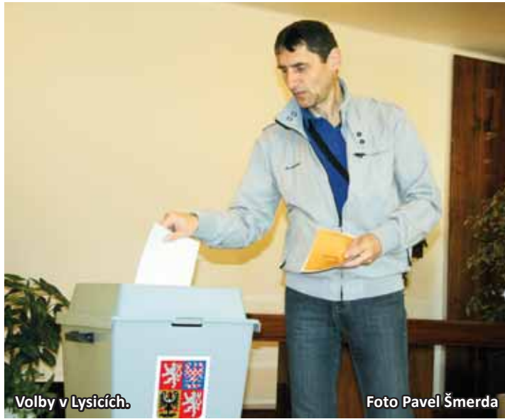
Volby v Lysicích.

Sociální demokraté získali na Blanensku a Boskovicku 25,80%. Svůj hlas jim dalo 14 780 voličů. Na druhém místě skončili občanští demokraté s 15,49%, třetí komunisté získali 13,60%. Následovaly TOP