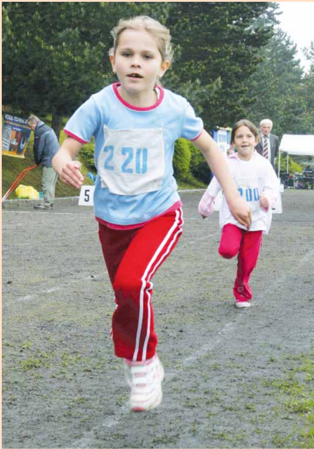
Závody. Celkem 216 závodníků z pětadvaceti škol se zúčastnilo dvanáctého ročníku Olympiády dětí a mládeže prvních ročníků ve Velkých Opatovicích. (více na str. 10)