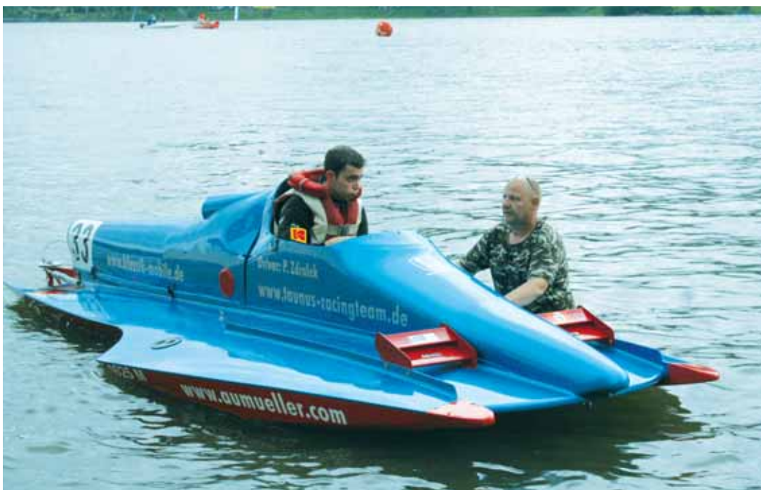
Závody. Nezájem diváků a poloprázdné depo, tak vypadaly o víkendu mezinárodní závody motorových člunů v Jedovnicích.