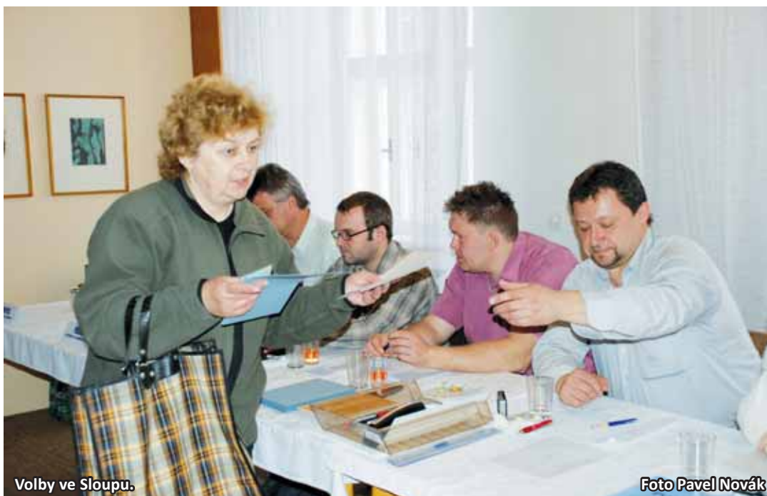
Volby ve Sloupu.

Křesťanství demokraté mají na jihu Moravy a samozřejmě i na Blanensku stále velkou spoustu příznivců. V Makově jim dalo svůj hlas téměř padesát procent voličů, naopak na propagaci by měli více zapracovat v Milonicích, kde je nepodpořil ani jeden člověk. Stejně jako KDU-