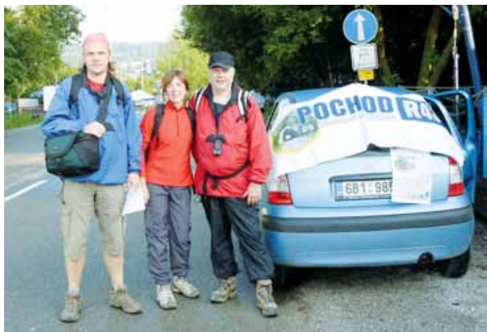
Před cestou. Účastníci pochodu startovali z různých míst. Turisté na fotografii se na trasu vydali z Brna-Bystřice.

Stalo se tak v rámci prvního ročníku Pochodu po dálničním tělese R43, který uspořádali boskovičtí turisté. Organizátoři plánují akci každoročně opakovat, a to až do dokončení stavby důležité dopravní tepny. Současně doufají, že bude tradice co nejkratší. Poslední ročník totiž chtěli uspořádat na dokončeném tělese.