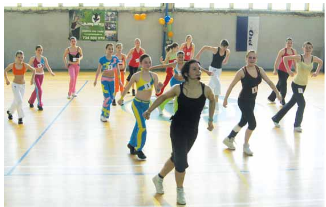
Aerobik. Seriál Baby aerobic Cup vyvrcholil v neděli závody v hale ASK Blansko.