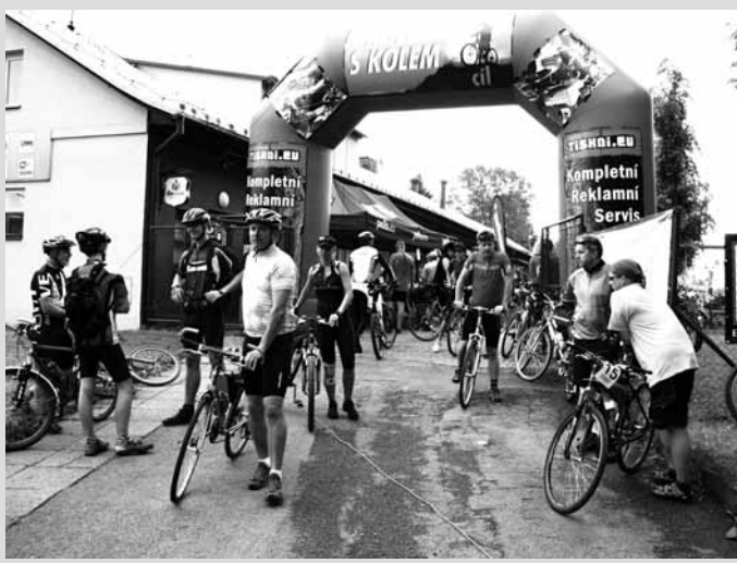
Před startem. Tradiční akce přilákala do areálu letovického koupaliště stovky cyklistů.