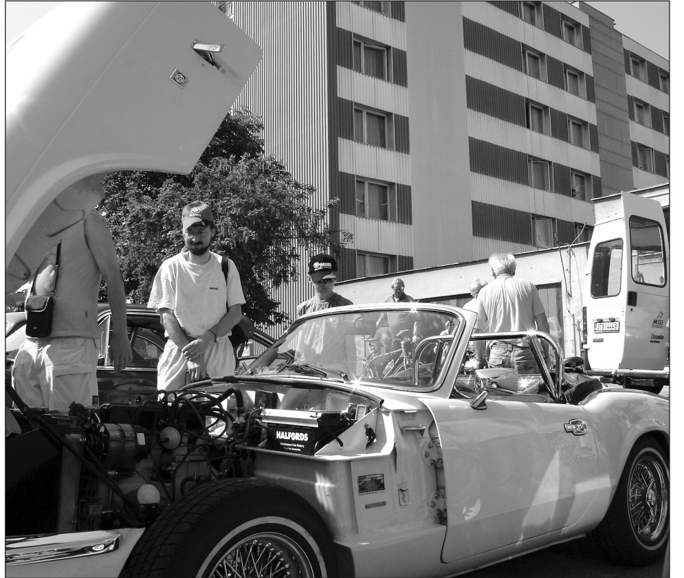
Přehlídka veteránů. Na parkovišti u blanenského hotelu Dukla byly v sobotu k vidění nádherně udržované technické skvosty. Foto Bohumil Hlaváček

Hojně byly zastoupeny i vozy Škoda v různých variantách. Zejména majitelé slavných Felicií z první poloviny šedesátých let si mohli za nádherného slunečného počasí vychutnat jízdu se staženou střešou, když příjemný větrík ofukoval spokojené posádky, mezi nimiž nechyběli ani jezdcí z našeho regionu - z Adamova, Lipůvky, Rájce-Jestřebí, Lipovce, Olomu-