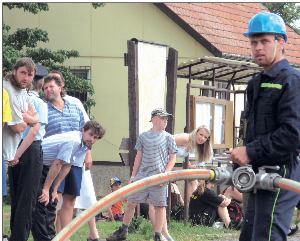
Závody. Soutěž hasičů v požárním útoku se konala v neděli odpoledne v Dlouhé Lhotě. Z vítězství se radovali muži z Rašova, na druhém místě skončila Dlouhá Lhota A a třetí Kunice. Kategorie žen vyhrál Rašov.