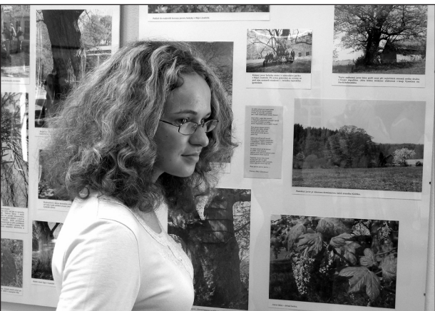
Výstava. V rájecké knihovně je v těchto dnech zajímavá výstava.

V rájecké knihovně nechybějí nejen snímky pořízené v letošním roce, ale pro srovnání jsou některé doplněné i dobovými fotografiemi stromů. Jak prozradila Eliška Pantůčková, vznikly nejen ve vyučování, ale především ve volném čase. Výstava Putování za starými a památnými stromy je otevřená až do konce června.