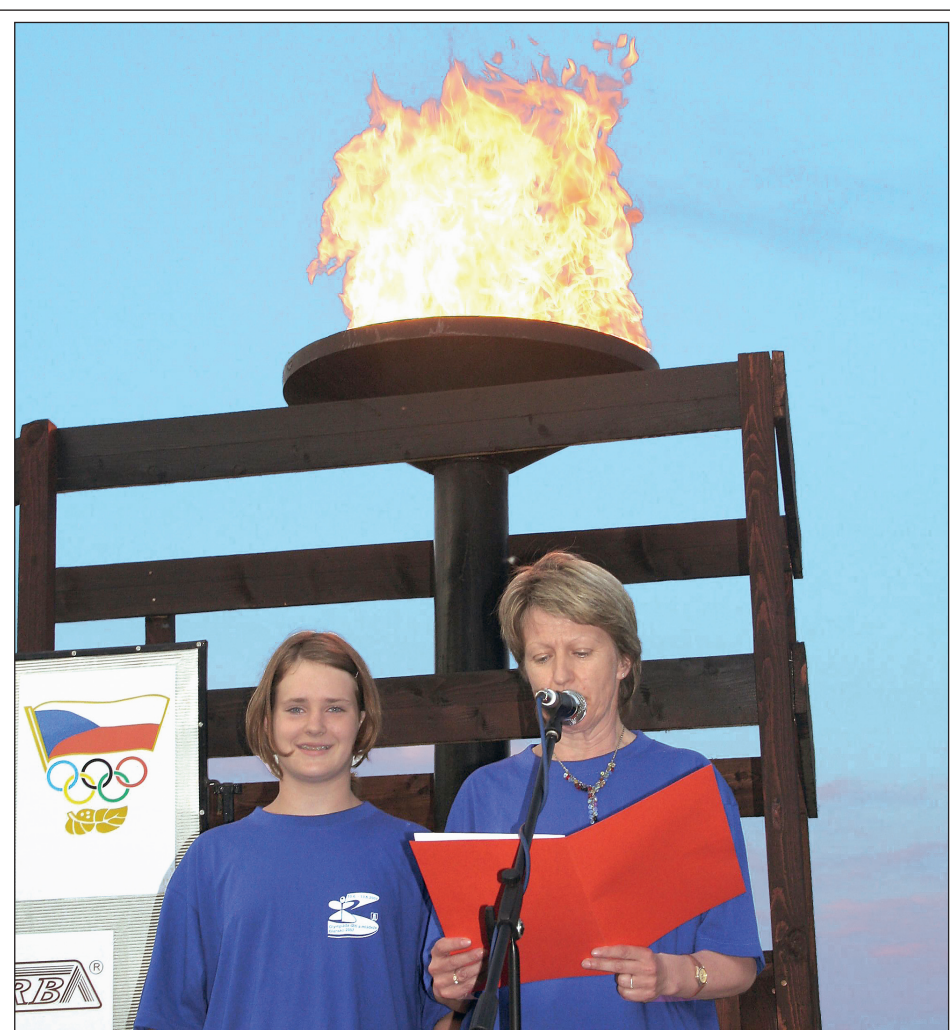
Olympijský slib. V Blansku vzplanul oheň Olympiády dětí a mládeže Blansko 2007, následoval slib sportovců a rozhodčích. Soutěže budou probíhat až do středečního podvečera.