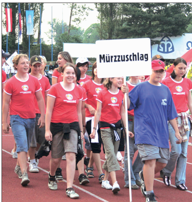
Partnerské město. V průvodu olympijských výprav při zahajovací ceremoniálu Olympiády dětí a mládeže Blansko 2007 nechyběli ani zástupci partnerského Mürzzuschlagu.