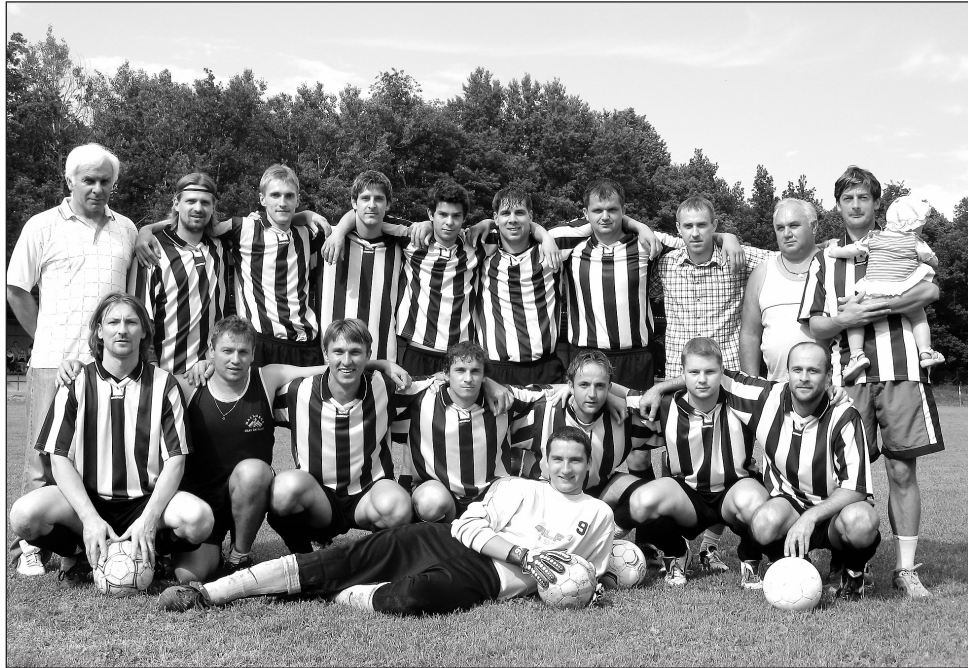
Mužstvo. Fotbalisté Lysic se vrací mezi okresní elitu.

V Lysicích mají bezesporu k dispozici kvalitní kolektiv, už dnes ale přemýšlejí nad tím, jak bude vypadat mužstvo v příští sezóně. Zvláště poté, co tým prav-