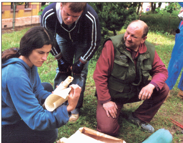
Objev. Dělníci při rozebírání věže našli dvě pouzdra s historickými dokumenty.

V současné době jsou opravy v plném proudu, probíhá demontáž staré střechy, je sundána měď a dřevěná konstrukce. Podle starých plánů se vyrobí v dílně nové díly. Olešničtí chtěli jít původně jen do opravy věže, ale protože už stojí lešení a získali bezúročnou půjčku od církve, zvažují, jestli by nešlo opravit také část fasády na věži. Oprava střechy by měla