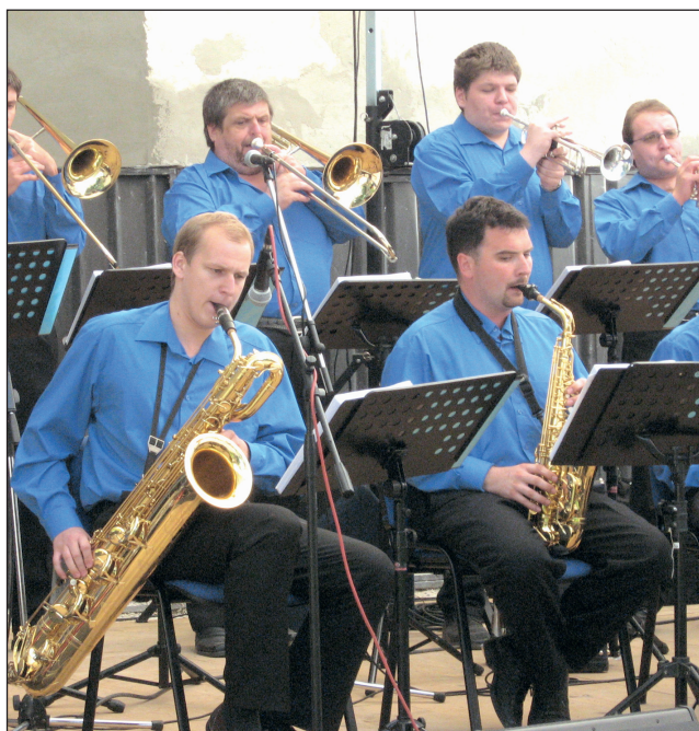
Jazz naživo. Opatovické letní kino patřilo v sobotu milovníkům jazzu a podobných hudebních stylů. Nejen jazzový dýchánek nabídl spoustu výborné muziky.