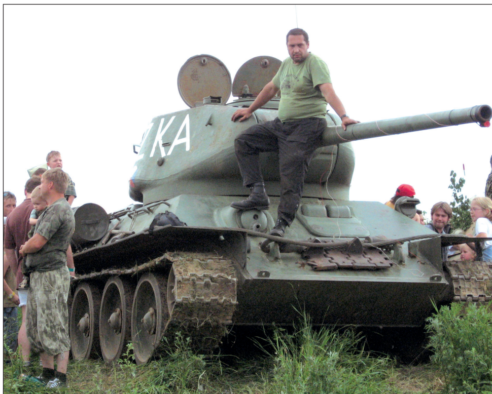
Setkání. Historickou i současnou vojenskou techniku si mohli v sobotu prohlédnout lidé v Boskovicích. Tamní vojenský klub Sedmizubec připravil mimo jiné ukázkovou bitvu a nechyběl ani přelet vrtulníků.