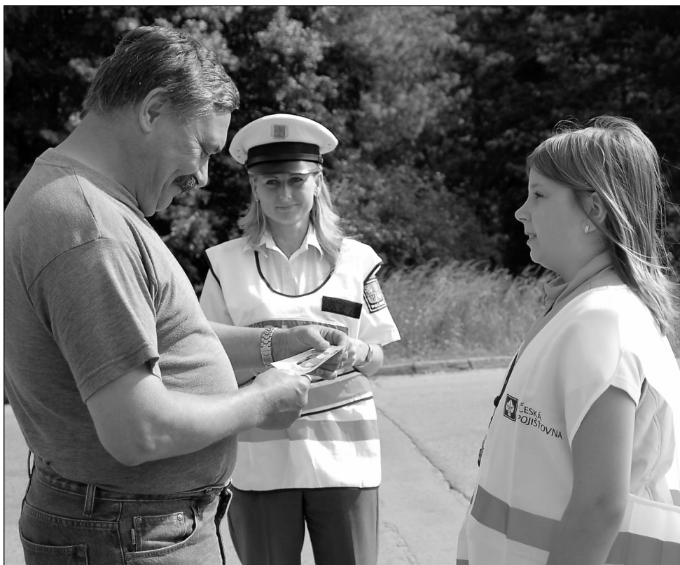
Veselé autíčko. Řidiči, kteří dodrželi minulý týden v pondělí v Adamově stanovenou rychlost, slyšeli od dětí slova chvály.

Dopravní akce Jezdíme s úsměvem, která vystřídala obdobnou s názvem Jablko nebo citron, se na Blansku koná třetím rokem, pokaždé ale na jiném místě okresu. V Adamově tedy měla letos premiéru. Kluci a děvčata si odnesli nejen plno zajímavých zážitků, ale také poznání práce dopravních policistů. (ama)