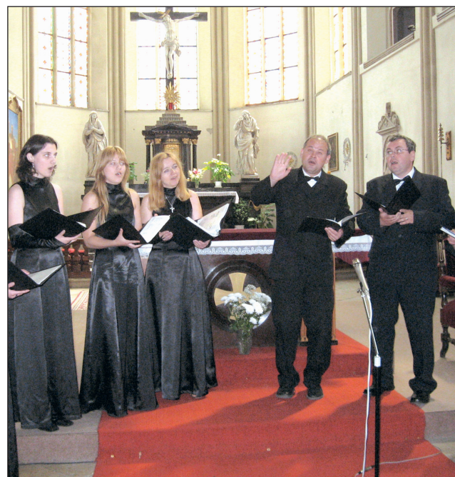
Sborování. Desátý jubilejní ročník setkání chrámových sborů se uskutečnil o víkend v boskovickém kostele svatého Jakuba.