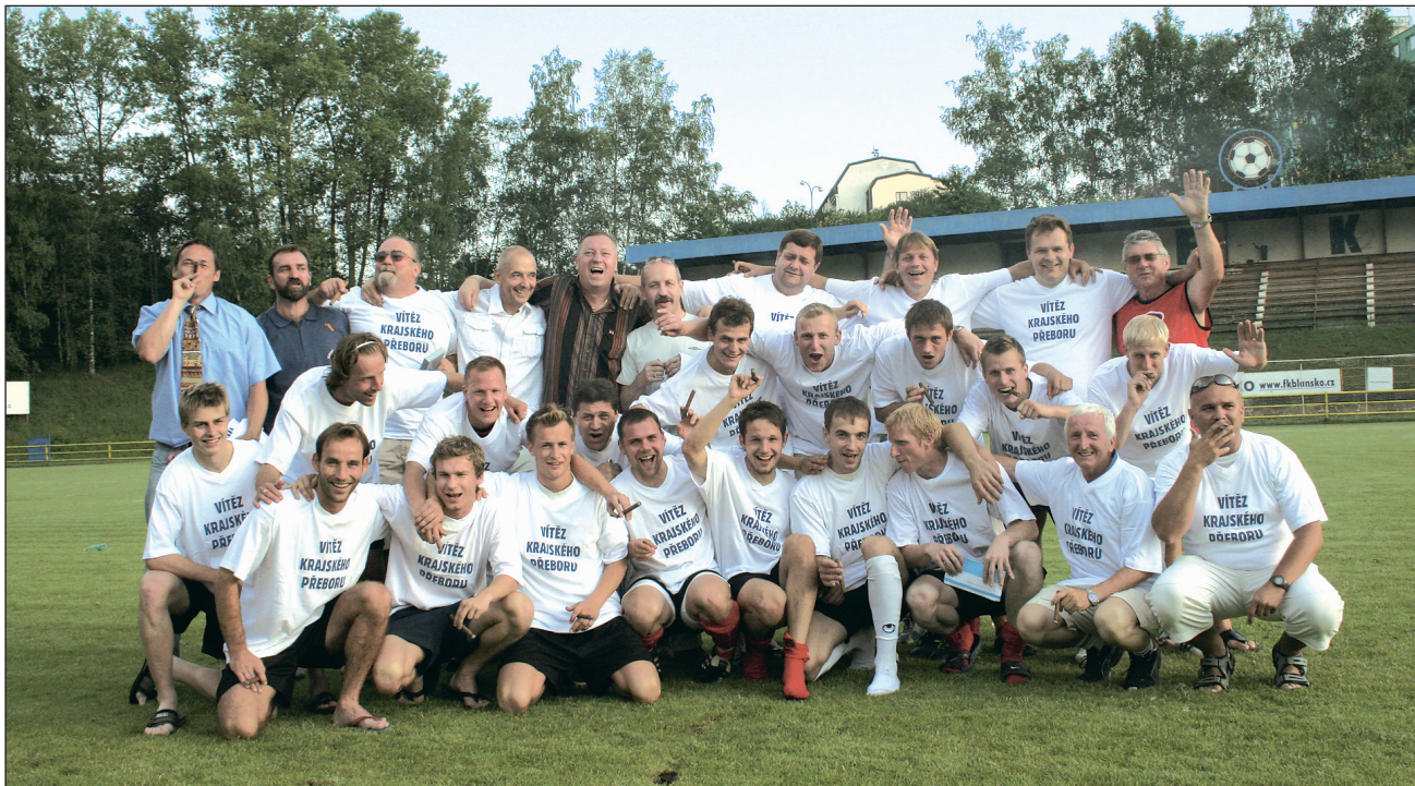
Přeborníci. Hráči FK APOS Blansko oblékli po utkání trička vítězů letošního krajského přeboru.