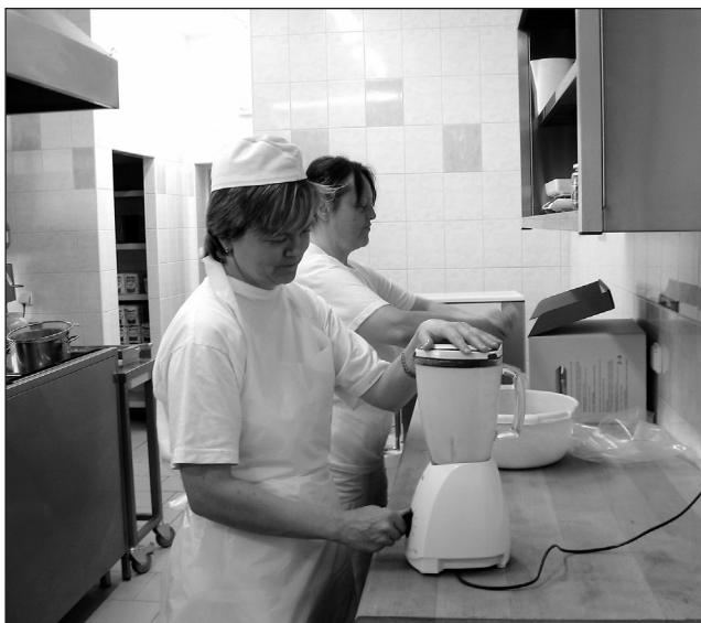
Ve škole. Škola ve Svitávce se od minulého roku pyšní moderní kuchyní a jídelnou.

Momentálně má místní škola 162 žáků, tedy hraniční počet. „Letos nastoupí třidvacet prvňáčků, příští rok bude ale kritický,“ bojí se zástupkyně. Starosta její obavy vyvrací. „O tom, že bychom školu nepodrželi, vůbec