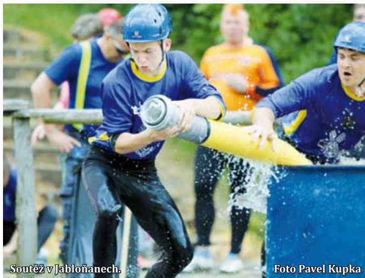
Soutěž v Jabloňanech.

Do Jabloňan si přijelo zazávodit a posbírat body do tabulky Velké ceny celkově 49 týmů, z toho 34 mužských a 15 ženských. Startovala nejprve mužská kategorie, ve které zvítězilo družstvo z Míchova s jedinou šestnáctkou dne. Časomíru se