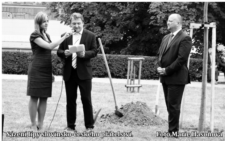
Sázení lípy slovinsko-českého přátelství.

Byly také předány ceny vítězům kvízů týkajících se znalostí Slovin-