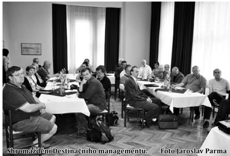
Shromáždění Destinačního managementu.

„Vznikne také pracovní skupina, která bude koordinovat akce v regionu, bude vymýšlet společné propagační akce a bude region propagovat i navenek na veletrzích, v médiích a vůči návštěvníkům, aby Moravský kras byl jednotně prezentován a mluvil jedním jazykem,“ upřesnil člen kolegia Destinačního managementu Jiří Kučera z blanenské radnice.