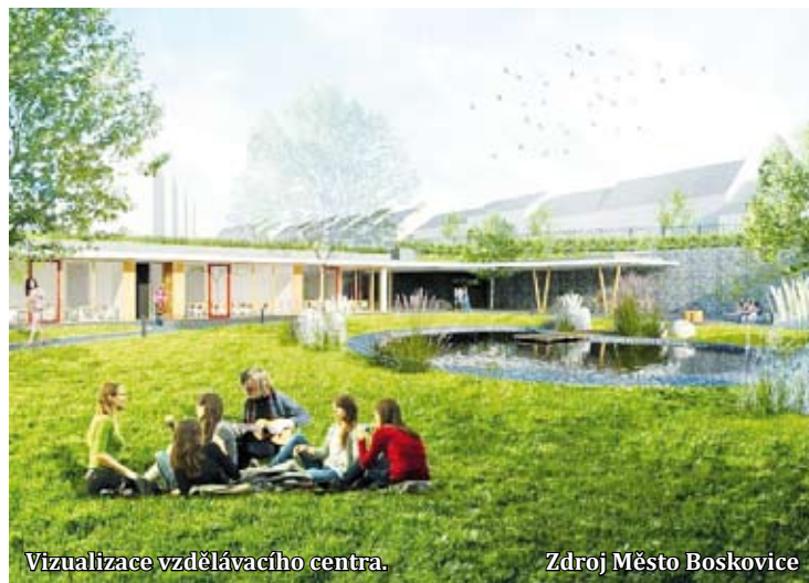
Vizualizace vzdělávacího centra.

Stavba sportovní haly ve Slovákově ulici začala v polovině roku 2013. V únoru následujícího roku byla ale přerušena kvůli problémům s podložím a spodní vodou na staveništi. Projekt pak definitivně skončil loni v červnu. Novou sportovní halu chce vedení Boskovic postavit v areálu Červená zahrada. Michal Záboj