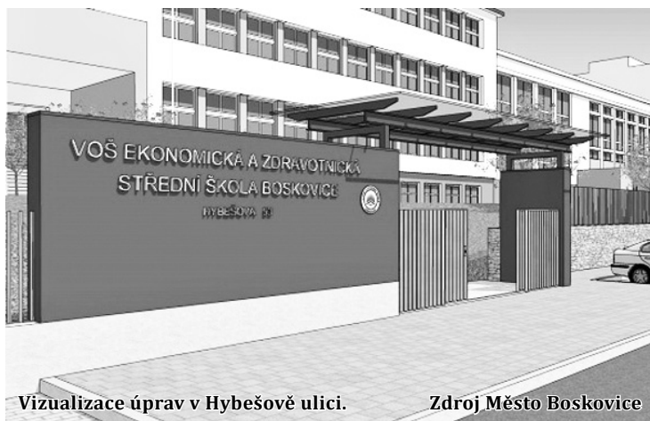
Vizualizace úprav v Hybešově ulici.

„Udělal jsem všecko proto, aby stavební akce mohla začít už od začátku června. Ulice bude celou dobu stavby uzavřená. Současně se budou totiž vyměňovat kostky na vozovce za asfalt,“ podotkla starostka Boskovic Hana Nedomová (ČSSD) s tím, že délka uzavírky a objízdné trasy se budou ještě upřesňovat. (moj)