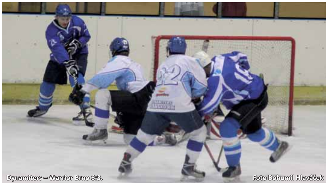
Dynamiters - Warrior Brno 6:3.

Blanenský hokejista vlétli na led jako vítr a hned z první vážnější akce skórovali po kombinaci Hruzy s Tesafem. Vedení navýšili do konce třetiny až na