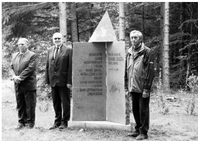
Vzpomínka. Nový pomník na vrcholu Proklest.