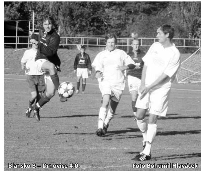
Blansko B – Drnovice 4:0.

Olomučanští se trochu celku ze dna tabulky báli. Ukázalo se, že právem. Herně sice byli dominantnější, Letovičtí však měli střelecké štěstí. Góly padaly v poslední půlhodině. Domácí vedli, pak se ale již ukazatel skóre změnil jen na hostující straně.