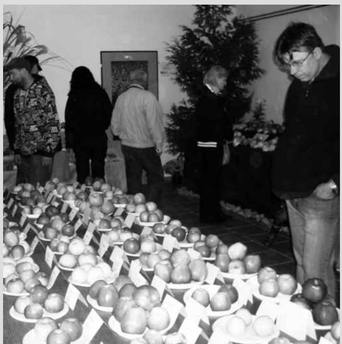
Výstava. V Arboretu Šmelcovna - Dva dvory se uskutečnila regionální výstava ovoce. Zahrádkáři představili především velký sortiment jablek a dalších výpěstků.