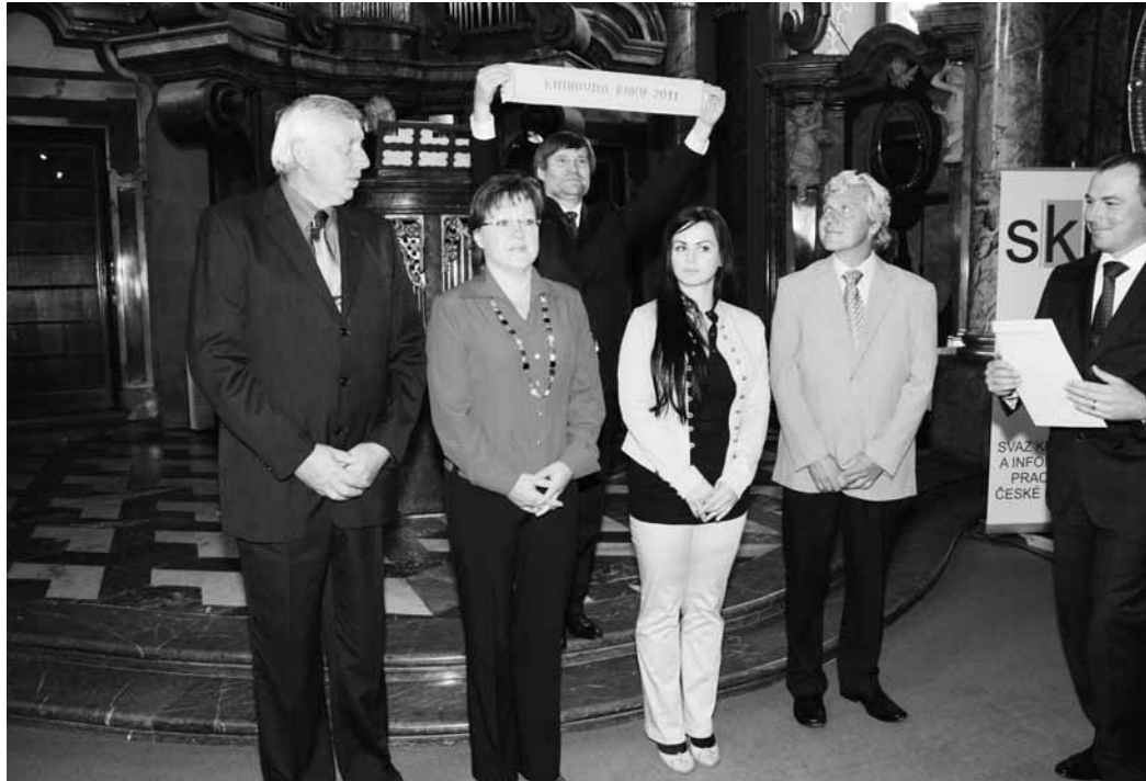
Ocenění. Veselická delegace při slavnostním vyhlášení.

Cenu Knihovna roku uděluje ministr kultury od roku 2003 k ohodnocení dlouhodobých zásluh o rozvoj knihovnictví v obcích nebo mimořádného přínosu k rozvoji veřejných knihovnických a informačních služeb. Je udělována v kategoriích „základní knihovna“ a „významný počin v oblasti