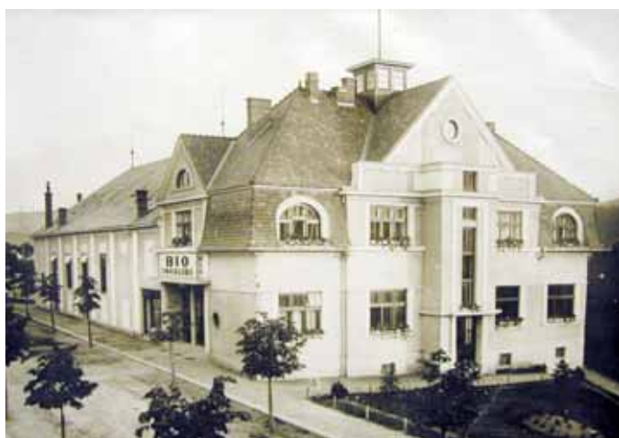
Historie. Původní podoba blanenského kina z roku 1921.

šených provozovatelů a udělal jsem dobře. Zahájili jsme začátkem října Avatarem, nejlepším 3D filmem, jak si přáli lidé v anketě. Přišlo 120 diváků. To bylo bezva. Roztáhli jsme plátno na šířku třináct metrů a zjistili jsme, že 3D efekt, který bývá v polovině sálu, u nás funguje i v poslední řadě. To je luxusní, pářada. Ale přerušit jsme museli, zadržel se objevil, takže dobře za ten zkušební provoz.