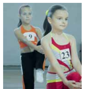
Boj o prvenství. V hale ASK v Blansku se v neděli konala soutěž v aerobiku.