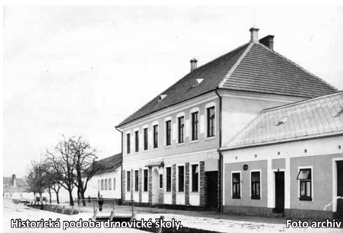
Historická podoba drnovické školy.

„Dostali jsme 2,5 milionu korun, což činí devadesát procent celkové hodnoty díla. Realizaci již zahájila firma STRABAG,“ doplnil. Koncem října by již mělo být podle něho hotovo. „Objekt bude veřejně přístupný, žádné peníze za vstup se nebudou vybírat,“ upřesnil Paulík. (bh)