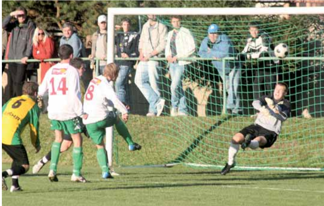
Šance. Ráječtí neproměnili ve druhé půli derby v Ráječku ani tuto stoprocentní šanci a prohráli.

Boskovice si tentokrát přivezly pořádnou nálož. Postarali se o ni v den jejich hodů hráči vedoucího Vracova. Již do konce prvního poločasu vedli o tři branky, ve druhém ještě vedení pojistili. Na čele mají již pětibodový náskok, stříhat se je vydalo Blansko. To teď přivítá v sobotu na Kolbence od půl