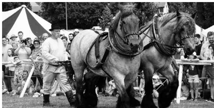
Víkend v Kunštátě patřit tradičním Svátkům řemesel a krásy ušlechtilých koní.