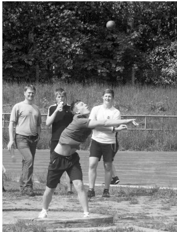
Pohár rozhlasu. Tradiční atletické přebory základních škol a nižších ročníků v atletice proběhly na stadionu ASK Blansko. V mladších kategoriích byly nejuspěšnější dívky z Lysic a chlapi z Jedovnic, ve starších pak děvčata z Gymnázia Blansko a hoši ze ZŠ Salmova Blansko.

Mokrý Hora B - Boskovice 3:6. Cikánek - Šafař 0:6, 3:6, Melichar - Pačinek 6:4, 6:3, Doušek - Bednář 6:2, 6:3, Matys - Legner 2:6, 1:6, Mašková - Toullová 3:6, 6:4, 4:6, Vanýšková-Kitto - Pavličková 4:6, 2:6, Cikánek, Melichar - Pačinek, Bednář 6:3, 3:6, 4:6, Doušek, Votruba - Šafař, Legner 3:6, 2:6, Mašková, Vanýšková-Kitto - Kohoutková, Toullová 6:2, 6:7, 7:6.