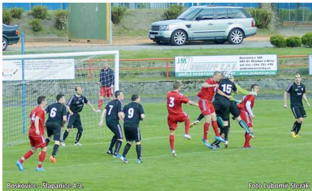
Boskovice - Šlapanice 4:3.