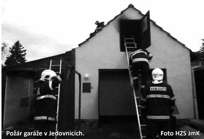
Požár garáže v Jedovnicích.

Jedovnice - Čtyři jednotky hasičů ve středu večer zasahovaly u požáru garáže v Jedovnicích. Předběžná škoda byla vyčíslena na dvacet tisíc korun. Požár se obešel bez zranění. Oheň zachvátil přístřešek a část garáže u domu v jedovnické části Chaloupky po dvacáté hodině. Ještě před příjezdem hasičů majitel stačil duchapřítomně vyvézt auto a začal hasit. „Před příjezdem prováděl hasební práce majitel se sousedy pomocí hasičích přístrojů a kbelíků s vodou,“ popsali na svém webu jedovnickí hasiči, kteří po uhašení převzali přes noc dohled nad požářištěm. Kromě jedovnických hasičů u požáru zasahovala profesionální jednotka z Blanska a jednotky ze Senetářova a Krásenka. (moj)