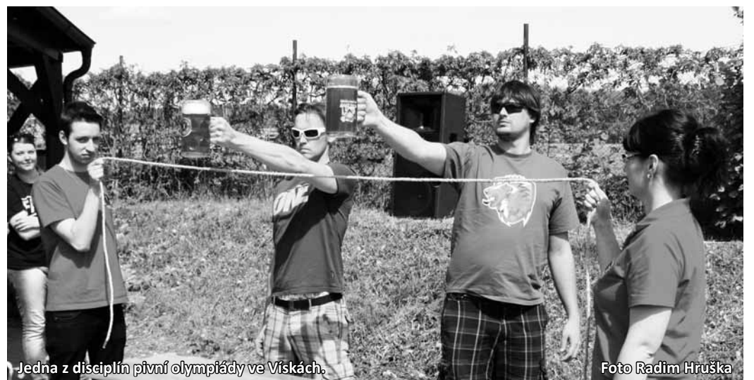
Jedna z disciplín pivní olympiády ve Víseck.