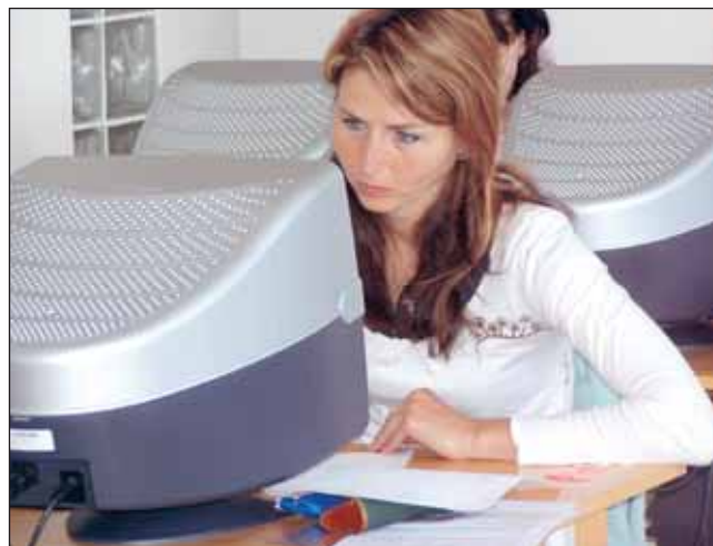
Soustředění. Uchazeči o studium museli zvládnout dva předměty.

„Spolupracujeme s Mendelovou zemědělskou a lesnickou univerzitou v Brně – Provozně ekonomickou fakultou a nově nabízíme tři druhy bakalářského studia. Konkrétně se jedná o tříleté obory Finance, Management obchodní činnosti a Manažersko-ekonomický obor. Celé bakalářské studium v uvedených