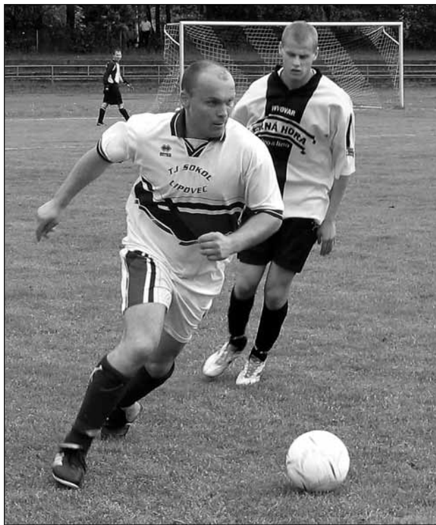
Lídr. Vedoucí tým tabulky si připsal cenné tři body na hřišti blanenského běčka.

Vlažný vstup domácích předznamenal gól hostů v 7. minutě poté, co zaváhali v obraně. Snaha o srovnání hry však byla neplodná až do druhé půle.