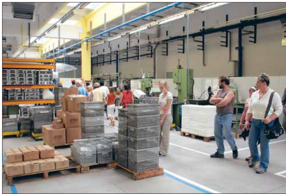
Novibra. Nové prostory si prohlédli také lidé, kteří se přišli podívat na v pořadí již čtvrtý Den otevřených dveří.

„Před dvěma roky jsme v Novibře otevřeli novou halu pro výzkum, vývoj a mezinárodní prodej. V minulém roce to byla zase hala na výrobu vřeten. Dnes otvíráme další tři nové haly a sociální budovy. V minulých měsících došlo k rychlému a prudkému propadu na textilních trzích. V této oblasti je to normální cyklus. V uplynulých týdnech jsme pak museli provést bolestné opatření, které znamenalo propuštění. Ale ve vedení jsme přesvědčení, že z tohoto poklesu vystoupíme posílení. Co se týká prodeje, jsme silně