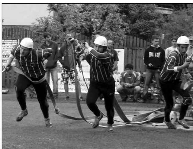
První kolo. Zasoutěžit si do Horního Poříčí přijelo celkem devětatřicet družstev mužů a žen.

Horní Poříčí - Již od soboty všichni příznivci požárního sportu nervózně kontrolovali na internetu srážkový radar a předpověď počasí. Meteorologové všechny strašili vydatnými srážkami na neděli. Právě tehdy měl totiž odstartovat další ročník Velké ceny Blanenska v požárním útoku (VC). Tradičně se první soutěže ujali hasiči z Horního Poříčí. Můžeme jen hádat, který šaman pomohl Poříčským s přípravou, protože celá soutěž proběhla jen s občasnými lehkými přeháňkami. Vzhledem k brzkému termínu této soutěže přijely poměřit síly nejen blanenská družstva, ale i týmy