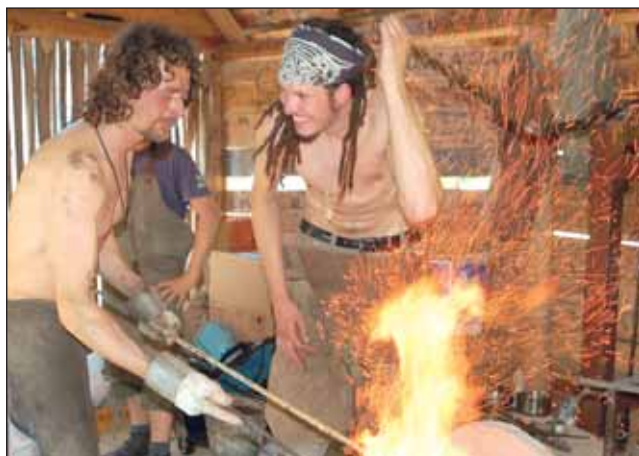
Kováři. Práci se žhavým železem sledovali malí i velcí návštěvníci Josefovského údolí.

V blízkosti Staré hutě se bylo od rána na co dívat. Vedle replik starých železářských pecí si zájemci mohli prohlédnout nejen pec na chleba, ale i destilační přístroj přibližně z patnáctého století, který byl nalezen v Maďarsku. Jeho volnou kopii předvedli členové společnosti Archaia z Brna,