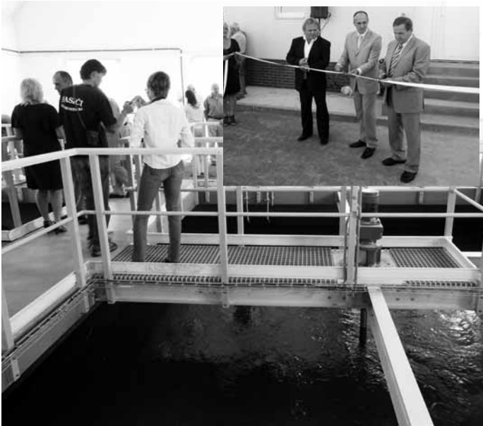
Čistírna. Městys Svitávka slavnostně zahájil provoz nové čistírny odpadních vod.