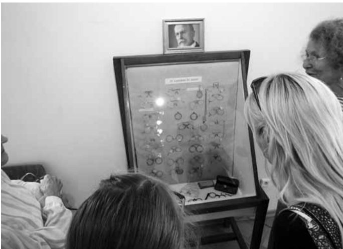
Brýle. Boskovické muzeum připravilo pro své návštěvníky unikátní výstavu historických brýlí.