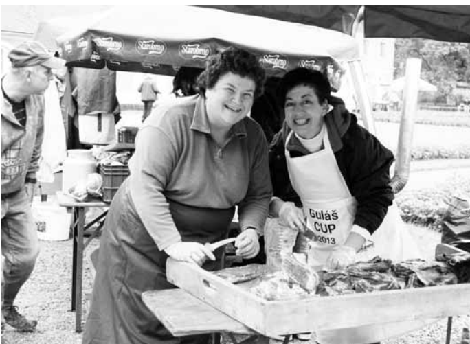
Guláše. Rájecký zámek provoněly o víkendu guláše. Uskutečnil se tam totiž další ročník soutěže v jejich vaření.