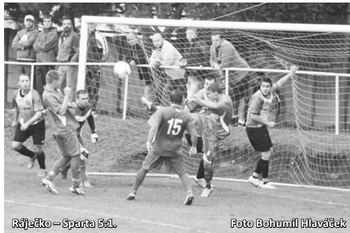
Ráječko – Sparta 5:1.

Hned v úvodu se blýskl bombou Mička a Olympia pokračova-