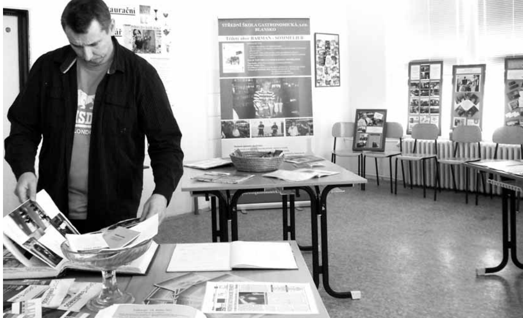
Dokumenty. V kronikách a na fotografiích se ukrývá dvacetiletá historie školy. Od svých začátků v Adamově, přes Obůrku po působení v Blansku.

Jak jsme se dozvěděli, na leden je připravena v prostorách blanského kina výstava o historii školy. Za zmínku stojí i tradiční březnová soutěž mladých barmanů Amundsen cup 2014 a na květen je připravena celodenní