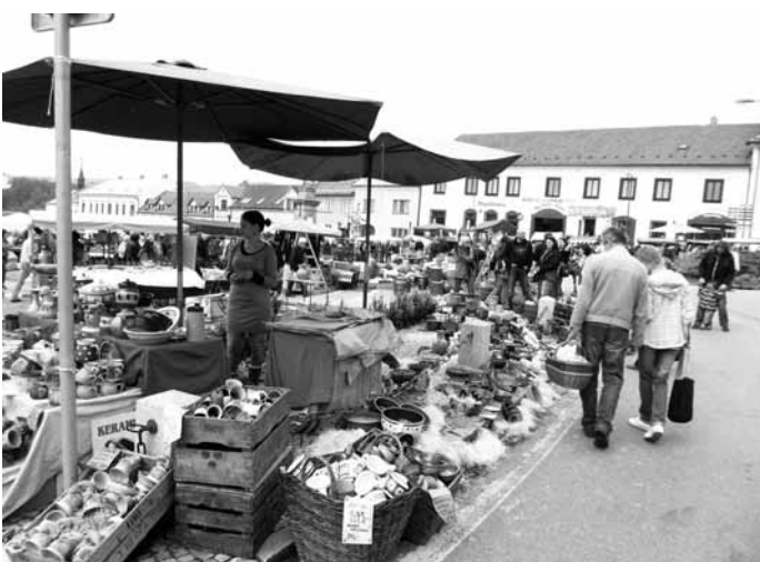
Jarmark. Kunštát hostil o víkendu další ročník tradičního Hrnčířského jarmarku.