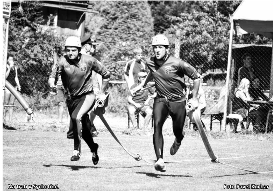
Na trati v Sychotíně.

Poslední soutěž zařazená do letošního ročníku Velké ceny Blanenska v požárním útoku proběhla již tradičně v Sudicích, na travnaté trati do kopce, kterou před samotnou soutěží navíc vydatně promáčel déšť. V sobotu 14. září