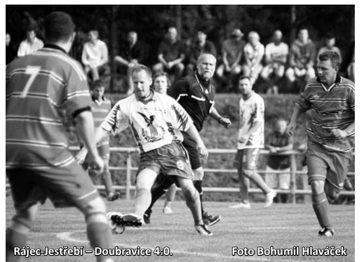
Rájec-Jestřebí – Doubravice 4:0.

Očekávané derby týmů, které se v mistrovském zápase nepotkaly roky, skončilo celkem podle očekávání jasným vítězstvím zkuše-