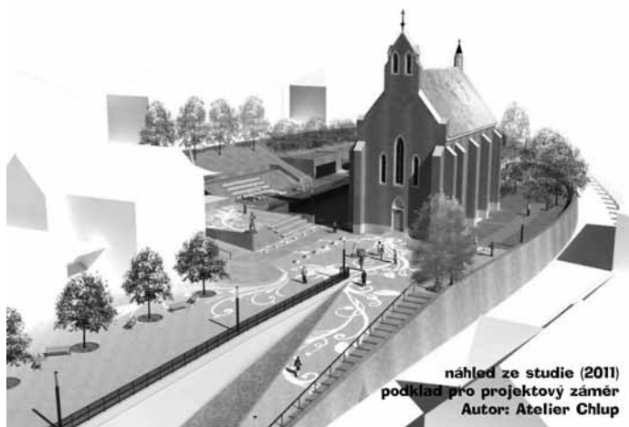
náhled ze studie (2011) podklad pro projektový záměr Autor: Atelier Chlup

A to s důrazem na bezpečnost chodců, cyklistů i turistů, ale také na zeleň nebo odpočinková místa. Půjde celkem o rekonstrukci a zkvatnění plochy o velikosti čtyř tisíc metrů čtverečných. Vznikne také šestnáct parkovacích míst.