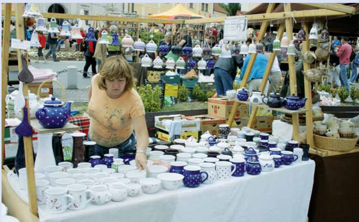
Jarmark. Víkend 15. a 16. září patřil v Kunšátě tradičnímu Hrnčířskému jarmarku. Na jubilejní dvacátý ročník se sjeli keramičtí ze všech koutů České republiky.