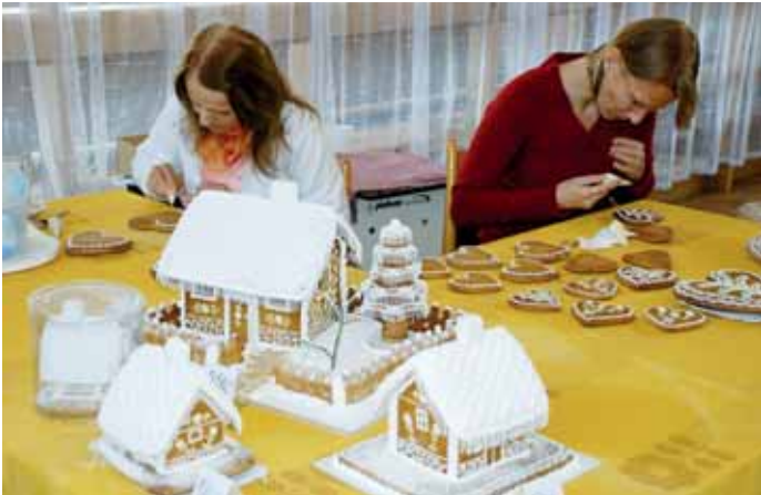
Zábava. Uplynulou sobotu se uskutečnil čtvrtý ročník Sloupského medového jarmarku.

Vyhodnocení letní soutěže s Wellness Kuřim a olympijského testu najdete na internetových stránkách www.zrcadlo.net .