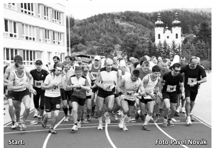
Start.