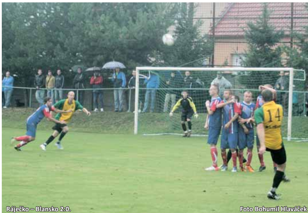
Ráječko - Blansko 2:0.

SK Olympia Ráječko - FK Blansko 2:0 (1:0). Branky: 37. Koutný, 71. Sehnal M. Ráječko: Trubák - Neděla (90. Kopecký), Lajcman, Bartoš, Koutný - Sehnal J., Kupský, Štraj (84. Žilka), Badura (89. Tajnai) - Tenora, Sehnal M. Trenér: Lubomír Zapletal. Blansko: Němec - Bubeníček (C), Maška, Marák, Šíp - Šplíchal - Jarůšek (75. Pernica), Pokorný (83. Zavoral), Beneš, Šenk - Doležel. Trenér: Karel Jarůšek. ŽK: 28. Badura, 67. M. Sehnal, 74. Bartoš - 37. Šíp, 49. Beneš, 57. Bubeníček. Rozhodčí: Strya ml. - Kosička, Sedlák. Delegát: Kratochvíl.