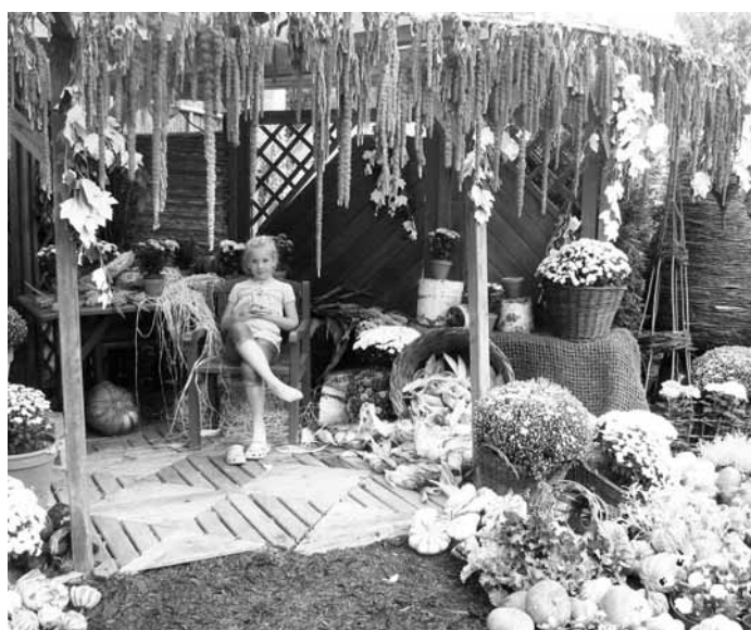
Zeleninový víkend. Zahradnictví u Kopřivů v Šebrově připravilo přehlídku vůní, chutí, barev a tvarů. V rámci akce byla k vidění výstava zeleniny a ovoce, ochutnávky, prodej čerstvé zeleniny a sezónního ovoce místní produkce nebo výstava řezaných a hrnkových chryzantém.