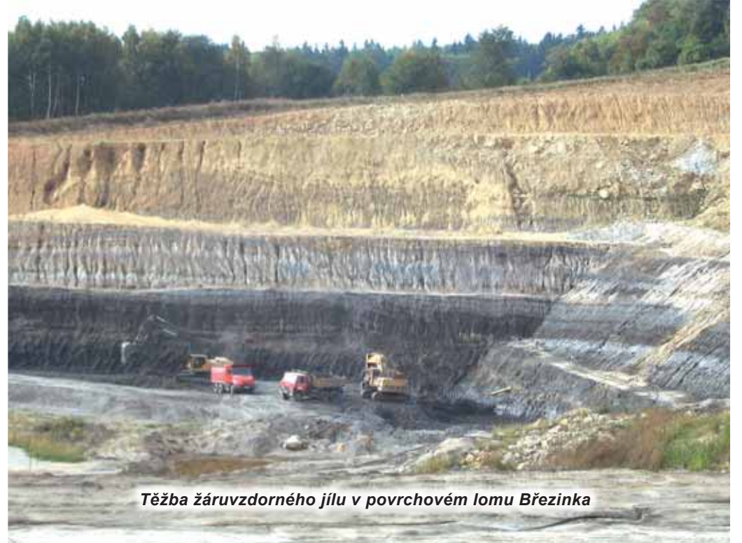
Těžba žáruvzdorného jílu v povrchovém lomu Březinka

Příjem odpadů na skládce probíhá ve všední dny od 6.30 do 14.30 hodin.