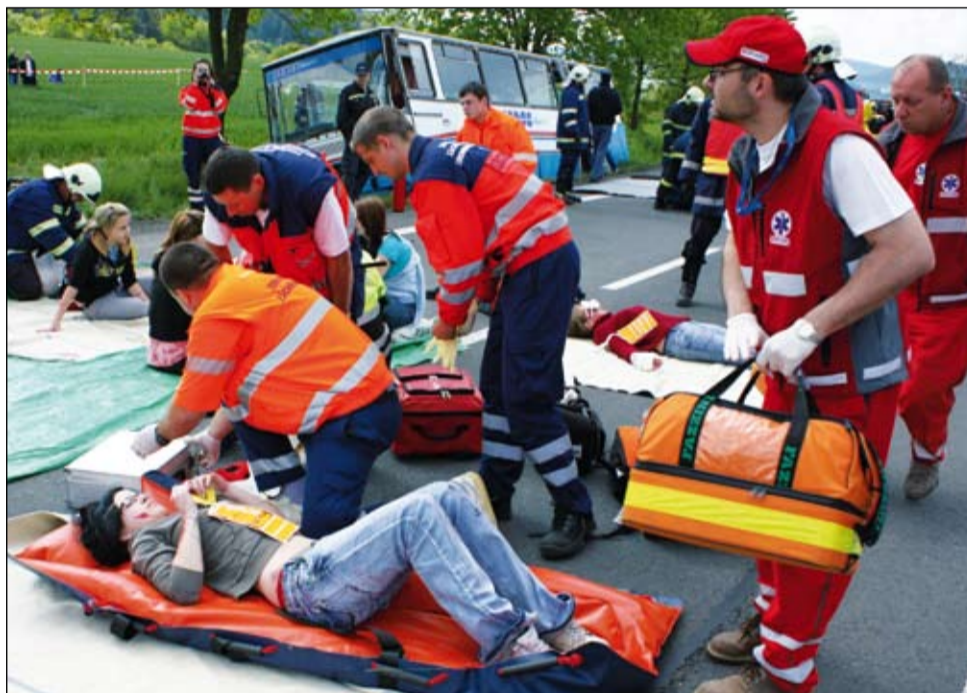
Zásah. Zdravotníci pomáhají účastníkům cvičně nehody na provizorním obvažišti. Jejich roli se převzít zhostily studentky blanenské zdravotní školy.

Zásah složek integrovaného záchraného systému se podle mluvčího Jihomoravských hasičů Jaroslava Haida rozdělil na dva úseky. Na zásah k odstraňování následků úniku nebezpečné látky a souběžně na zásah k vyproštění a záchranu osob z autobusu, a k pomoci zraněným, kteří jsou již venku. „Při pomoci zraněným cestujícím v autobusu se záchranáři kromě vyproštění lidí z vozidla a poskytování první pomoci soustředili na třídění a další ošetření zraněných a jejich transport do nemocnic. V blízkosti nehody mimo nebezpečnou zónu bylo zřízeno shromaždiště zraněných, na místo