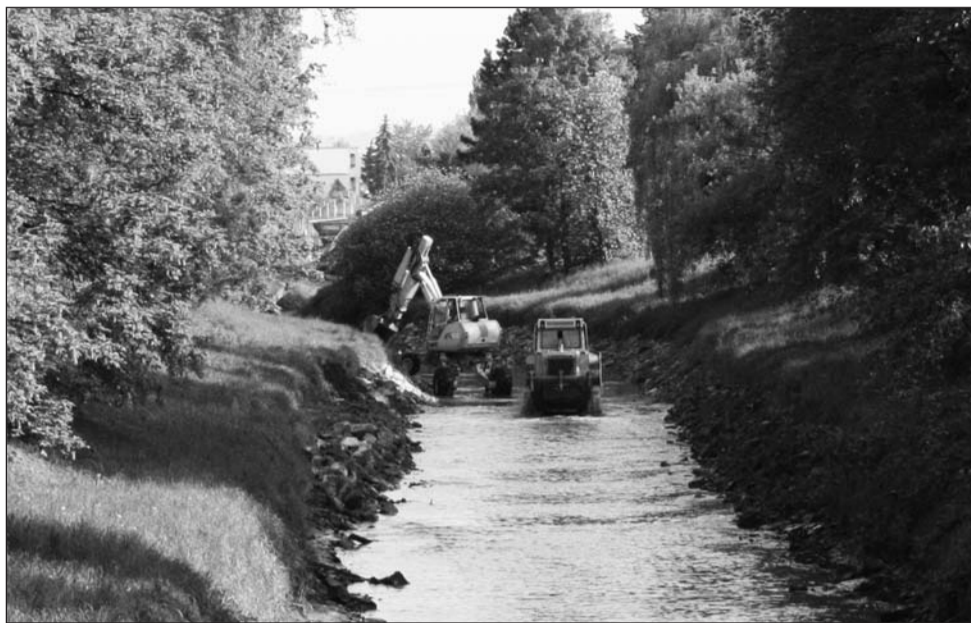
Regulace. V korytu řeky Svitavy v Blansku se usadily stavební stroje.

Svitava bude upravena v úseku přes město, ne dál až k Bílo-