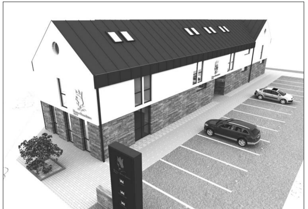
Představa. Takto by měl vypadat budoucí tříhvězdičkový hotel s wellness centrem na náměstí Klementa Bochořáka v Kunštátě. Vizualizace 3d atelier

„V dnešní době není jednoduché, aby fyzická osoba samostatně financovala takový náročný projekt. Musí tam být vzájemná spolupráce s městem či krajem, např. na přípravě