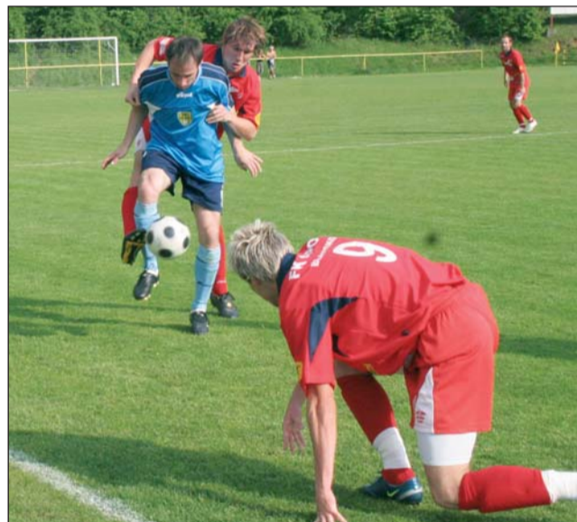
Pád na dno. Druhá domácí porážka v řadě znamená pět kol před koncem tristní postavení na dně tabulky.