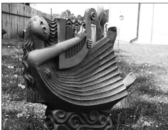
Plastiky. Keramika instalovaná v zámecké zahradě pochází z dílen autorů tvořících v Kunštátě a jeho okolí.

Zaměstnanci zámku výstavou chtějí představit tvorbu spíše těch menších, nezávislých keramiků z Kunštátu. „Naším cílem je vytvořit jakousi květinovou tradici, aby u nás místní keramici mohli ukázat svoji tvorbu. Myslím si,