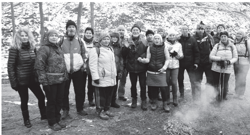
Tradiční mikulášskou vycházku do Moravského krasu uskutečnili boskovičtí turisté první prosincovou sobotu. Potěšila pěkná účast devatenácti turistů, kteří ušli patnáct kilometrů.