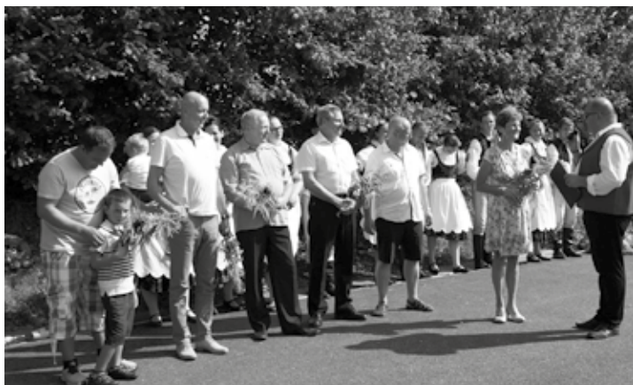
Ve Viskách se uskutečnila tradiční dožínková slavnost.