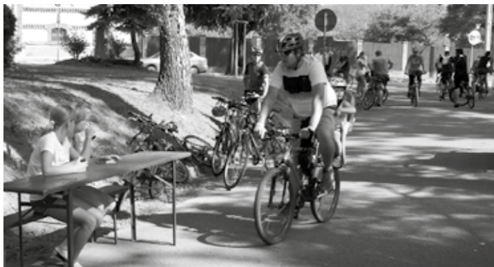
Poslední srpnový den patřil také cyklistům. Tradičního - již 13. ročníku - cyklovýletu Okolo Malé Hané se zúčastnilo rekordních 1079 zaregistrovaných cyklistů. Bohatý program čekal na účastníky v cíli na výletišti ve Vanovicích.