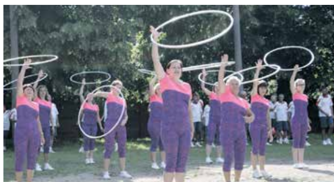
Oblastní Slet sokolské župy Krále Jiřího přilákal na sokolské cvičiště v Jedovnicích stovky diváků. Působivý průvod cvičenců městysem a dvanáct skladeb přesvědčilo, že sokolové jsou dobře připraveni na červencový XVI. všesokolský slet do Prahy.