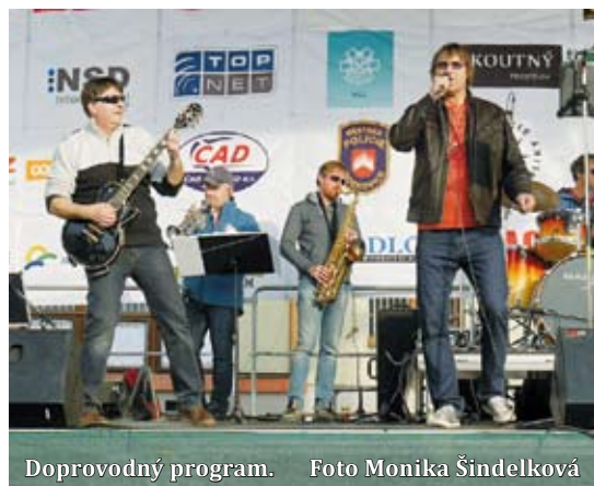
Doprovodný program.