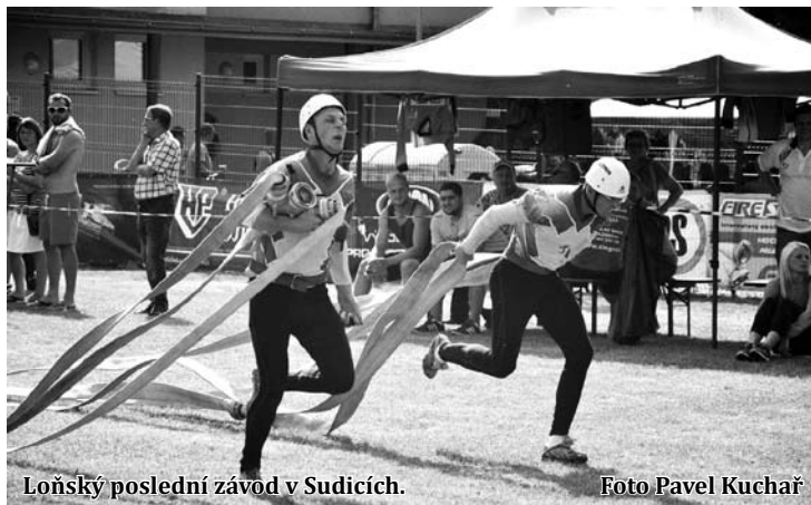
Loňský poslední závod v Sudičích.