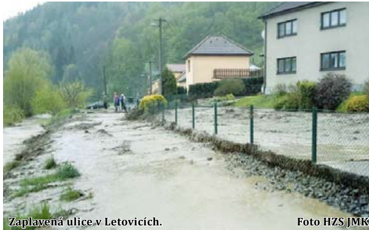
Zaplavená ulice v Letovicích.

„Čeká se, až přijede statik a silničáři, kteří posoudí, zda je možné po silnici bezpečně jezdit. Hrozí, že se sesune i část vozovky,“ uvedl v pátek na místě letovický starosta Vladimír Stejskal (ODS).