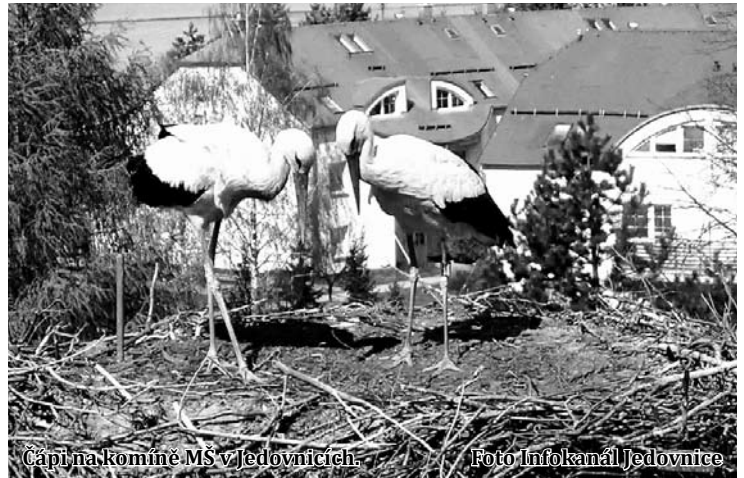
Čápi na komíně MŠ v Jedovnicích.

„Krásně na ně vidíme z oken jedné budovy školky a často nám také létají kolem oken, nebo nad hlavami dětí, když jsou na zahradě. Čápi