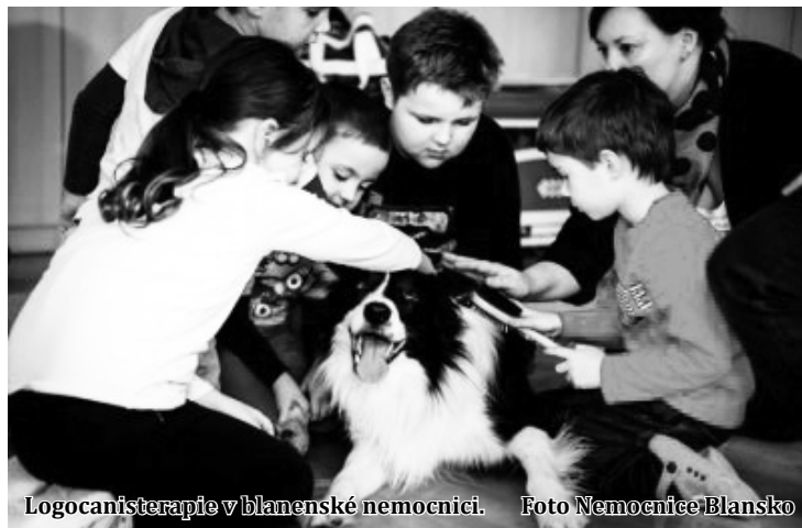
Logocanisterapie v blanenské nemocnici.