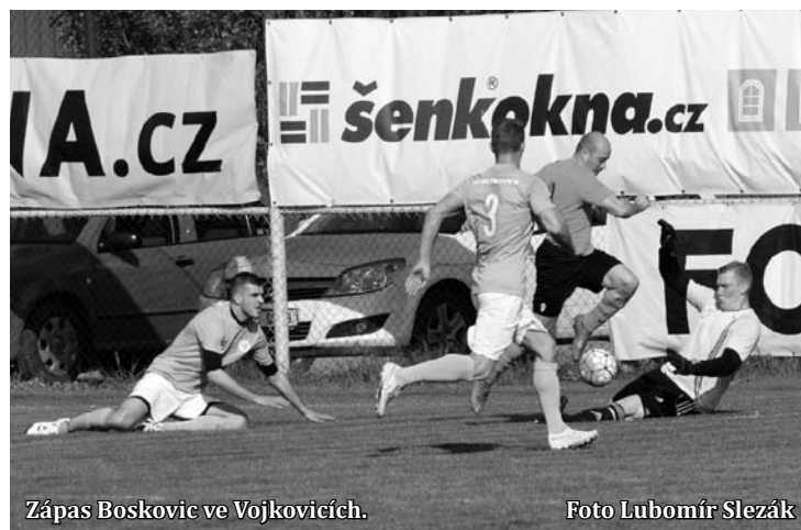
Zápas Boskovic ve Vojkovicích.