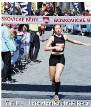
V cíli.