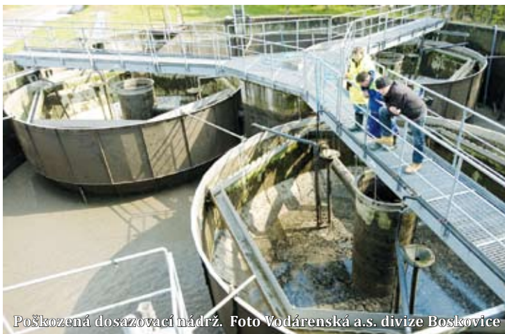
Poškozená dosazovací nádrž.

na na dvoutřetinový výkon a bude tomu tak až do plánované rekonstrukce. Situaci na toku řeky Svitavy pod čistírnou monitoruje také Česká inspekce životního prostředí, která