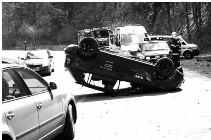
Havárie. Jedno zranění si vyžádala dopravní nehoda, ke které došlo na silnici mezi Šebrovem a Blanskem.

Letovice - Osm hliníkových radiátorů, část plynového kotle, čtyři vodovodní baterie a dvanáct kusů držáků umyvadla si odnesl zloděj z bývalé ubytovny jedné z letovických firem. Stalo se tak mezi 19. a 21. dubnem. Do budovy se pachatel dostal po poničení visacího zámku a vylovení vstupních dveří. Způsobil tak škodu za více než dvacet tisíc korun. (hrr)