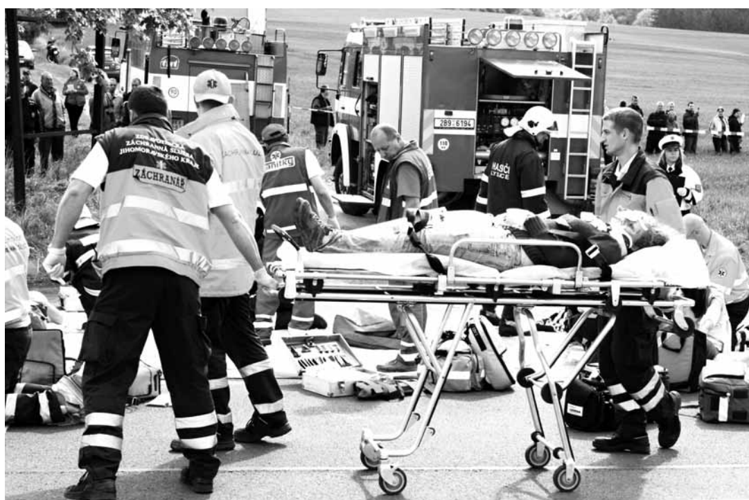
Cvičení. Posílit záchrannou chtějí starostové také proto, že mají v regionu nebezpečnou silnici I/43. Fotografie pochází z loňského cvičení složek integrovaného záchranného systému.

Podle jeho slov chtějí současný stav dále rozporovat. Sanita s lékařem totiž vyjíždí také k takzvaným sekundárním převozům, tedy