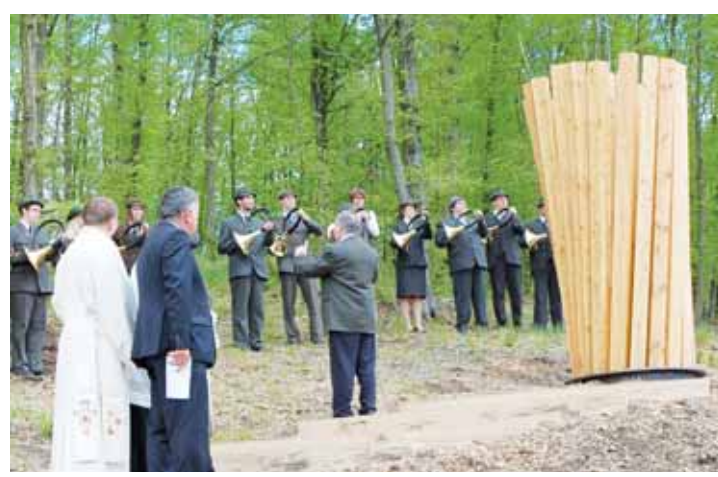
Fanfára. Třicet trubačů zahrálo při žehnání nových božích muk nad Křtinami.

Přítomní si připomenuli, že v těchto dnech uplynulo osm set let od zjevení Panny Marie v nedaleké Bukovince. Tehdy vznikl silný mariánský poutní kult a Křtiny se staly největším poutním místem na Moravě. To byl také důvod, proč zde byl posta-