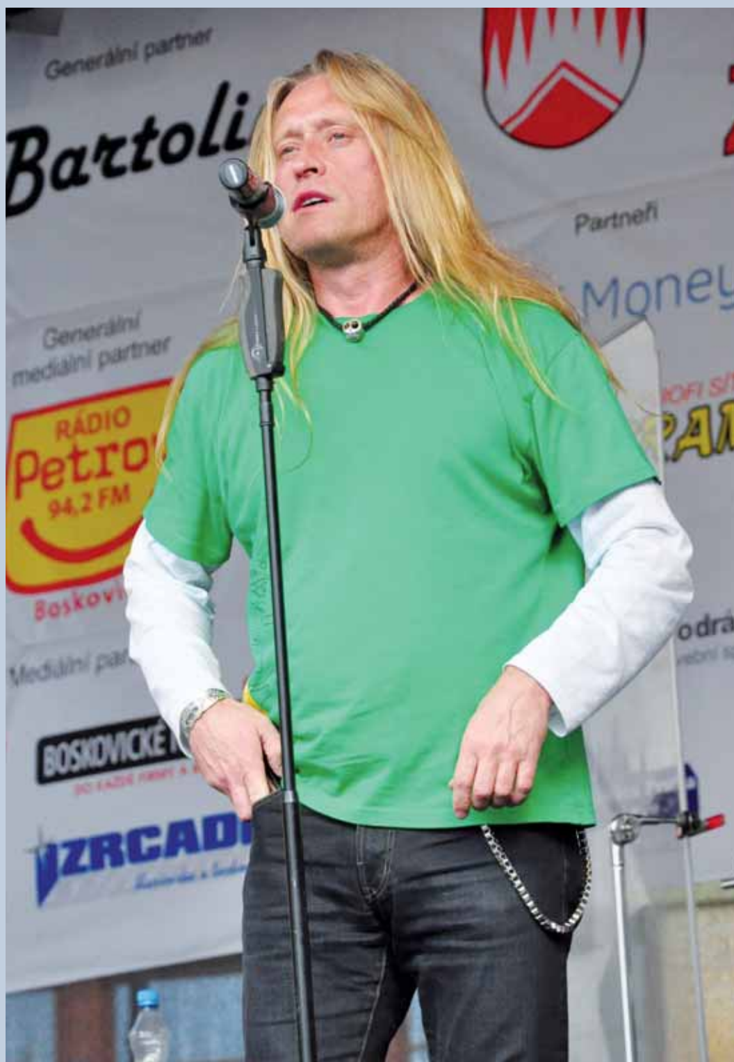
První máj. Součástí sobotního Běhu za sedmizubým hřebenem v Boskovicích byl i bohatý kulturní program. Jeho vrcholem bylo vystoupení zpěváka Kamila Střihavky. (více o celé akci na str. 7)