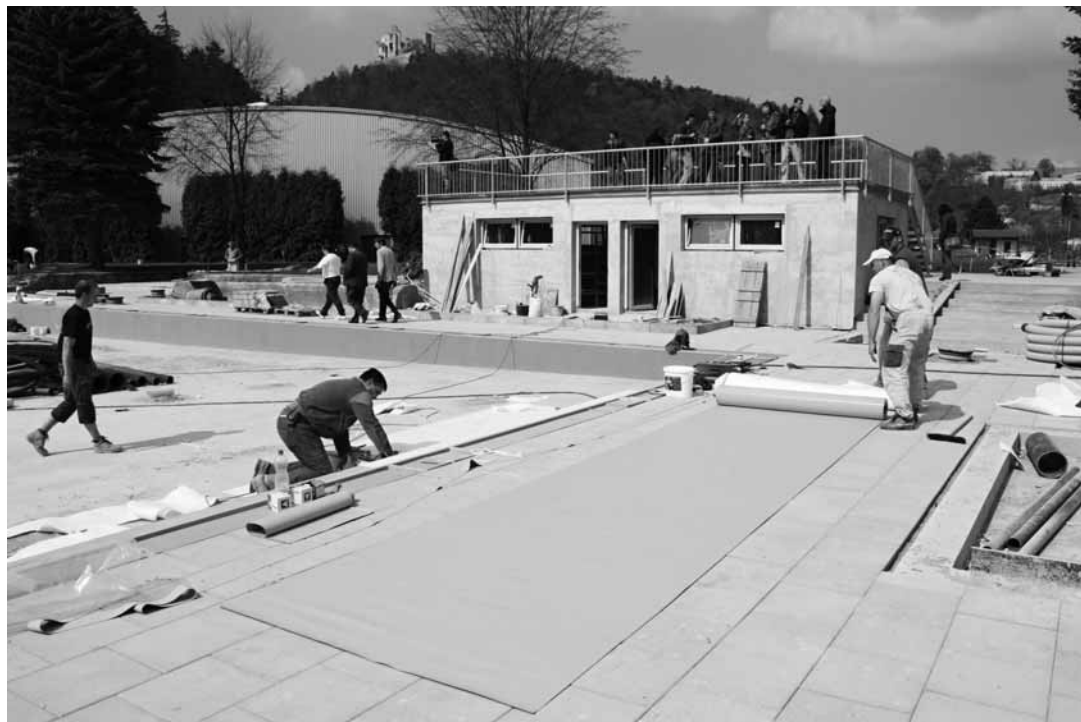
Koupaliště. Dělníci pracují na dokončení boskovického plaveckého areálu. Více fotografií najdete na našich webových stránkách www.zrcadlo.net .

Podle něj se při stavbě vyskytly i problémy. Pětadvacet let starý areál připravil stavbařům například překvapení s kanalizací. Ta se původně neměla rekonstruovat. Když ale