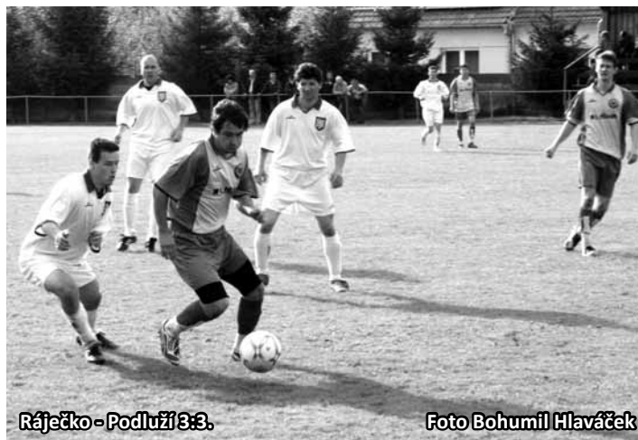
Ráječko – Podluží 3:3.

Po změně stran se ale z kabin vrátili hosté jako polití živou vodou. V 59. minutě přišlo jejich snížení stavu. Po přečíslení obrany díky ukázkové kombinaci přišlo snížení.