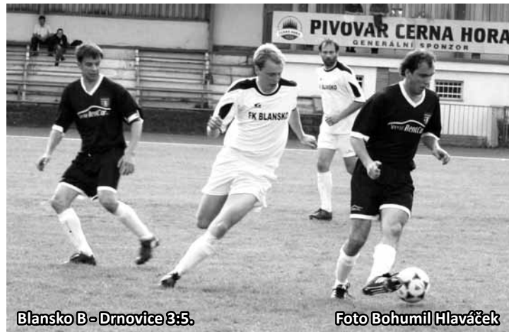
Blansko B – Drnovice 3:5.

Lysice – Víska 1:1 (0:0) , Jonáš – Šmeral V.