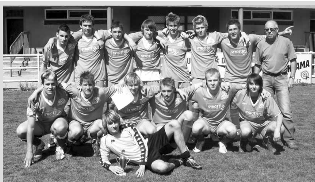
Vítězný tým. Okresní přebor středních škol v kopané se stal letos kořistí mužstva boskovické střední školy André Citroëna, která ve finále zdolala na penalty SPŠ Jedovnice.

Překvapením bylo druhé místo osměho nasazeného týmu ASK Blansko a naopak až třetí příčka hlavního favorita turnaje z Adamova. Boskovické áčko skončilo šesté. (bh, hub)