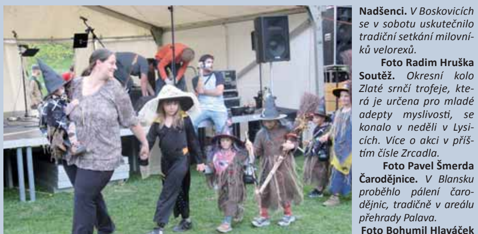
Nadšenci. V Boskovicích se v sobotu uskutečnilo tradiční setkání milovníků velorexů.