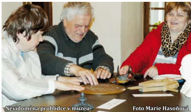
Nevidomí na prohlídce v muzeu.

Děti ze základních škol si mohly prohlédnout různé pomůcky, které nevidomí potřebují ke svému životu. Od slepecké hole přes speciálně uzpůsobené společenské hry po technické pomůcky, například indikátor barev. Pokračování na str. 6