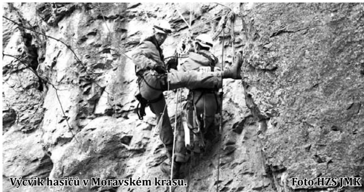
Výcvik hasičů v Moravském krasu.

Tým instruktorů připravil úkoly, které během týdne lezci „nováčci“ plnili. Postavení vlastního zázemí v podobě stanů, byl první z nich. Od procvičení základních lanových technik výcvik postupně směřoval k řešení náročných týmových úkolů v podobě záchrany paraglidisty ze stromu, vyhledávání a transport