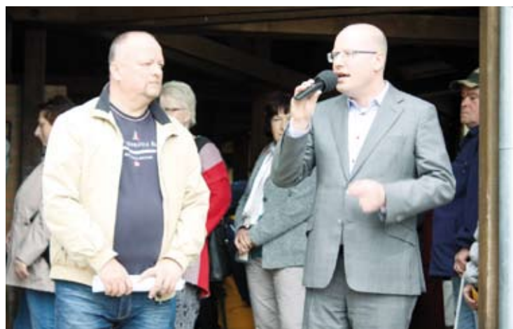
PREMIÉRSKÁ NÁVŠTĚVA. Oslavu Svátku práce na přehradě v Blansku navštívil premiér Bohuslav Sobotka. Na snímku se starostou města Ivo Polákem.

Stálé komorní divadlo v suterénu hotelu Dukla má mít podle návrhu divadelníků kapacitu asi 150 diváků. Jeho součástí má být i divadelní kavárna a potřebné zázemí. Vybudování scény má přijít až na pětadvacet milionů korun. Michal Záboj