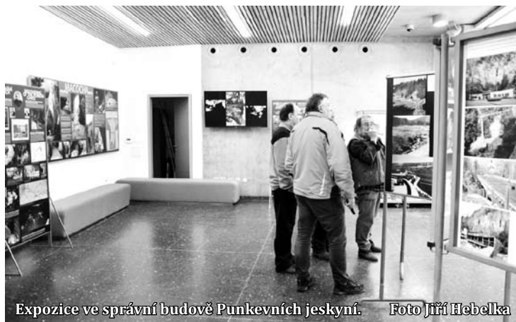
Expozice ve správní budově Punkevních jeskyní.

kevními jeskyněmi byla dokončena loni na podzim. Její stavba přišla na více než šedesát milionů korun. Objekt podle návrhu architektonické kanceláře Burian - Krivinka se stal Stavbou roku Jihomoravského kraje 2015.