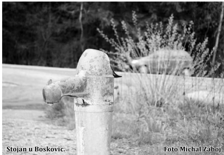
Stojan u Boskovic.