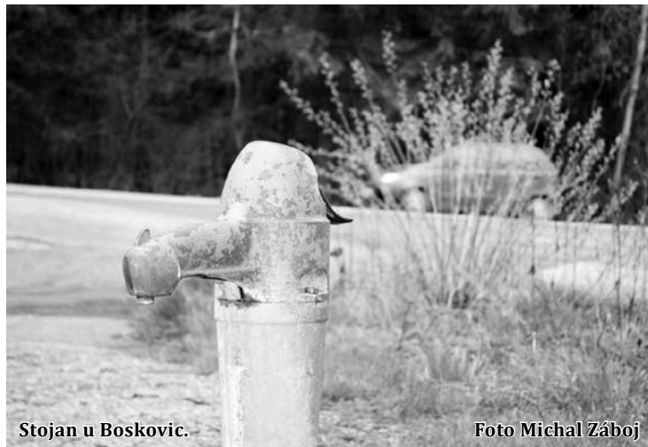
Stojan u Boskovic.