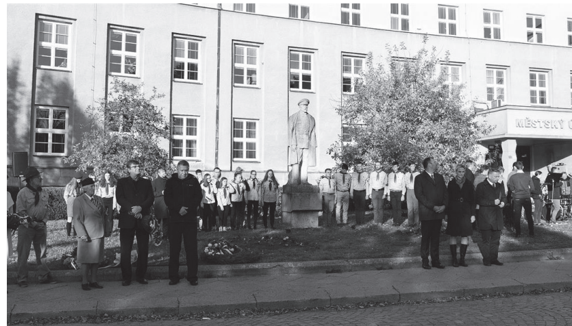
Dne 28. října si celá Česká republika připomíná Den vzniku samostatného československého státu a stejně tak tomu bylo i v Boskovicích, kdy jsme si u památníku T. G. Masaryka připomněli již 103. výročí založení samostatného Československého státu.