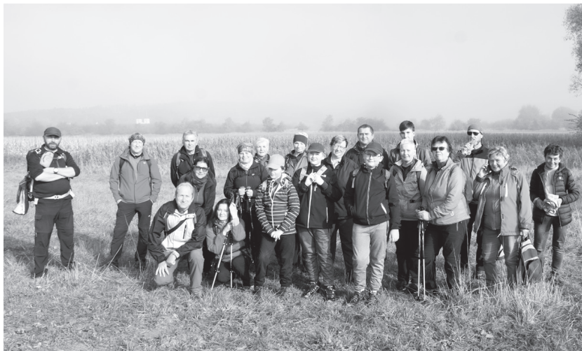
Boskovičtí turisté oslavili 28. říjen vycházkou na severovýchod od města. Krásného počasí využilo celkem třiaadvacet turistů všech věkových kategorií.