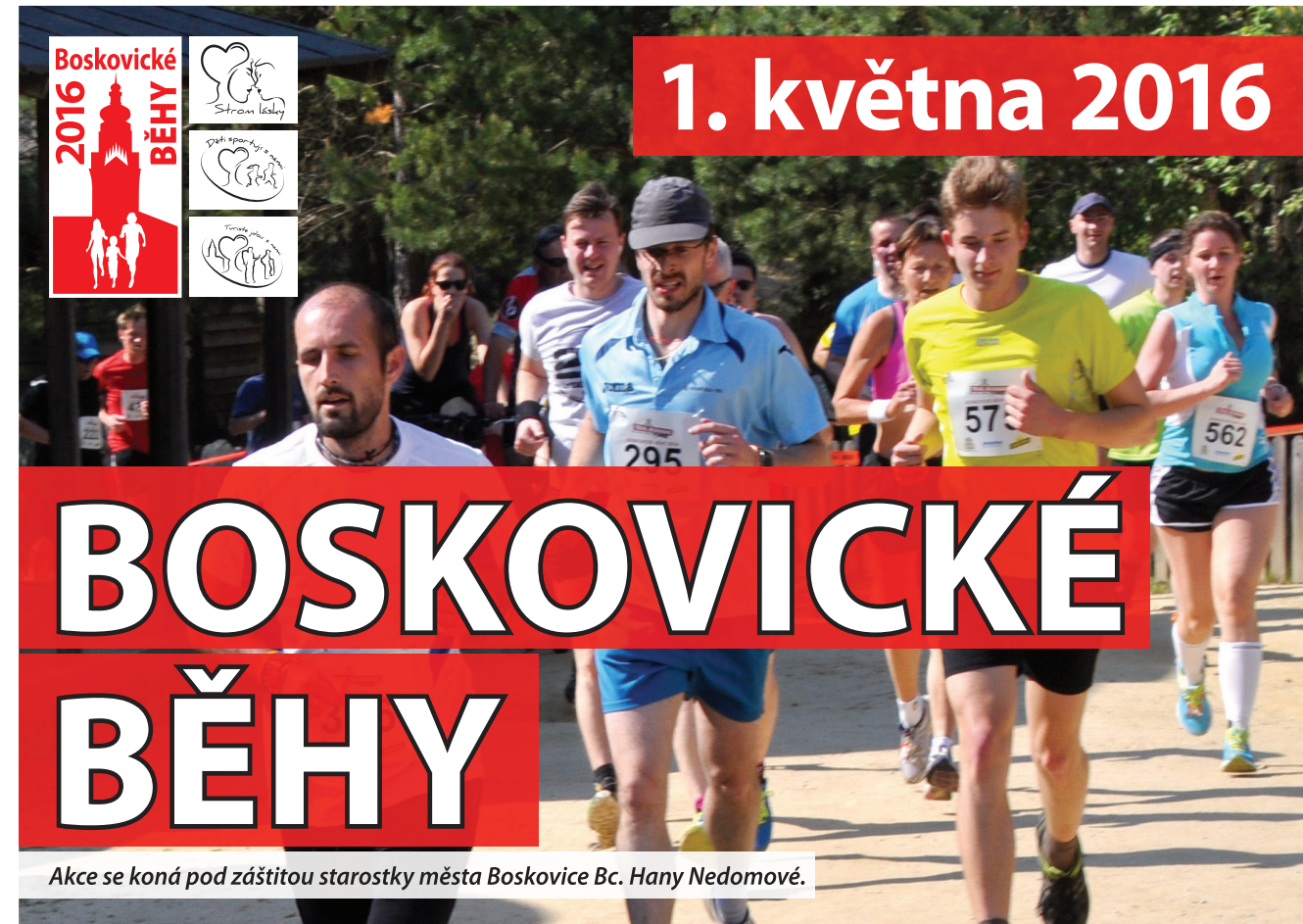
Akce se koná pod záštitou starostky města Boskovice Bc. Hany Nedomové.