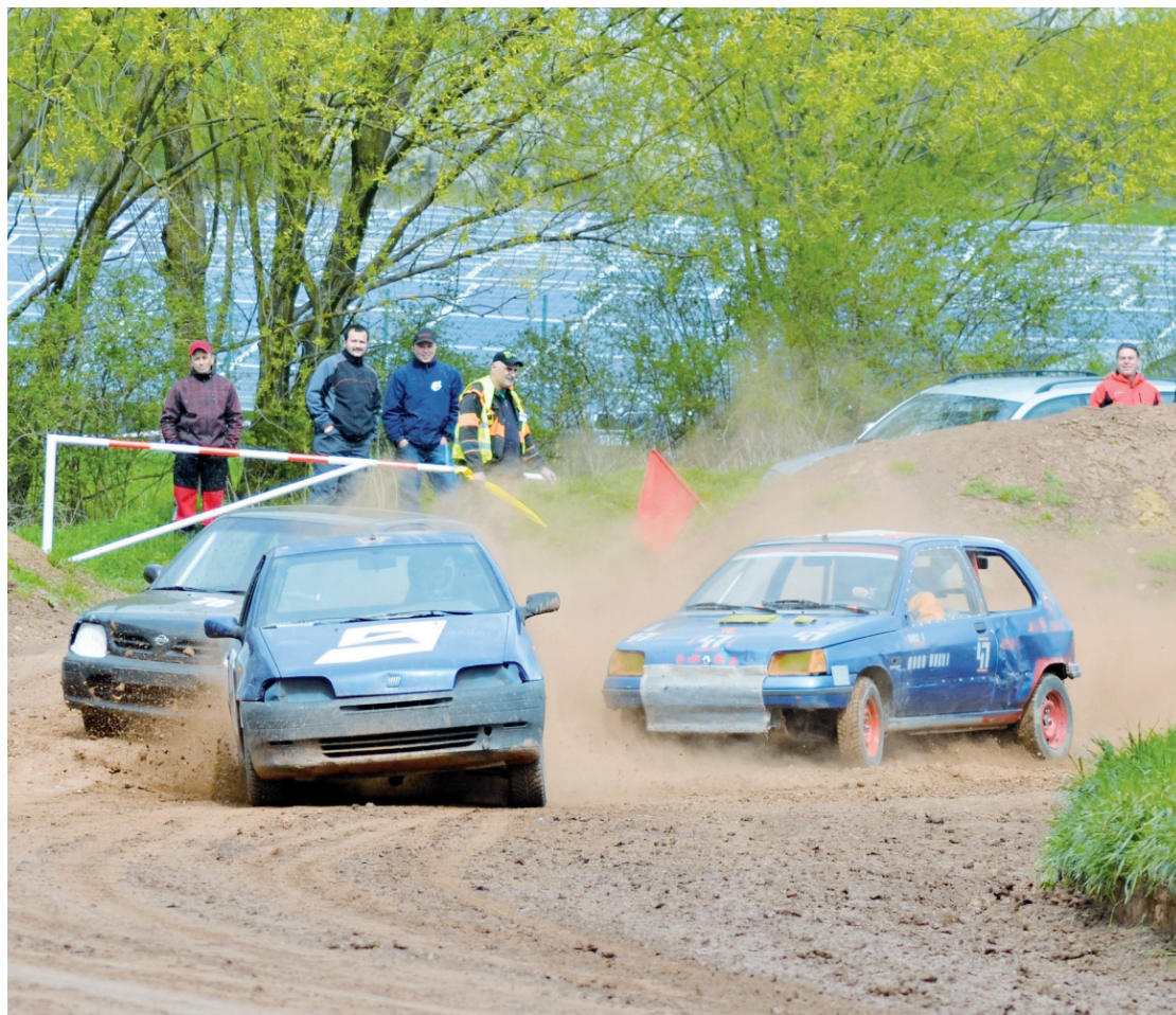
ZÁVODY. Autokrosový klub Boskovice uspořádal v neděli 24. dubna závody v Chrudichromské roklí. I přesto, že počasí závodům vůbec nepřálo, 56 strojů se svými řidiči přilákalo k trati úctyhodný počet diváků. Třetí závod se jede v neděli 15. května.