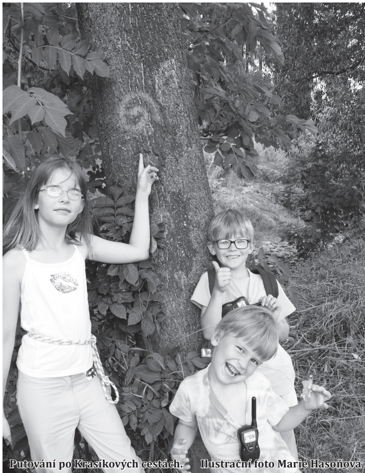
Putování po Krasíkových cestách.

„Stačí objevit osm schránek, které jsou rozmístěny po Krasíkově pohádkovém království na území Moravského krasu a získat všech osm částí kódu, které jsou v nich ukryty. Ty pak soutěžící vyplní do archu a získají souřadnice poslední