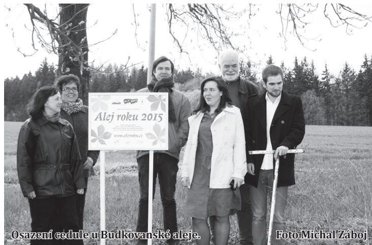
Osazení cedule u Budkovanské aleje.