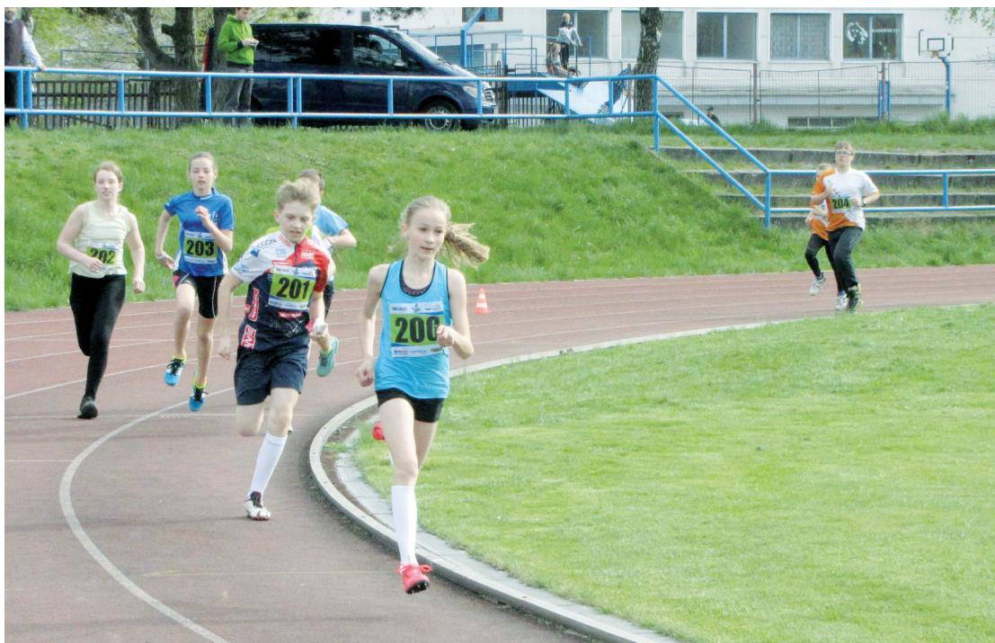
BĚŽECKÁ LIGA. V rychlém tempu pokračuje Okresní běžecká liga. Minulý pátek se atleti utkali na dráze v Blansku, dalším závodem budou příští neděli Boskovické běhy.

Znění inzerátu a počet opakování pošlete na e-mail radkovainzerce@zrcadlo.net.