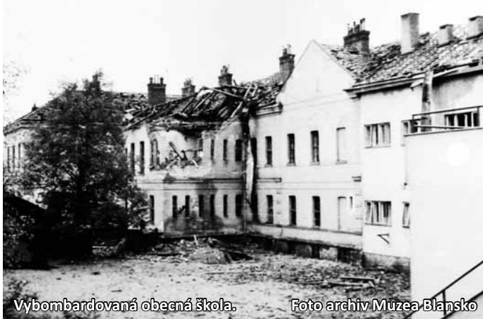
Vybombardovaná obecná škola.

Autor je historik Muzea Blansko Další foto na www.zrcadlo.net