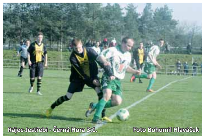
Ráječko-Jestřebí - Černá Hora 3:1.