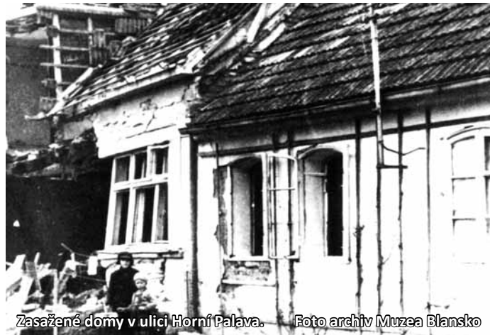
Zasažené domy v ulici Horní Palava.