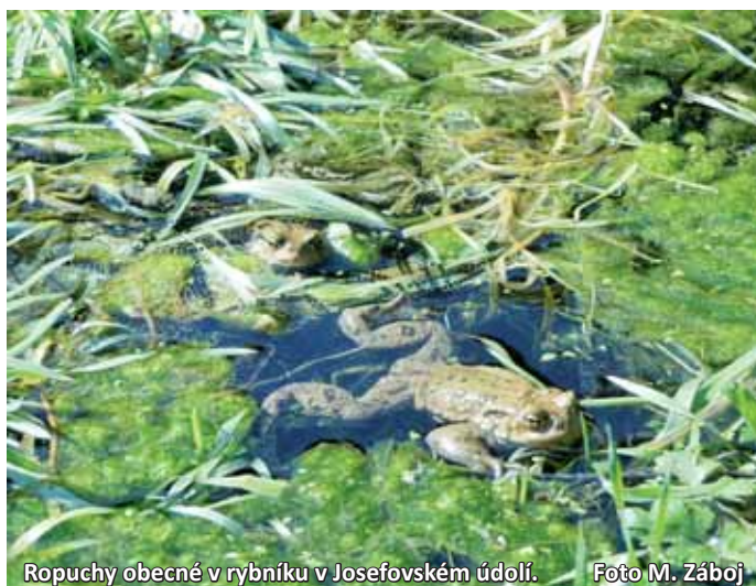
Ropuchy obecné v rybníku v Josefovském údolí.

Hlavní část letošního velkého přesunu obojživelníků nastala v sobotu jedenáctého a v neděli dvanáctého dubna. „Tehdy se na konci týdne otevřelo a přišla místní bouřka. Táhlý především ropuchy, čtrnáct dnů před tím táhla velká část skokanů hně-