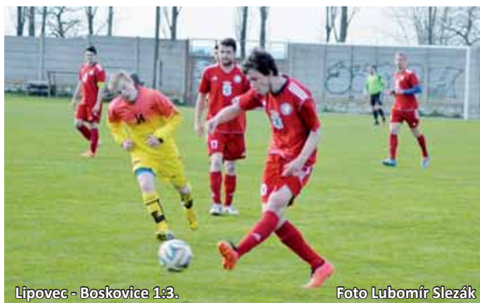
Lipovec - Boskovice 1:3.