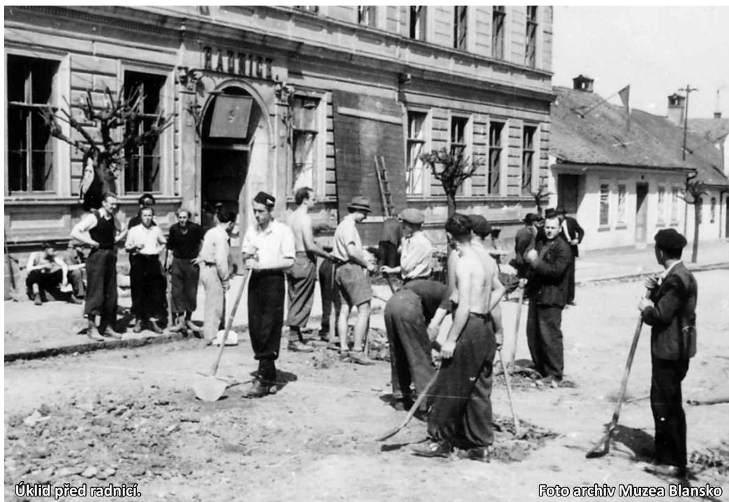
Úklid před radnicí.

Blansko, ačkoli bylo v době 2. světové války střediskem válečné výroby, až do května 1945 leželo v relativně klidném zázemí. S přibližováním fronty se však i zde objevovaly průjezdy vojenských kolon, a ve městě byl zřízen lazaret a ve školách a Ježkově továrně byli ubytováni němečtí vojáci. Sovětské letectvo provádělo v dubnu 1945 ofenzivní akce proti stále urputně bojujícímu protivníkovi, mj. bylo napadáno i město Brno. 25. dubna 1945 pak bylo napadeno i Blansko. Nálet provedla 218. bitevní letecká divize Rudé armády, vybavená lehkými bombardéry americké výroby Douglas A-20 G Havoc, které ovšem sovětská letci nazývali Bostony, a to podle názvu užívaného pro tento typ letounu v britské RAF. Tyto lehké bombardéry se do SSSR dostaly v rámci dodávek Lend and Lease a jejich verze G byla kromě pumovnice, schopné pojmout 2000 liber (tedy asi 910 kg) pum a společně pro všechny verze stroje, vybavena i mohutnou hlavňovou výzbrojí v přední, tvořenou čtyřmi 20 mm kanóny a dvěma kulomety ráže 12,7 mm. Takto vybavené stroje byly ideální k provádění nízkých bitevních náletů a ničení techniky a živé síly protivníka. Při náletu na Blansko svrhly sovětské stroje asi 300 pum. Vzhledem k charakteru sovětských náletů na Brno, prováděných v téže době, lze předpokládat, že sovětská letci použili větší množství lehkých pum o váze 20 až 50 kg, čemuž naznačuje i charak-