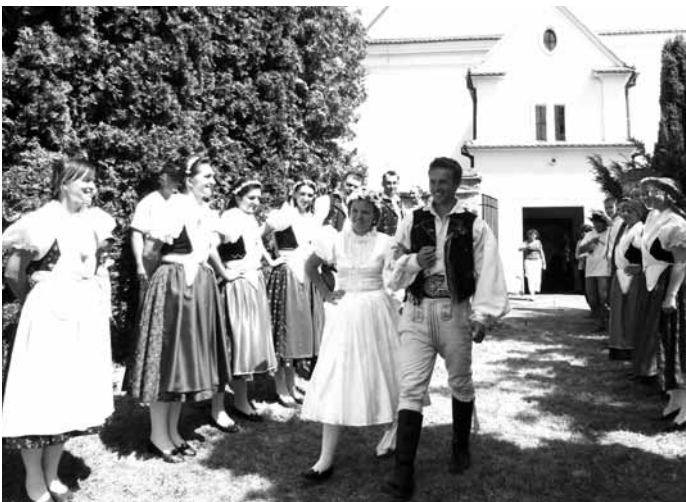
Jarmark. Součástí 4. Malohanáckého řemeslného jarmarku ve Vanovících byla také ukázka tradiční svatby.

Za ČsOL - odbor péče o válečné veterány Dr. Jan KUX