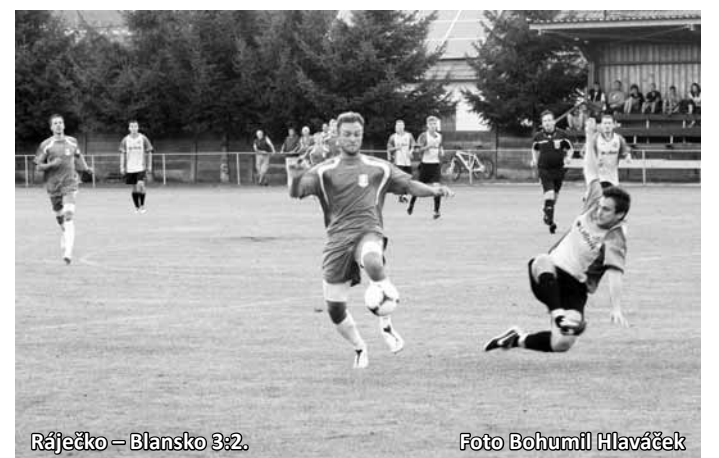
Ráječko - Blansko 3:2.

To teď vůbec nedokážu říct, nechci předjímat. Jestli ta situace nastane, bude to příjemné přemýšlení. Je to o jiných podmínkách, financí, řešili bychom to, až by to nastalo.