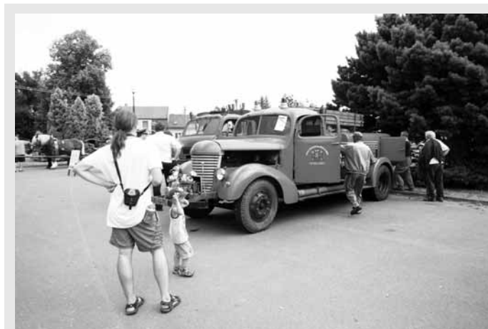
Oslava. Hasiči ve Velkých Opatovicích si připomněli 140 let od založení svého sboru.

Po celou dobu našeho pobytu v jeskyni bylo u pokladny živo. Dispečerka prodávala lístky a povolenky k focení, sledovala počty návštěvníků v jednotlivých skupinách, oznamovala začátky prohlídek, kontrolovala pohyb po jeskyni. Na odpočinek nebyl čas. Horké léto, to jsou zkrátka po pracovních jeskyní dny nejvyššího nasazení.