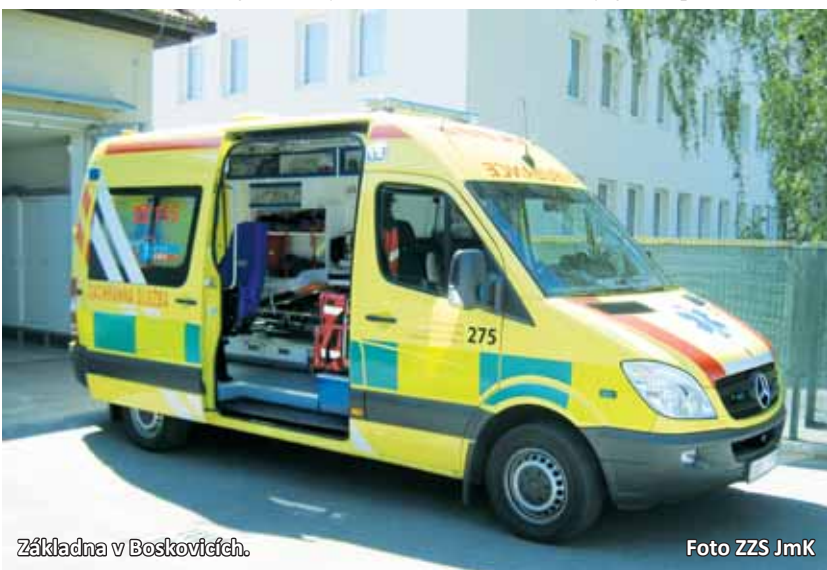
Základna v Boskovické.