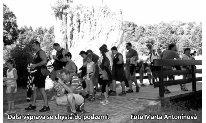
Další výprava se chystá do podzemí.

Pracovní den v jeskyni končí posledním vstupem na dlouhý a krátký okruh. Teď v létě odcházejí poslední návštěvníci na dlouhý okruh o půl čtvrté. Průvodce musí všechno zkontrolovat a pozamykat. O půl páté odchází poslední krátký okruh, je nutné pozhasnat světla, po návratu odevzdat klíče a ovladače od jeskyně dispečerovi. Průvodci, kterým už poslední prohlídka skončila, se podílejí na úklidu. Odnášejí odpadky. Běžnou údržbu si pracovníci jeskyně dělají sami, včetně umývání. Největším problémem jsou žvýkačky přilepené na nejnemožnějších místech.