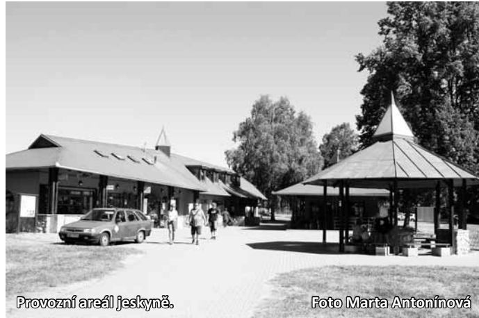
Provozní areál jeskyně.

„Základ našeho průvodcovského kolektivu tvoří studenti. Mnozí z nich začínají už kolem šestnácti let a vydrží i během celého vysokoškolského studia. Zájem je velký, ale ne každý vydrží. Je to práce náročná a musí vás prostě chytit. Průvodce nejen vykládá