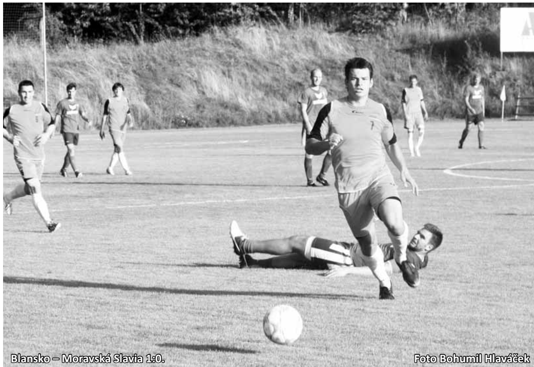
Blansko - Moravská Slavia 1:0.

Poslední příprava před mistrovským svojí úrovní zklamala. Brňané hráli ze zabezpečené obrany a Blansko, kterému evidentně chyběl tvůrce hry, který by jí dal myšlenku, si s tím nevědělo rady. Jediná branka podprůměrného