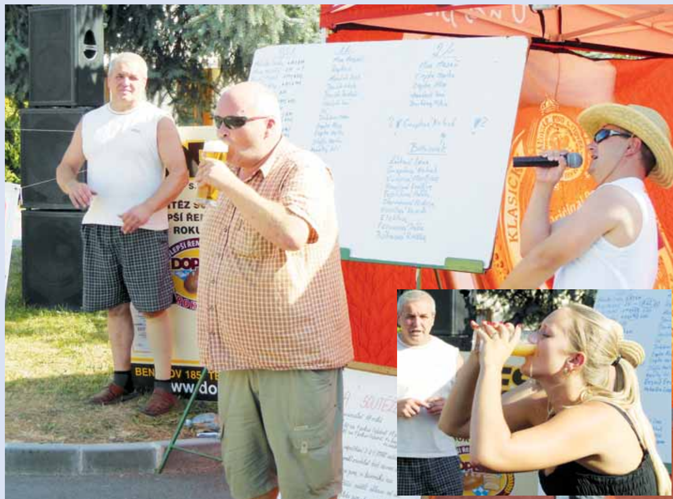
Na čas. Vypít co nejrychleji půllitr, tuplák a máz piva nebo bavorák. Takový úkol čekal na soutěžící při Okrouhlečském tupláku.