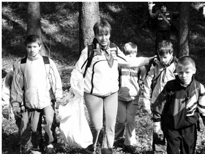
Pomocníci. Z boskovického dětského domova přijelo pomáhat deset dětí. I díky jim je kras po dlouhé zimě zase čistý.

Na stezkách kolem Olomučan se o pořádek postarali například