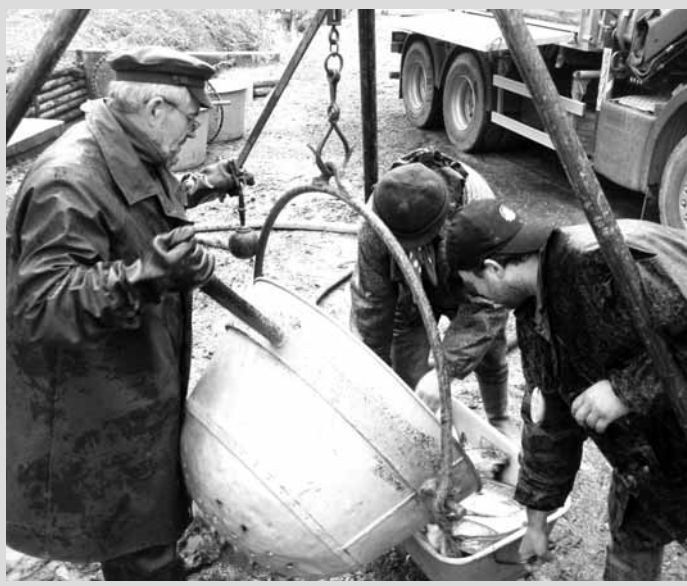
Přelov. K začátku jara patří i tradiční přelov jedovnického rybníka Budkovan. Do sousedního Olšovec se tak ve velkém stěhovali především kapři, ale také štiky. Rybáře upoutal i mladý sumec albin, ten ale zůstal doma v Budkovanu.