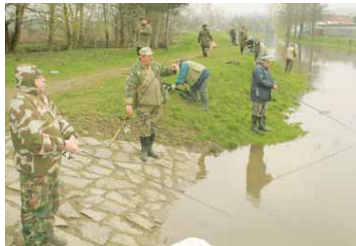
U Svitavy. Blanensští rybáři zahájili pstruhovou sezonu uplynulý pátek.

Proč ryby nebraly? „Voda byla po dešti hodně vysoká a proudná. Vlastní podkalení až tak pstruhům