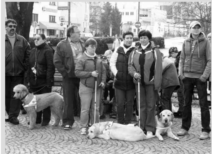
Soutěž. Již osmdesát se sešli v pátek v Blansku majitelé vodících psů na jejich soutěži Cesta ve tmě. Dějištěm bylo náměstí Republiky a jeho okolí.