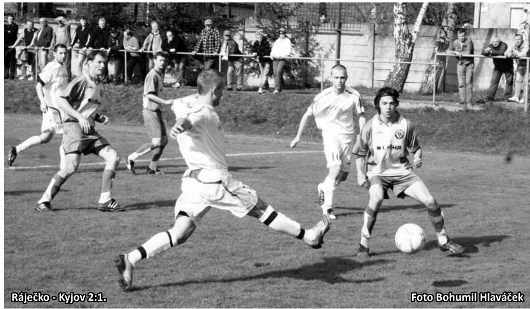
Rájčko - Kyjov 2:1.

Příští kolo: Židenice – Znojmo B, Kuřim – Hodonín, Ratíškovice – Bavyry, Sparta – Ivančice, Bohunice – Tasovice, Kyjov – Velká, Podluží – M. Krumlov, Rájec-Jestřebí – Rájčko.