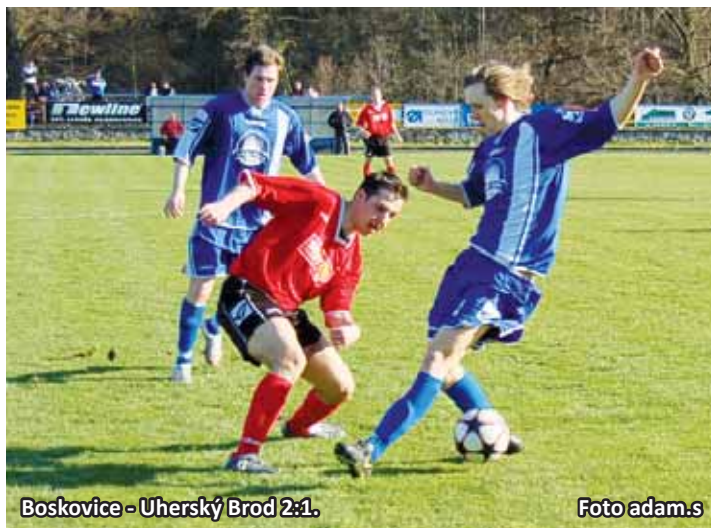
Boskovice - Uherský Brod 2:1.