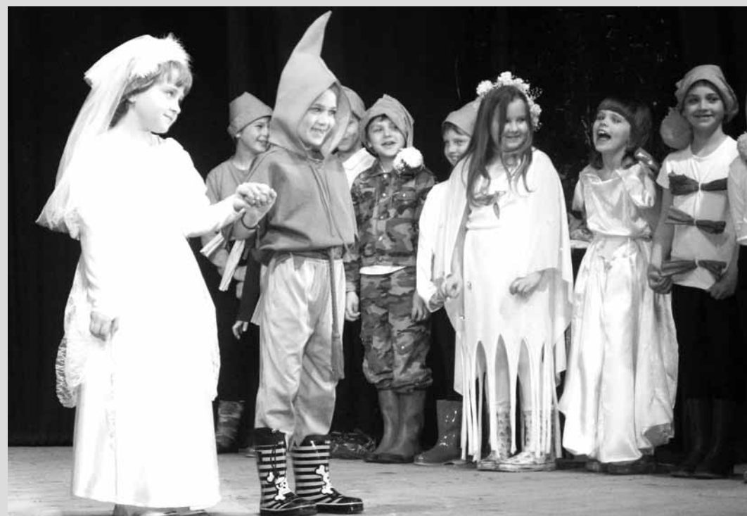
Akce. Děti z prvního stupně Základní školy v Lysicích se převdaly v neděli svým rodičům, sourozencům, babičkám, dědečkům, tetám a strýcům v místní sokolovně na školní akademii. Více než hodinu a půl trvajícím programu vyplnily písničky, tancování, recitace a scény.