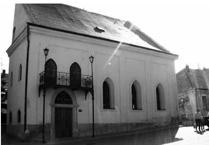
Památka. V synagoze se budou opravovat různé dřevěné prvky a dojde k jejím odvlhčení.

„Výhodou integrovaných dotačních programů jako tento je fakt, že nabízejí stoprocentní podporu, což je pro nás velká výhoda. Dalším kladem projektu je také to, že