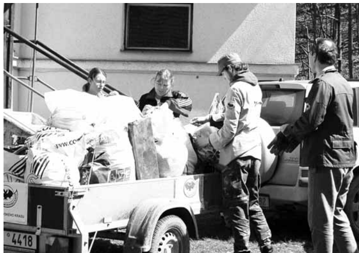
Odpadky. Desítky pytlů naplněných odhozenými papíry, lahvemi a dalšími nepořádkem svázely k základně CHKO na Skalním mlýně skupiny dobrovolníků. Přistavené kontejnery se rychle plnily.

organizací a firem, které poskytly kontejnery, pytle na odpadky, ale také třeba umožnily bezplatný odvoz brigádníků.