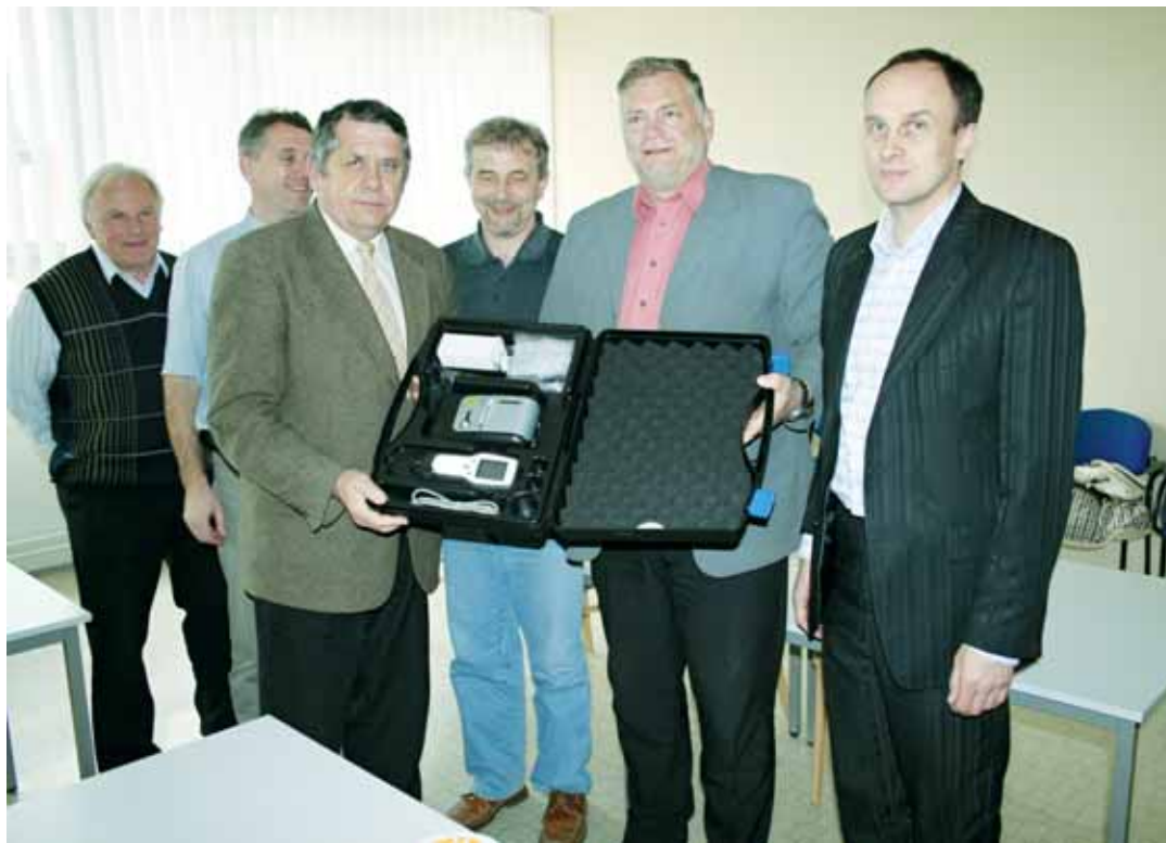
Cenný dar. Zástupci Letovic, Velkých Opatovic, Svitávky a Olešnice koupili policistům nový tester alkoholu.

„Policisté na území obvodního oddělení Letovice budou tento přístroj využívat při silničních kontrolách, kdy se svým preventivním působením snaží předejít hrozcím velkým neštěstím a tragédiím, což s sebou alkohol u řidičů motorových vozidel zpravidla přináší. Využití najde také při kontrolách restauračních a zábavních podniků, kde se snažíme ochránit děti a mladistvé před nezákonným podáváním