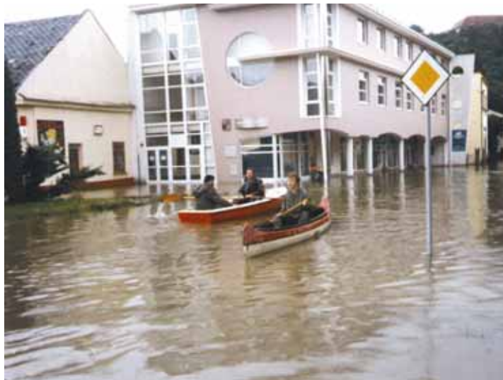
Povodně. Plánovaná opatření mají zabránit vyhlášení řeky Svitavy jako tomu bylo například v roce 1997.

„Naše občany to pochopitelně omezí. Na místo se musí navozit potřebný materiál. Část náměstí bude fungovat jako uzavřené staveniště. Na parkoviště u radnice se bude na-