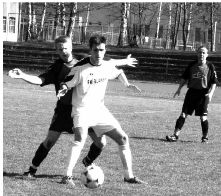
Blansko - Sloup 1:0.