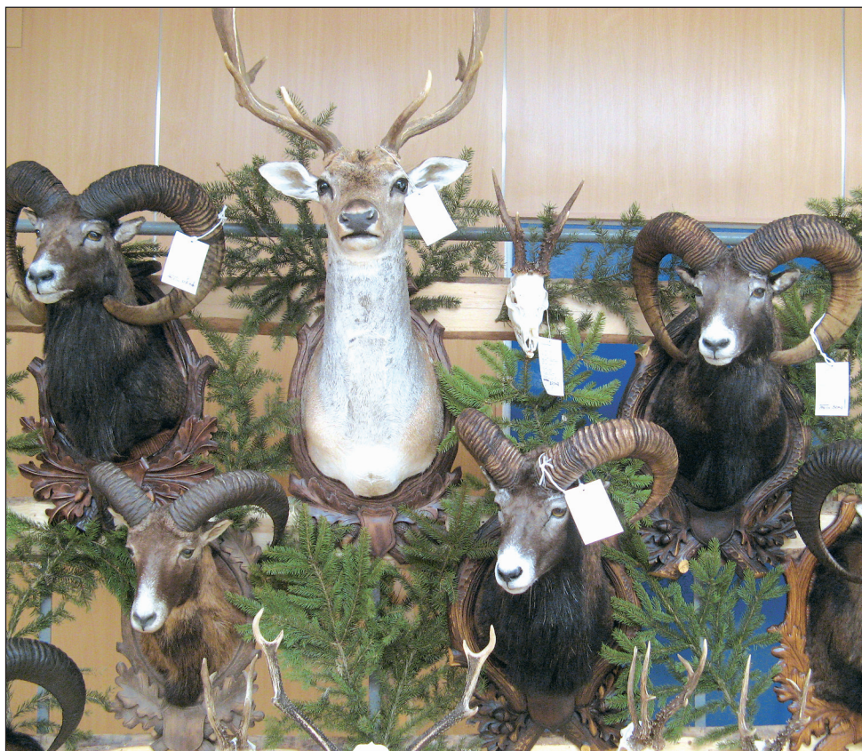
Myslivecká chloubka. Stovky mysliveckých trofejí si prohlédli ti, kteří zavítali v pátek a v sobotu na chovatelskou přehlídku do Černé Hory. Nechyběly trofeje muflonů, srnců, daňků nebo jelenů.