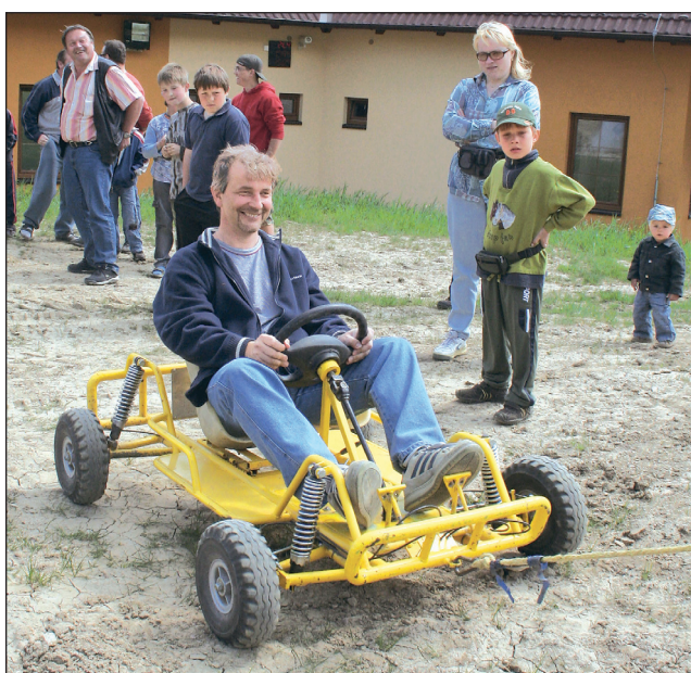
Letní sezóna. Na olešnickém ski-areálu zahájili o víkend letní provoz. K vidění byl paintball, terénní koloběžky nebo paragliding a landkiting.