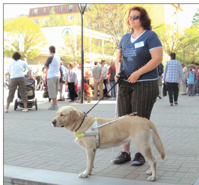
Věrný přítel. Tradiční soutěž vodicích psů pro nevidomé se konala v pátek na Wanklově náměstí v Blansku za velké účasti přihlížejících diváků. Nechyběly mezi nimi děti ze základních škol.