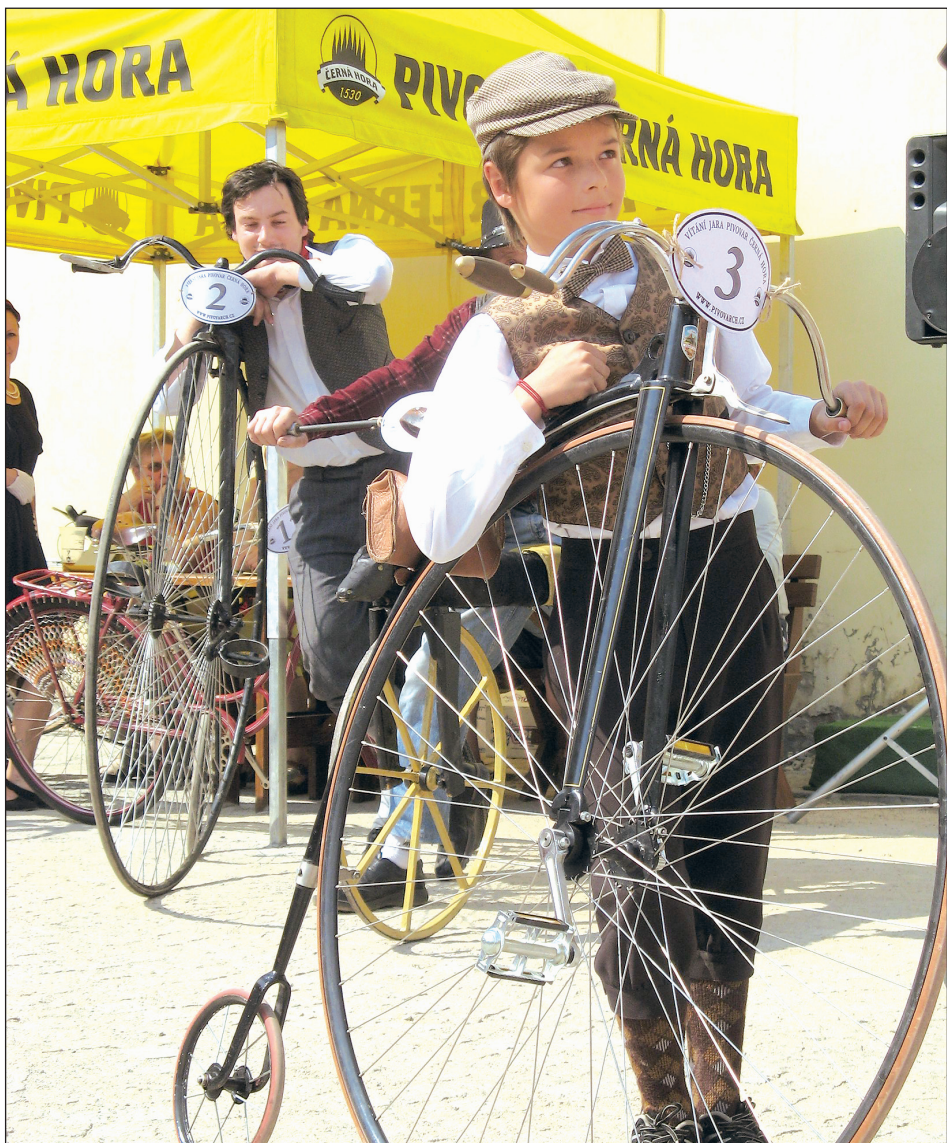
Zábava. Součástí sobotního Vítání jara v Pivovaru Černá Hora byla také jízda elegance historických kol. Návštěvníci se kochali při pohledu na nádherné unikáty, na kterých jezdili už naši dědečkové a babičky.