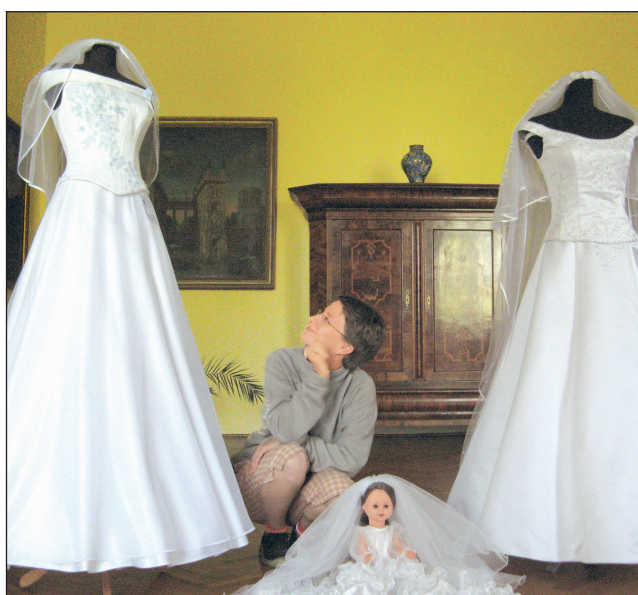
Výstava. V prvním patře rájeckého zámku je v těchto dnech k vidění výstava Květiny a svatební šaty. Návštěvníci mohou obdivovat na třicet kusů svatebních šatů, ale také nejrůznější doplňky a květinová aranžmá.