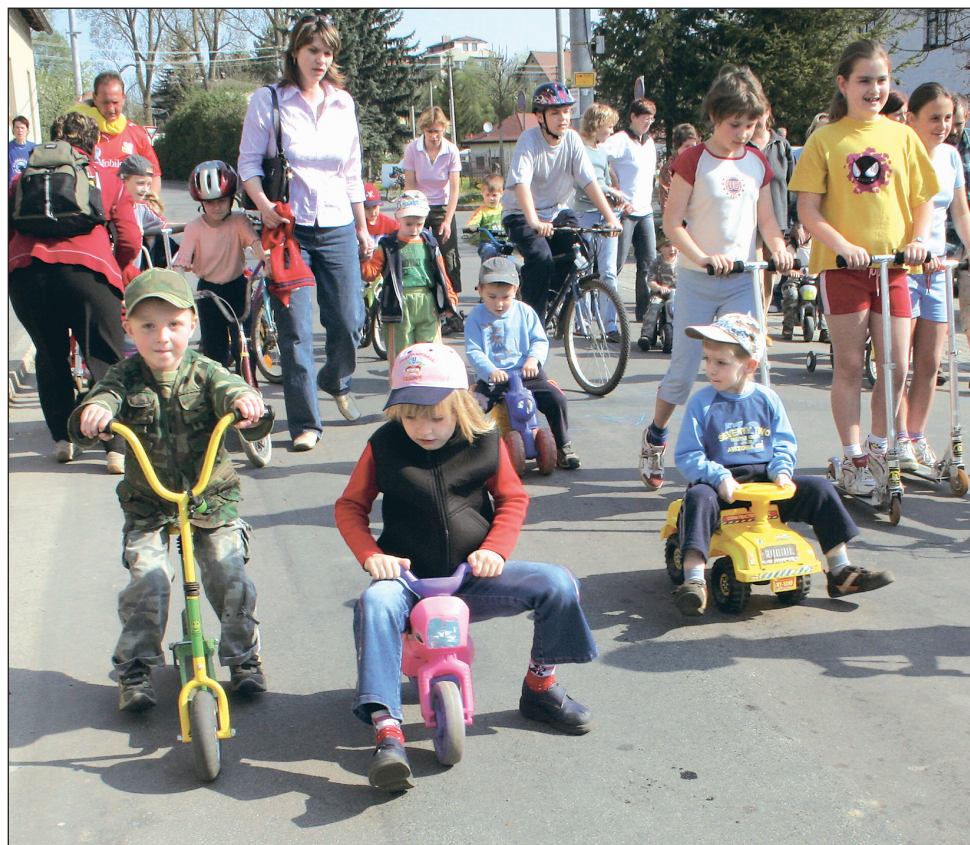
Závod. Děti v Olešnici si v sobotu v rámci Dne bezpečnosti zázavodily na koloběžkách, kolech a odrážedlech.