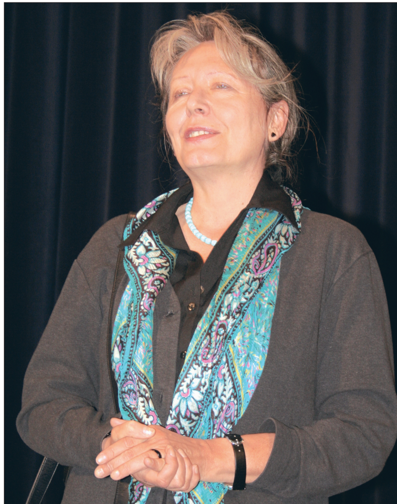
Návštěva. Boskovické kino navštívila minulý týden režisérka Helena Třeštíková. Uvedla tam svůj dokument Marcela.