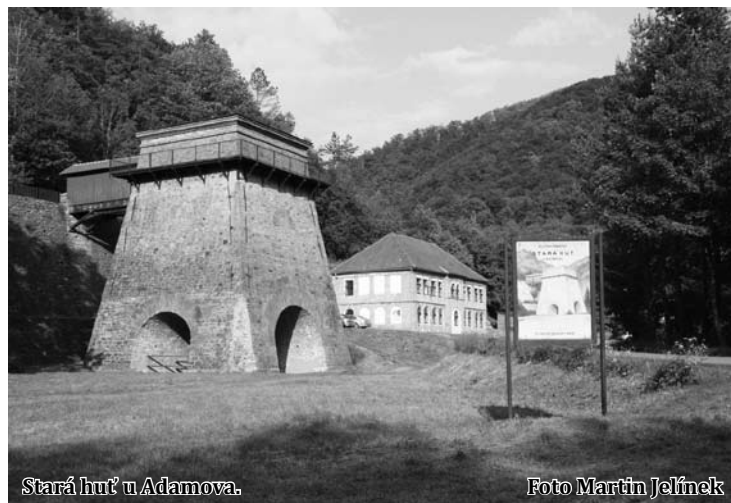
Stará huť u Adamova.

Muzeum připravuje také úpravu samotné expozice v Kameňáku, která se věnuje vývoji výroby železné rudy, jejíž tradice v Moravském krasu sahá až doby Velkomoravské říše. Stálou výstavu navštíví ročně