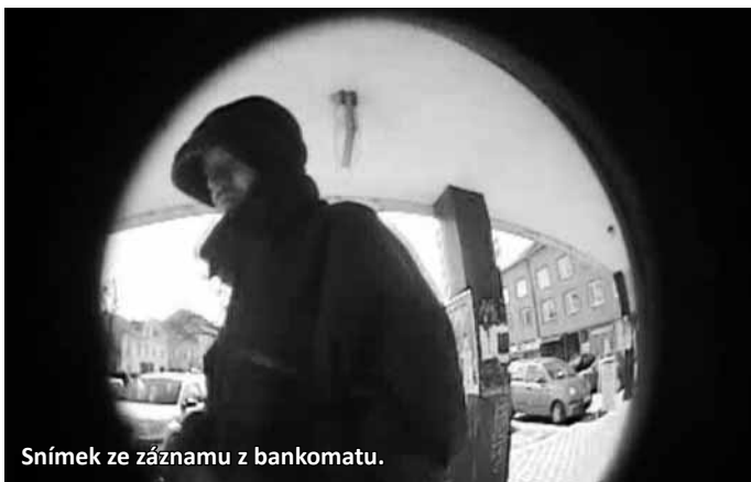
Snímek ze záznamu z bankomatu.