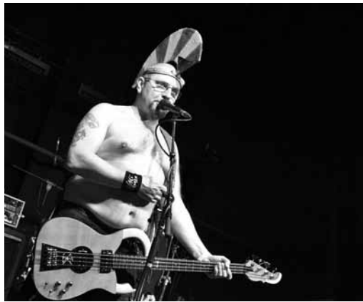
Koncert. Páteční večer patřil v boskovické sokolovně legendě českého punku - skupině Visací zámek.

Úspěšný byl už loňský premiérový ročník úklidu. Do čištění břehů se tehdy zapojilo téměř třináct set dobrovolníků, kteří ve spolupráci se zaměstnanci Povodí posbírali více než čtyřiašedesát tun odpadků a vyčistili břehy řek v celkové délce 211 kilometrů.