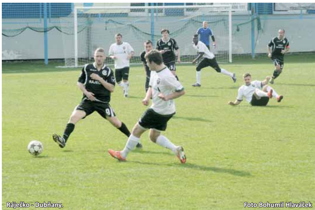
Rájčko - Dubňany.