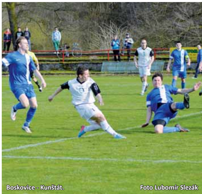
Boskovice - Kunštát.