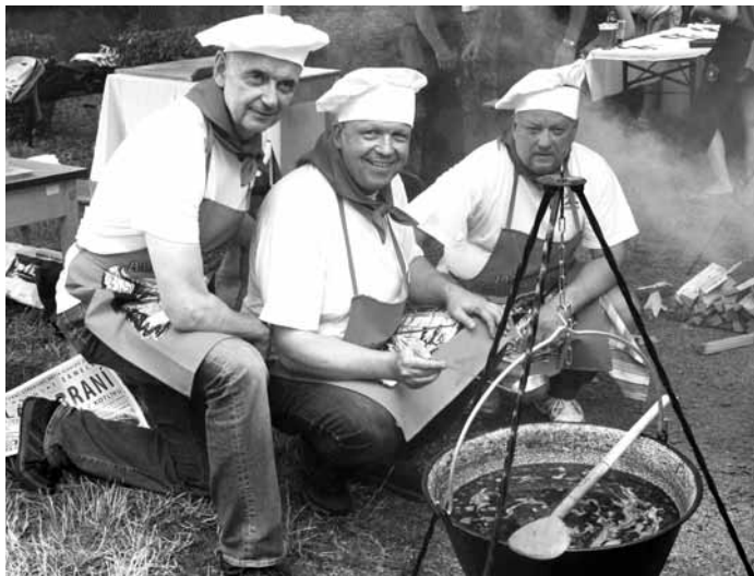
Soutěž. Blanenský zámecký park patřil milovníkům guláše. Uspěly tam soutěž ve vaření kotlíkového guláše. Chuť pokrmů i ustrojení týmů hodnotila odborná porota.

Radnice si už nechala vypracovat Studii aktualizace energetické koncepce, která je k dispozici na městských webových stránkách. Z ní mimo jiné vyplývá, že město by se nemělo dogmaticky držet systému CZT v současné podobě. Provozovatel by se pak měl zaměřit také na budování lokálních a alternativních zdrojů tepla. (moj)