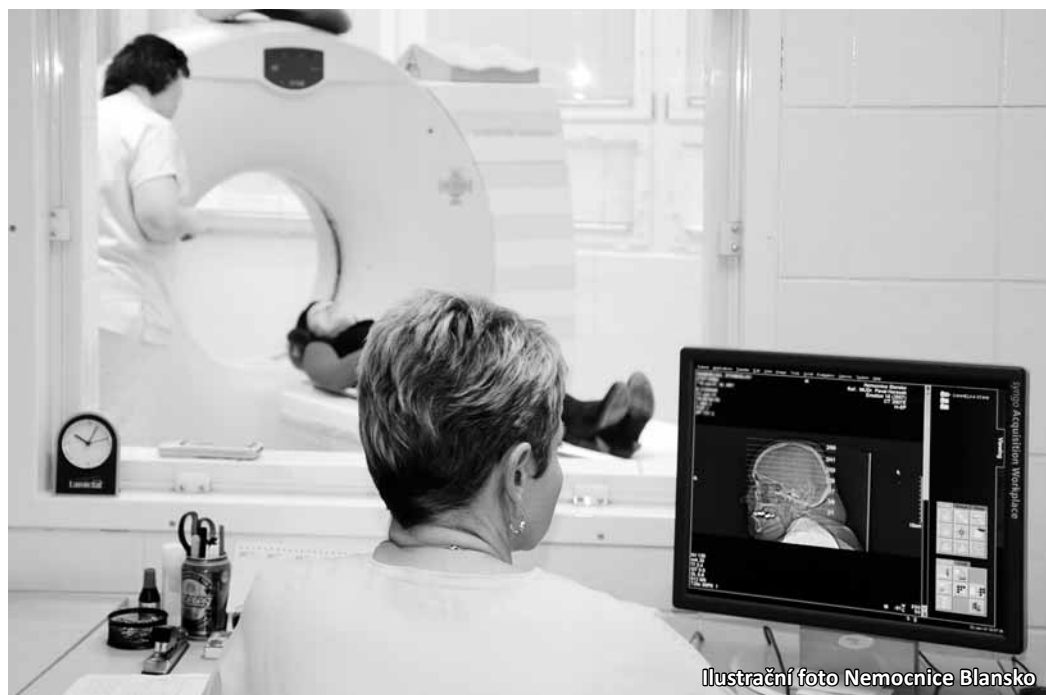
Ilustrační foto Nemocnice Blansko

Lékař se u klienta zaměří na záchyt nejčastějších typů nádorových onemocnění, což jsou karcinomy prsu, kolorektální karcinom, karcinom kůže a další. Pacient podstoupí celou řadu vyšetření včetně laboratorních rozborů krve, moči, stolice nebo ultrazvuku. Lékař následně na základě vyšetření, rizikových faktorů spojených se životním stylem klienta a rodinné anamnézy vyhodnotí, zda je pacient v ohrožení nějakým typem nádorového onemocnění, a podle toho zvolí další postup.