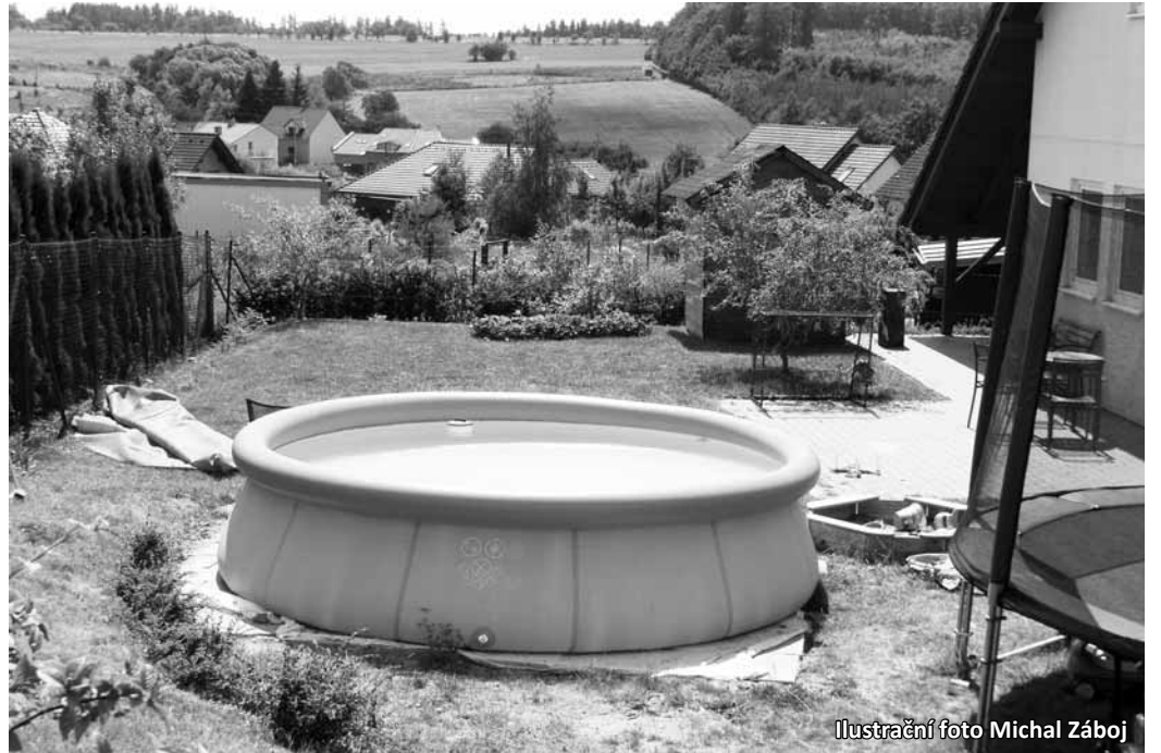
Ilustrační foto Michal Zábaj

Výpadek obyvatel letos už jednou zažili. Obecní vodojemy