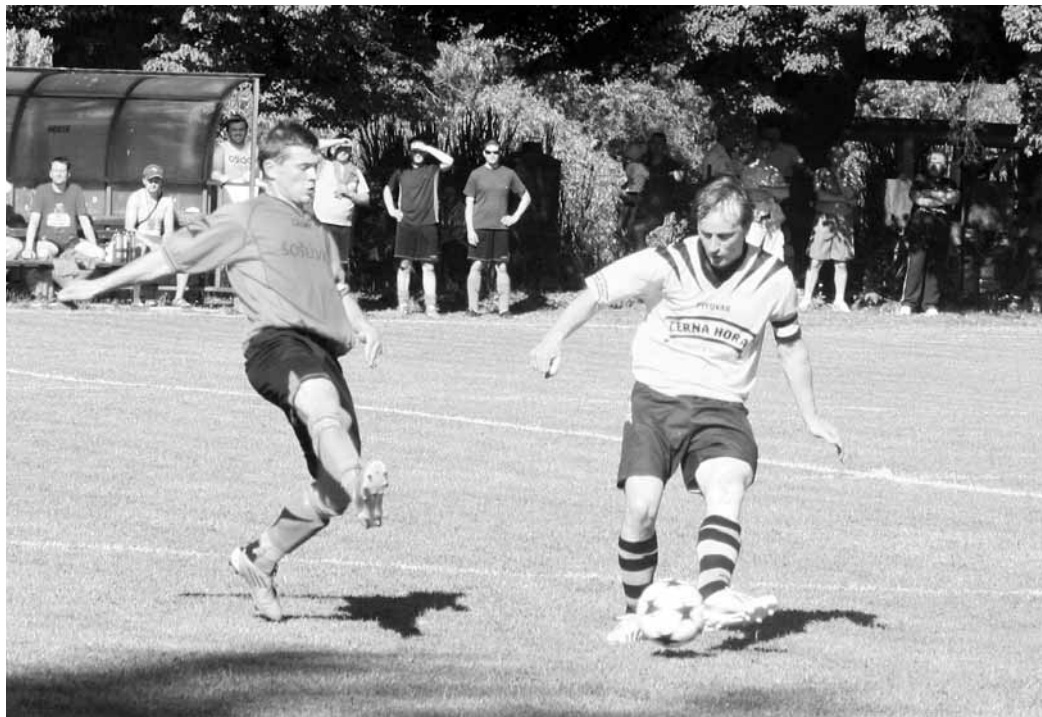
Rozhodující utkání. Zápasem roku v okresní přeboru byl přímý souboj o postup mezi mužstvy Černé Hory a Šošůvky, který skončil výhrou domácích.

Bylo příjemným překvapením zejména na jaře pro všechny, kdo se pohybují v krajském fotbale. Prokazovalo velmi dobrou výkonnost s týmem z hráčů bez větších zkušeností. K tomu bych rád podotkl, že jsem se zúčastnil finále regionálního poháru, kde se utkal jihomoravský výběr s výběrem