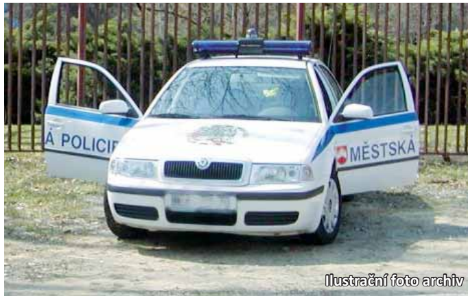
Ilustrační foto archiv

„Navýšení počtu členů Městské policie Letovice je účelové, kvůli návštěvnímu řádu přehrady. Okolní obce Lazinov, Křetín a Vranová nemají k dispozici vlastní strážníky a město se zavázalo, že v rámci mikroregionu Letovicko jim bude vypomáhat s dohledem na dodržování pořádku u Křetínky,“ vysvětlil letovický starosta Vladimír Stejskal (ODS).