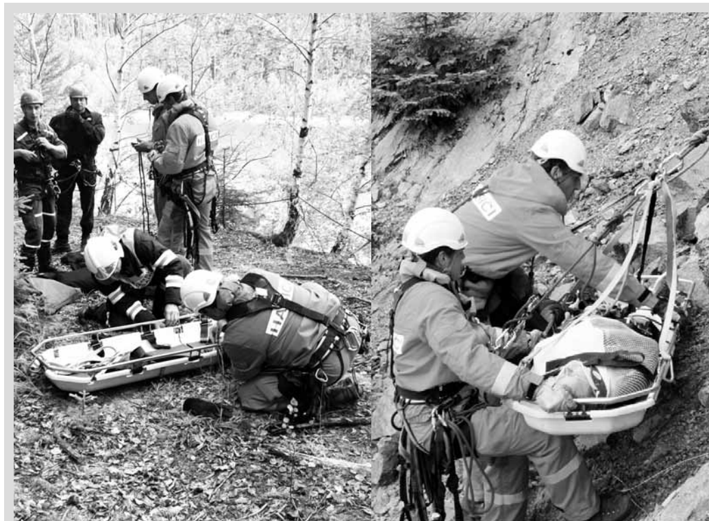
Cvičení. Boskovičtí profesionální hasiči si společně s SDH Vratíkov a boskovičskými strážníky na boskovičské přehradě vyzkoušeli záchranu osob. Námětem byla záchrana osob ze skalního převisu a vodní hladiny.