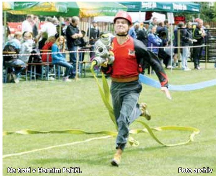
Na trati v Horním Poříčí.

Na mužskou část závodu se počasí ve Žďáře trochu zakaboni-