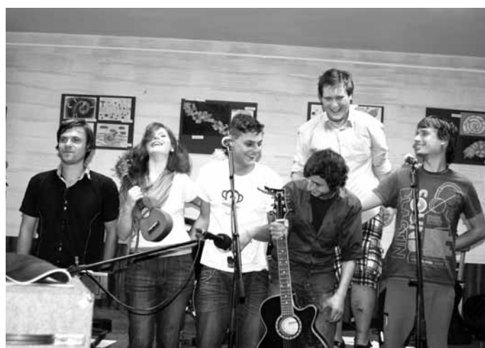
Bujabéza. Šestice mladých muzikantů z Olomouce hrála a zpívala Karolínku s plným nasazením.

Jako první se už koncem června představilo divadlo Krok z Velkých Opatovic, následovalo vystoupení dvojice Klára Šmahelová a Martin Krejčí ve znamení jazzu a latiny. První trojici účinkující završila česká alternativní skupina Jablkoň. Minulou středu se v Ulitě představila olomoucká skupina Bujabéza. Posluchače nadchla zajímavým repertoárem čerpajícím ze sborníku Františka Sušila a připomínajícím staré kramářské