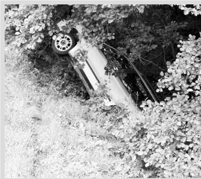
Zásah. K nehodě auta, které skončilo v potoku u silnice, vyjžděli hasiči ve středu 11. července do Chrudichrom. Čtyřicetiletá řidička vozidla Fiat Marea na kluzké vozovce v dešti sjela ze silnice a auto skončilo ve třímetrové hloubce převrácené na pravý bok pod mostkem v potoce. Nehoda se obešla bez zranění, řidička byla při příjezdu hasičů mimo vozidlo.

Podle něj chátrající zbytky Isarna navštívilo před nedávnem vedení města. Všichni se mohli na vlastní oči přesvědčit, že areál je ve velmi špatném stavu. Ze staveb zůstala stát jen hospoda, a jeden výběh. Rozebraná je i dřívější chloubka skanzenu – replika původní brány. Keltský skanzen Isarno fungoval v prostředí bývalého lomu a patřil k turisticky vyhledávaným místům. Obyvatelé osady chtěli vytvořit co možná nejrealističtější podobu keltské vesnice, včetně staveb, řemesel a života z období před dvěma tisíci lety. Jedním z vrcholů programu byla tradiční Galsko-fímská bitva, která lákala stovky diváků.