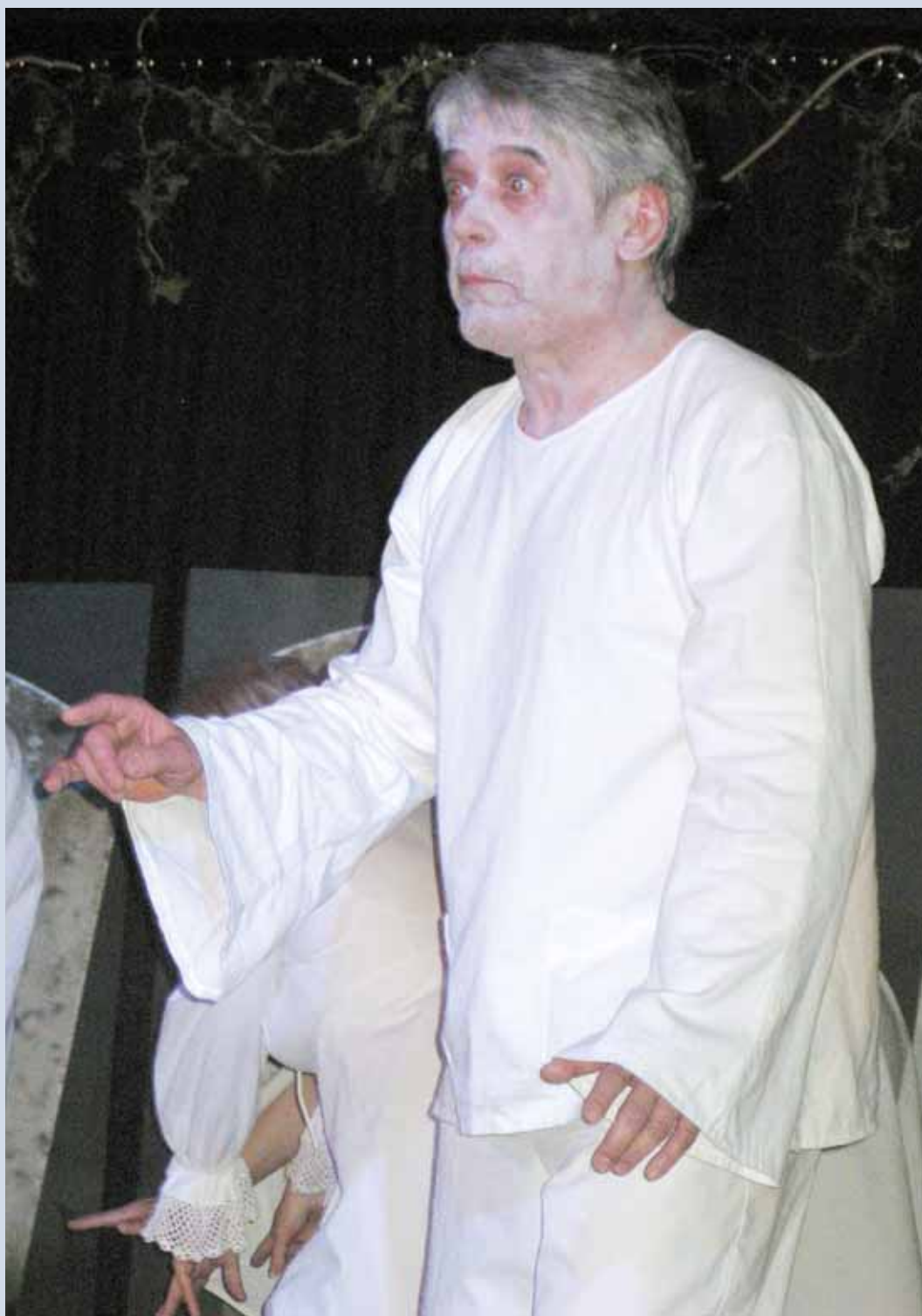
Kultura. Premiéru nového divadelního představení Ducháčkové sehráli o víkendu ráječtí ochotníci. Páteční premiéru i nedělní reprízu sledoval vyprodaný sál kulturního centra K-áčko. Více na str. 2