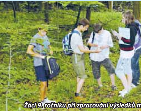
Žáci 9. ročníku při zpracování výsledků měření.

V těchto dnech končí na ZŠ Jedovnice 12 měsíční projekt. ZŠ Jedovnice se stala v loňském roce úspěšným žadatelem a příjemcem finančních dotací z EU. Jedním z nich byl projekt „ Zkvalitnění výuky přírodovědných předmětů v terénu “, který získal finanční podporu z globálních grantů Jihomoravského kraje Operačního programu Vzdělávání pro konkurenceschopnost ve výši 1 320 431,- Kč.