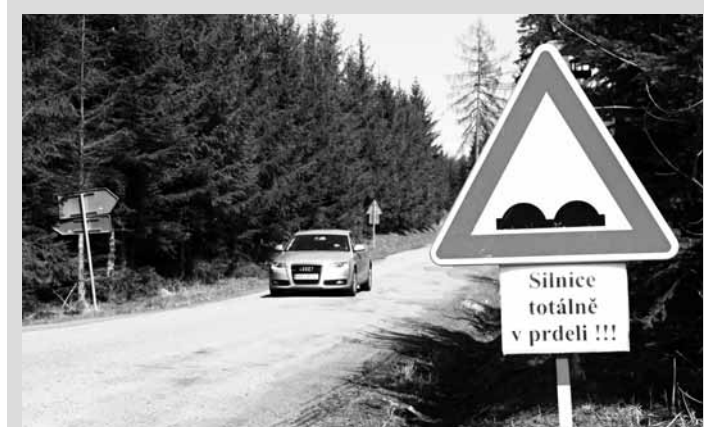
Bez komentáře. Svěrázným způsobem upozornil na špatný stav silnice ze Šebetova do Pohory jeden z tamních obyvatel. K doplnění značky, kterou po zimmě vidáme poměrně často, vytvořil vlastní dodatkovou tabulku.

Finance z dotace krajského úřadu byly použity kromě základního vybavení také na zakoupení vizuálního označení Family pointu, které je ve dvou podobách. První ve formě samolepky, která se nachází na vstupních dveřích do budovy, druhou je označen vlastní koutek. Ve stojanu jsou zařazeny letáky, nabídky a propagační materiály související s rodinou a dětmi. Pro malé děti je tam na zabavení několik stolních her, dětských knih včetně leporela, malé houpadlo a dětský stoleček se židličkami, na podlaze je položen barevný kobereček. (bh)