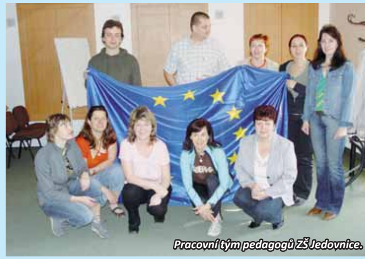
Pracovní tým pedagogů ZŠ Jedovnice.