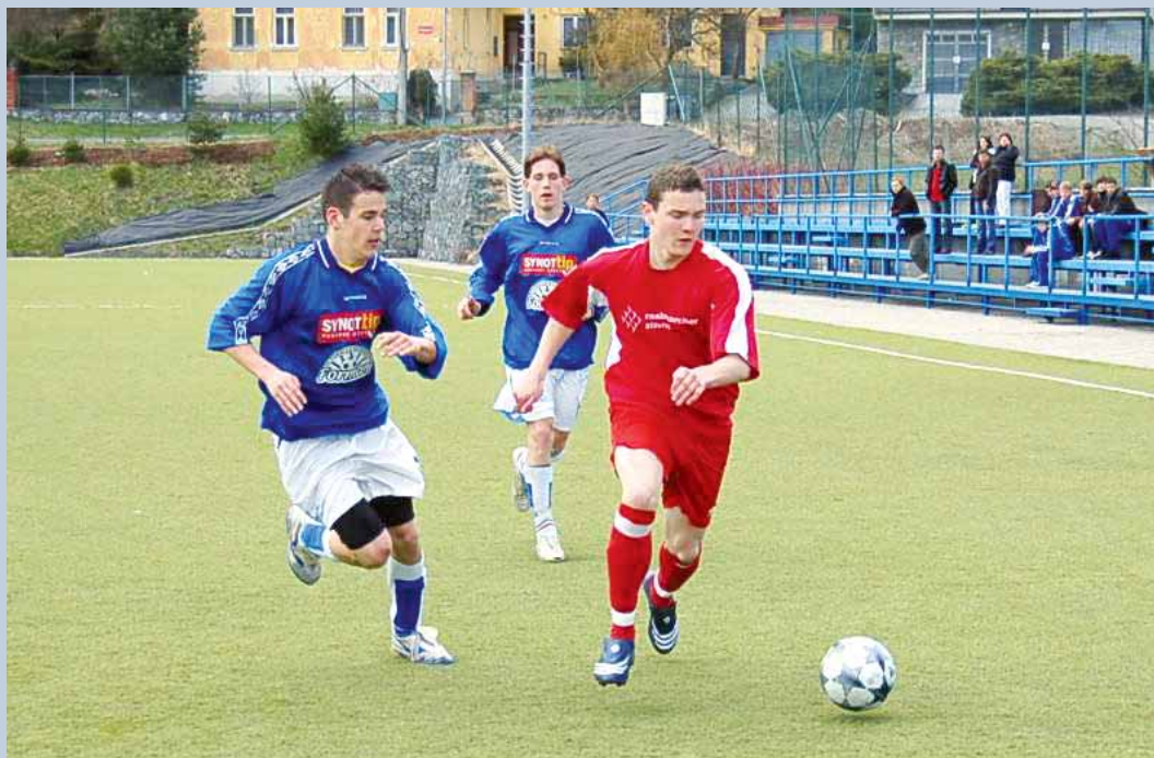
Derby. Týden poté, co se v Červené zahradě utkaly mužské divizní celky Boskovic a Blanska, odehrály svoje vzájemné zápasy týmy dorostenců obou klubů v krajském přeboru. V duelu starších byli úspěšnější Boskovičtí v poměru 2:1. U mladších zvítězili hosté 2:7.