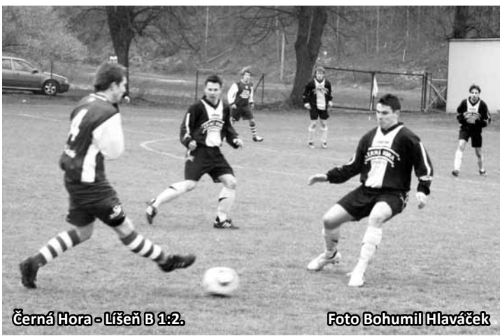
Černá Hora - Líšeň B 1:2.