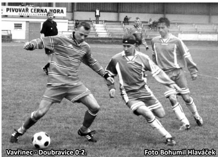
Vavřinec - Doubravice 0:2.

Všichni nominovaní hráči se dostaví k odjezdu autobusu ve čtvrtek 15. dubna na trase Boskovice - 17. listopadu (6.15), Letovice - u hřiště (6.30), Blansko - zastávka u hotelu Dukla (7.00). Předpokládané ukončení turnaje je v 15 hod. (sy)