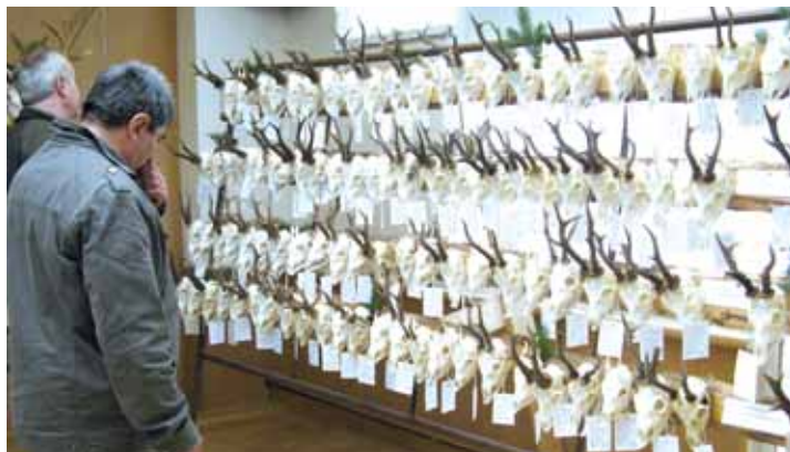
Výstava. Myslivecké trofeje si přišlo prohlédnout několik stovek návštěvníků.

K vidění bylo celkem 723 trofejí smíčí zvěře, 34 trofejí dančí zvěře, devět trofejí jelení zvěře a 26 trofejí mufloní zvěře. Pokračování na str. 4