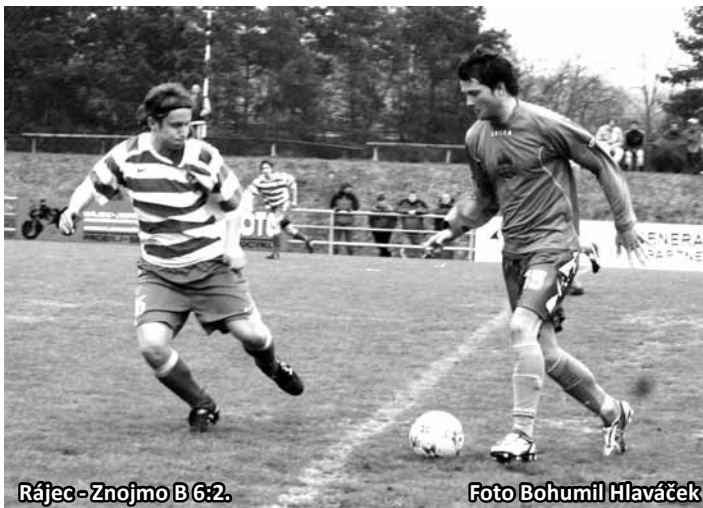
Rájec - Znojmo B 6:2.

Ve druhé půli se Znojmo pustilo s vervou do hry ve snaze něco s utkááním proti oslabeným domácím udě-