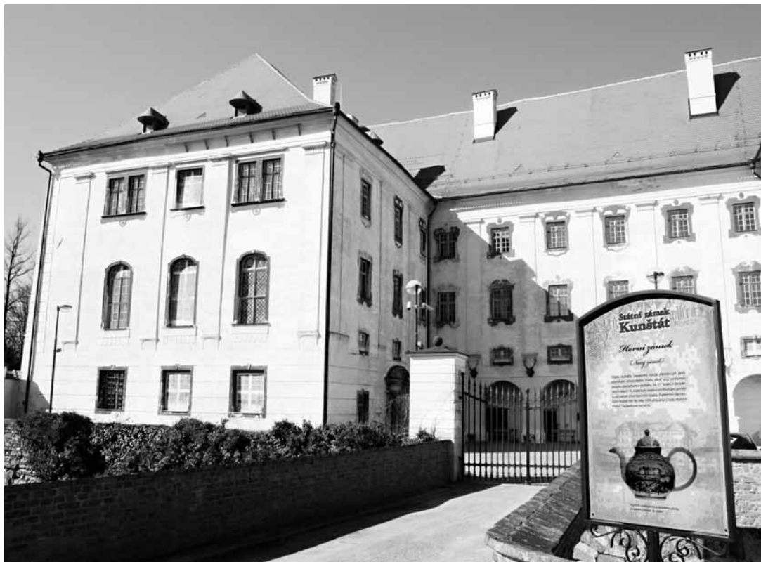
Zámek. Hlavní turistická sezona začne v Kunštátě prvního května.