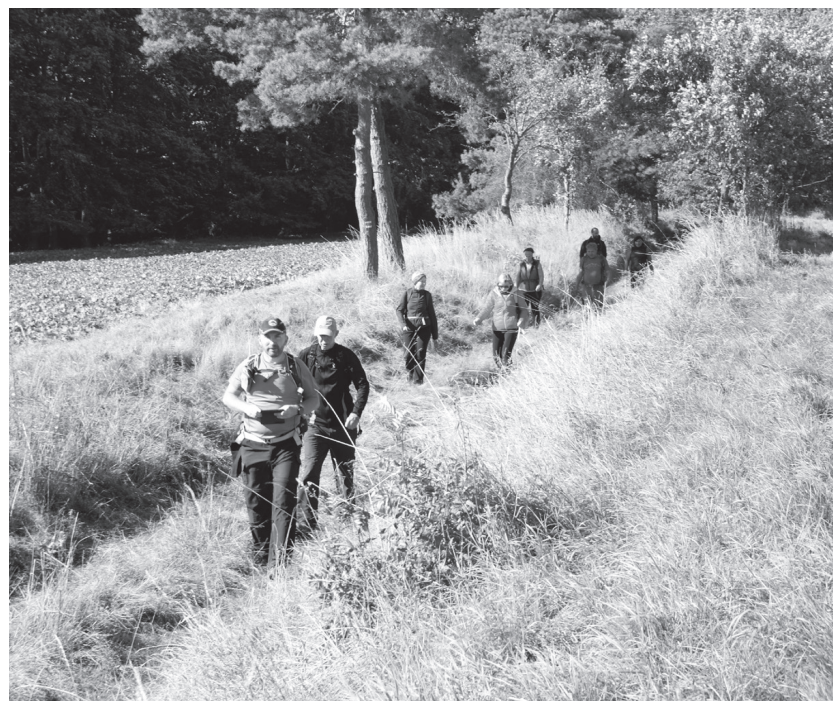
Aktivní minerváčtí turisté z Boskovic v sobotu využili krásného počasí a prošli pěknou krajinou Zábřežské vrchoviny.