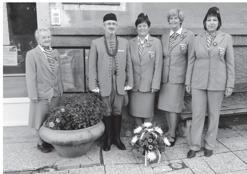
V podvečer v pátek 8. října 2021 ozdobilo hladinu jedovnického rybníka Olšovice asi 30 lodiček se svíčkami. Jedovničtí sokolové se tak připojili k celorepublikové akci Večer sokolských světel konané k Památnému dni sokolstva. Setkání u rybníka předcházelo pietnímu aktu před budovou úřadu měststse, kde zástupci Sokola položili kytici k pamětní desce obětem druhé světové války.