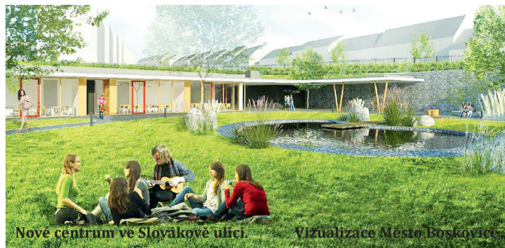
Nové centrum ve Slovákově ulici

„Předpokládáme, že letos v létě bude vyhlášena výzva na budování podobných center. Potom teprve necháme studii rozpracovat do podoby projektu,“ podotkla starostka. (moj)