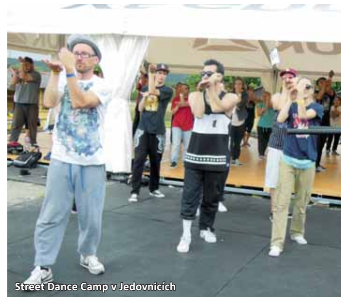
Street Dance Camp v Jedovnicích