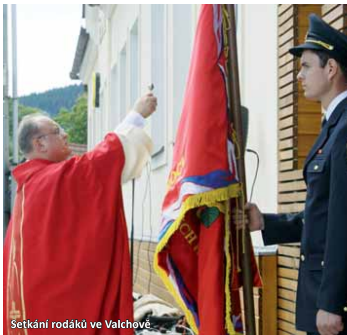
Setkání rodáků ve Valchově