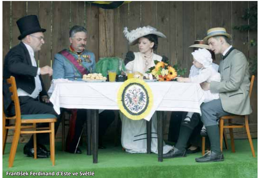
František Ferdinand d'Este ve Světlé