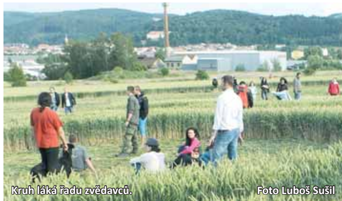
Kruh láká řadu zvědavců.

Jak si tedy vznik obrazce vysvětlujete? Či je to dílo?