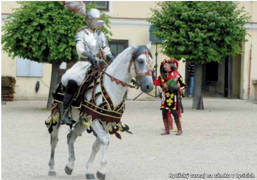
Rytířský turnaj na zámku v Lysicích