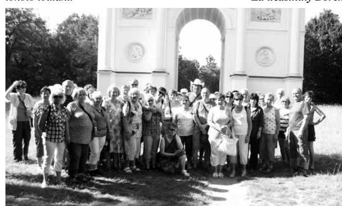
Za účastníky Borek

A to byla tečka za naším putováním Pálavou, jehož cílem bylo především poznání zajímavých míst, ale také duševní a psychická pohoda účastníků tohoto toulání.