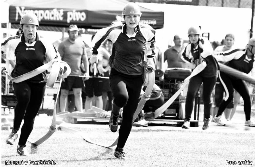
Na trati v Paměťicích.

Třetí místo a tedy bronzové medaile si za čistě provedený požární útok v čase 17,62 s odvezli hasiči z Plumlova z okresu Prostějov, stříbro zůstalo „doma“, konkrétně jej vybojovali a potřebné body do tabulky si připsali muži z Černovic (čas 17,57 s). Za