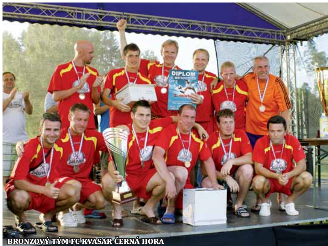
BRONZOVÝ TÝM FC KVASAR ČERNÁ HORA