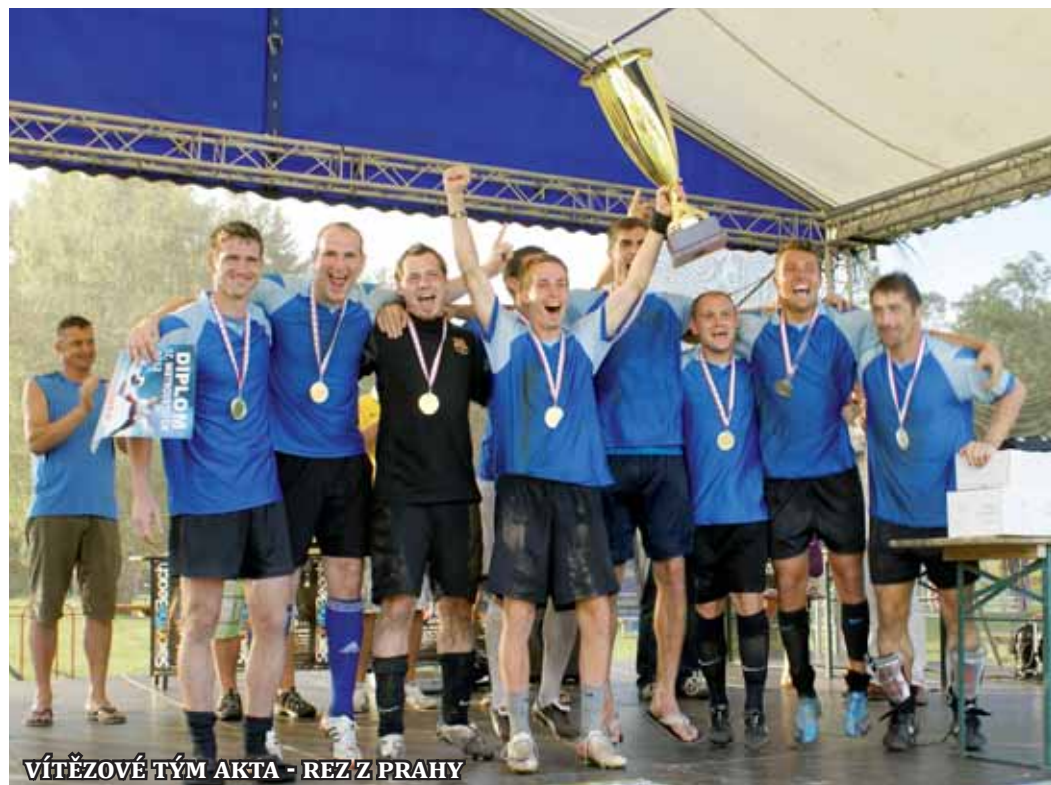
VÍTĚZOVÉ TÝM AKTA - REZ Z PRAHY