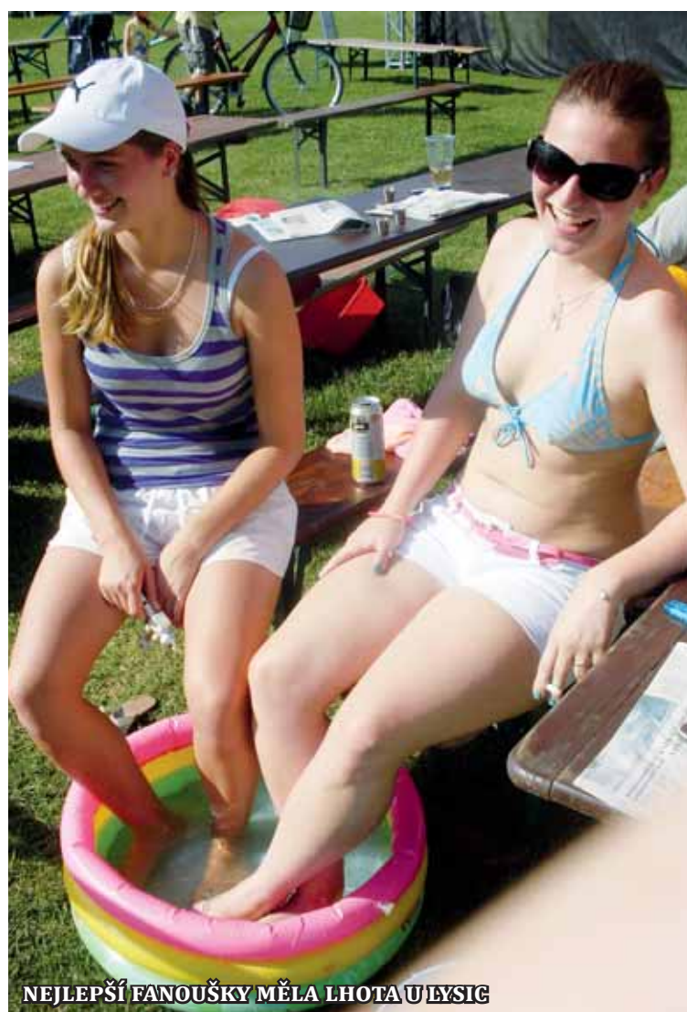
NEJLEPŠÍ FANOUŠKY MĚLA LHOTA U LYSIC

V pátek 5. a v sobotu 6. července se v krásném sportovním areálu v Černé Hoře uskutečnilo 17. Mistrovství České republiky v malé kopané.