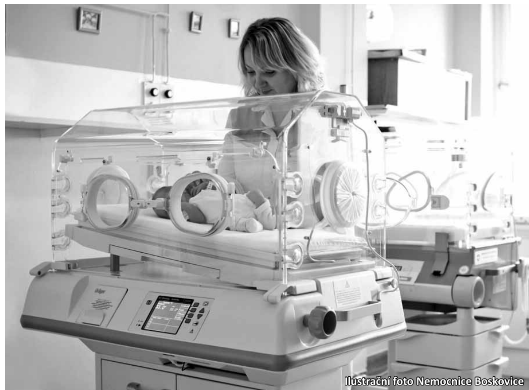
Ilustrace foto Nemocnice Boskovice

U domácích porodů je těžko odhadnutelné, jak se bude vyvíjet. V porodnici projde matka kompletním vyšetřením a lze okamžitě reagovat na průběh, což není v domácích podmínkách možné. Z průzkumů vyplývá, že o této alternativě uvažuje jedno procento matek. „Téma domácích porodů je mediálně zbytečně nafouknuté. Naše nemocnice poskytuje rodičkám komfort a skvě-