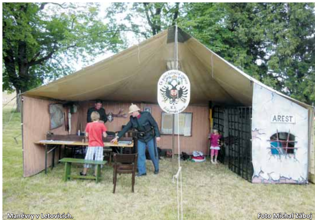
Manévry v Letovicích.