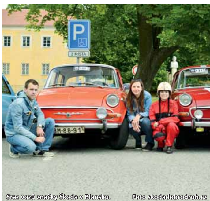
Sraz vozů značky Škoda v Blansku.