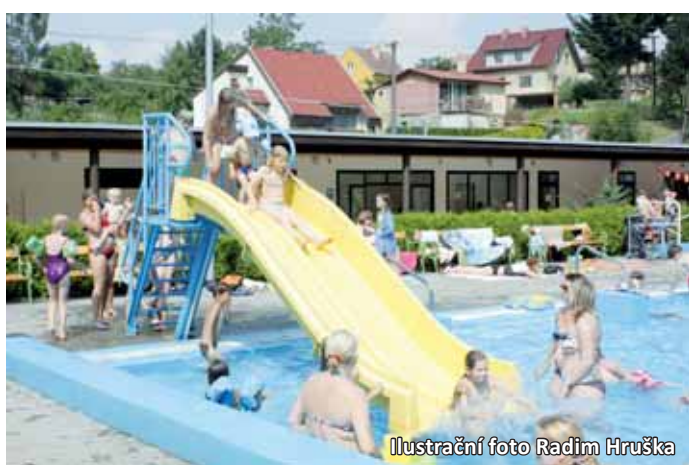
Ilustrační foto Radim Hruška

Letovické koupaliště své brány otevře od začátku prázdnin. Letovičtí před zahájením sezóny provedli několik vylepšení. „Návštěvníci budou mít k dispozici nové sprchy nebo chodník kolem