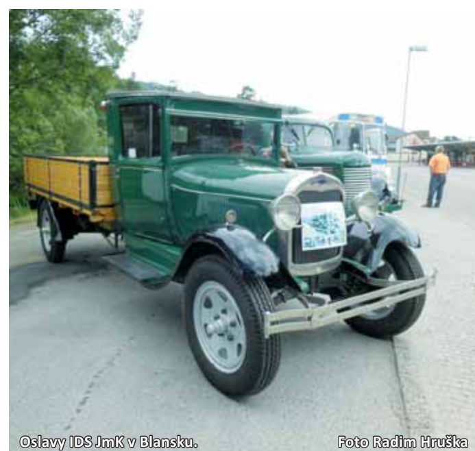
Oslavy IDS JmK v Blansku.