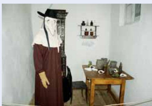
Expozice. Kunštátský zámek otevřel o víkendu novou prohlídkovou trasu. Podrobnosti přinášíme na straně 2.