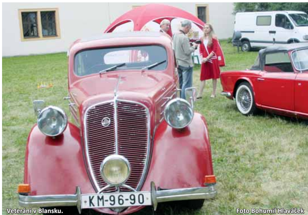
Veteráni v Blansku.