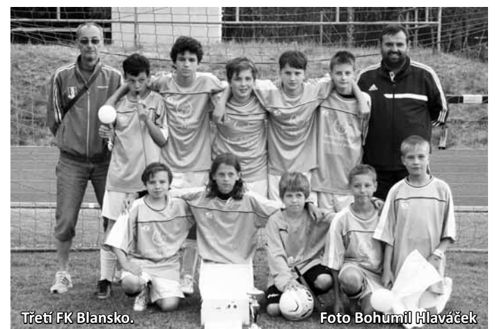
Třetí FK Blansko.

Výběr OFS Blansko 0:2. Pořadí: 1. KFC Komárno, 2. Výběr OFS