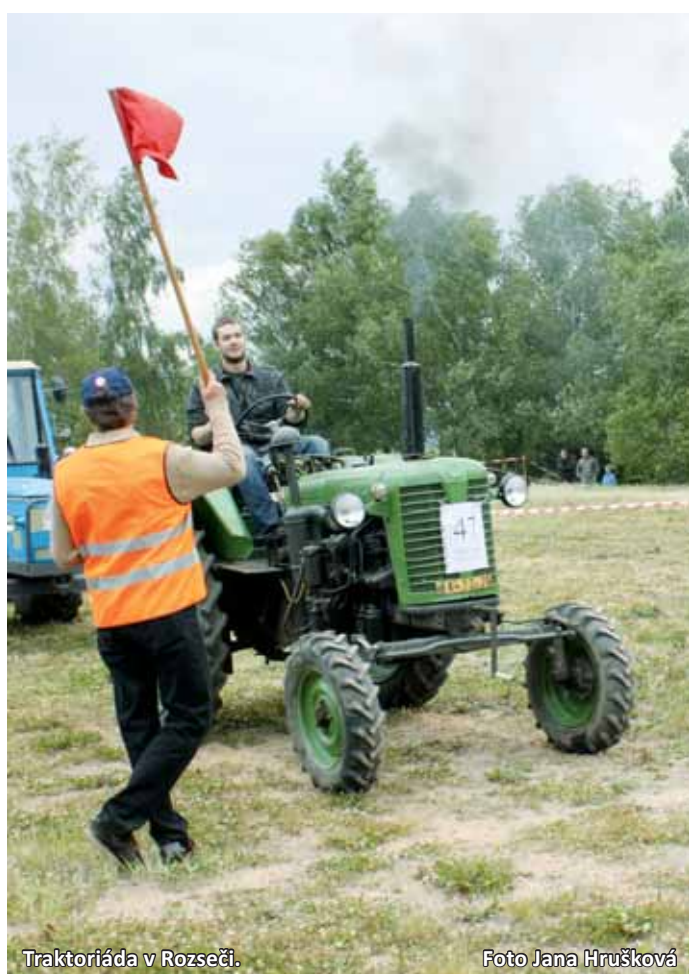
Traktoriáda v Rozseči.