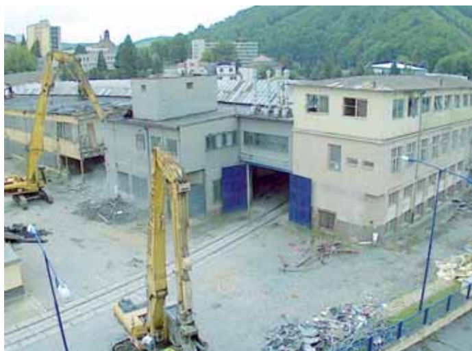
Bourání. Demolice v areálu adamovské firmy Eden musela na čas ustoupit hnízdícím jiříčkám.

Adamov - Překvapení čekalo na pracovníky, kteří provádějí demolici v areálu firmy Eden v Adamově. V jedné z budov určené ke zbourání se totiž zabydlely jiříčky, které tady vychovávají svá mláďata. Vedení firmy Eden se po konzultaci s pracovníky inspekce životního prostředí rozhodlo práce pozastavit a počkat až mláďata jiříček vyletí z domovů. Po dokončení demoličních prací se v areálu firmy plánuje výstavba nových výrobních prostor, která tak přispěje k zkrášlení Adamova.