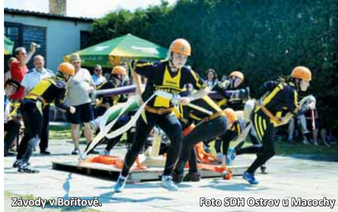
Závody v Bořitově.

V kategorii mužů dokázalo při svém soutěžním pokusu na domácí trati družstvo Žernovníku zastavit časomíru na hodnotě 17.61 s. Tento čas stačil na třetí místo a 20 bodů do celkové tabulky. S časem 17.46 s si se závodní dráhou poradili muži z Krokočína, okres Třebíč a skončili tak na druhém místě. Družstvo mužů z Hlubokého (také okres Třebíč) potvrdilo svoji vzrůstající formu a na této trati dokázalo zvítězit s časem 17.28 s,