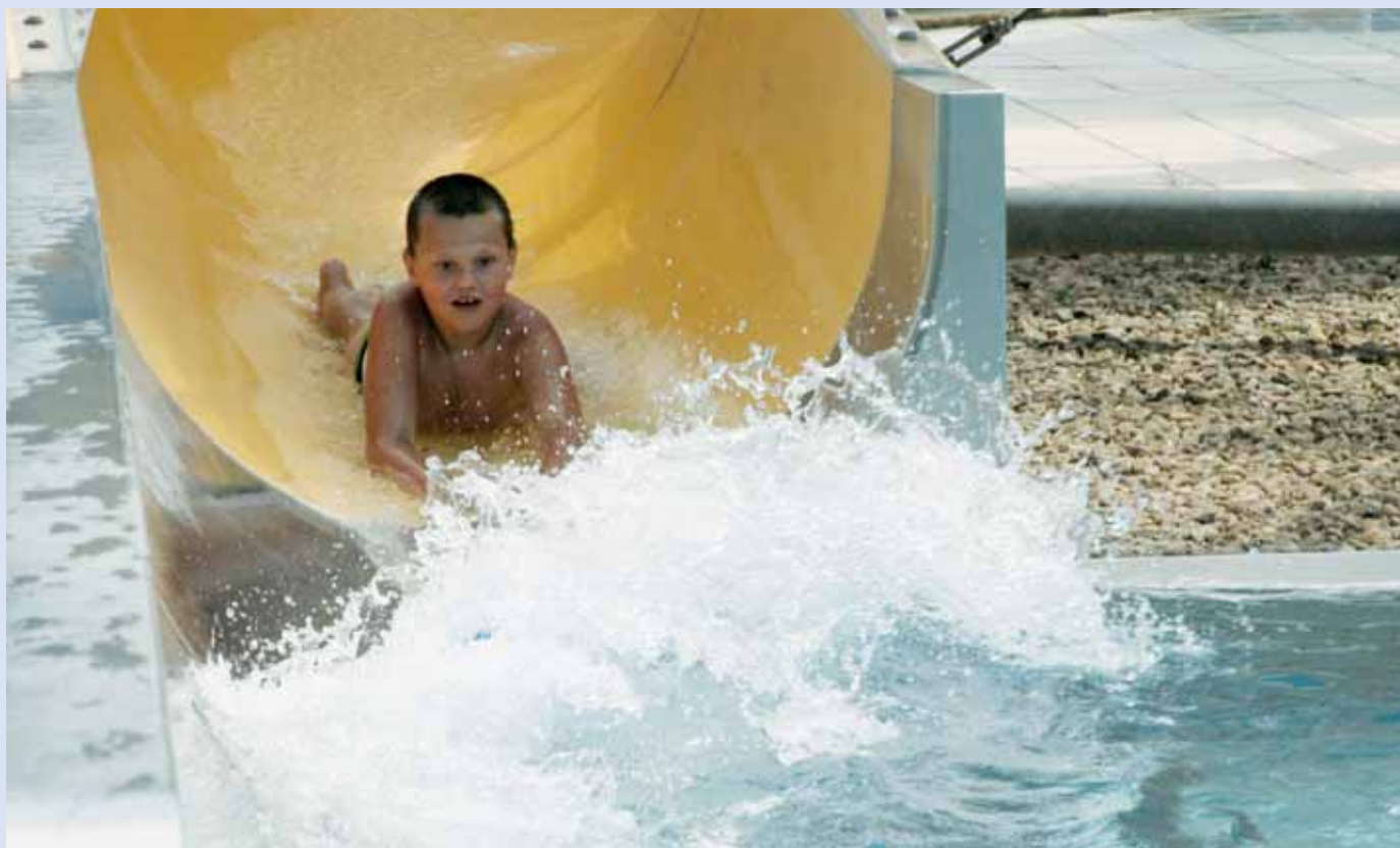
Zábava. Vodní radovánky si lidé užívali například u blanenském akvaparku. Otevřena měla i ostatní koupaliště regionu.