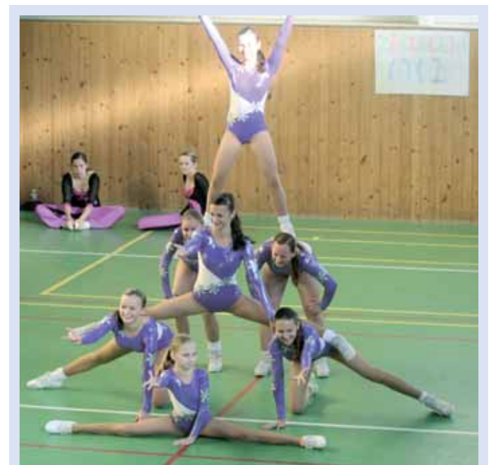
Akademie. Sezónu zakončily cvičenky z blanenské jednoty TJ Orel vystoupeními a soutěží.

Příště: Ohlédnutí za fotbalovou sezónou 2011/12