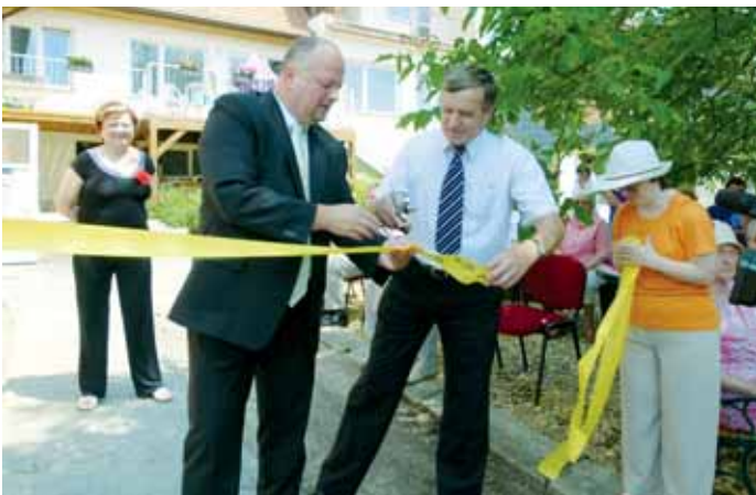
Slavnost. Zahájení provozu se dočkal nově vybudovaný zahradní areál RELAX v centru Velen v Klepačově. Mentálně postižení klienti tak mohou nyní využívat altánek, hřiště na pétanque nebo lavičky u stínů stromů.

Letos poprvé se konala rozsáhlá celosvětová SDK.EUROPE BATTLE TOUR ve Francii, Anglii, Rusku, USA, Česku, Slovensku, Německu, Rusku, Švýcarsku, Ukrajině, Švédsku a Polsku. Vítězné street dance, bboy crew a solo tanečníci jednotlivých stylů se sejdou právě v Jedovnicích. Program vyvrcholí v sobotu 7. července od 14 hodin velkou předhlídkou patnácti národních street dance týmů a soutěžemi všech kategorií. Přijďte se podívat. (ama)