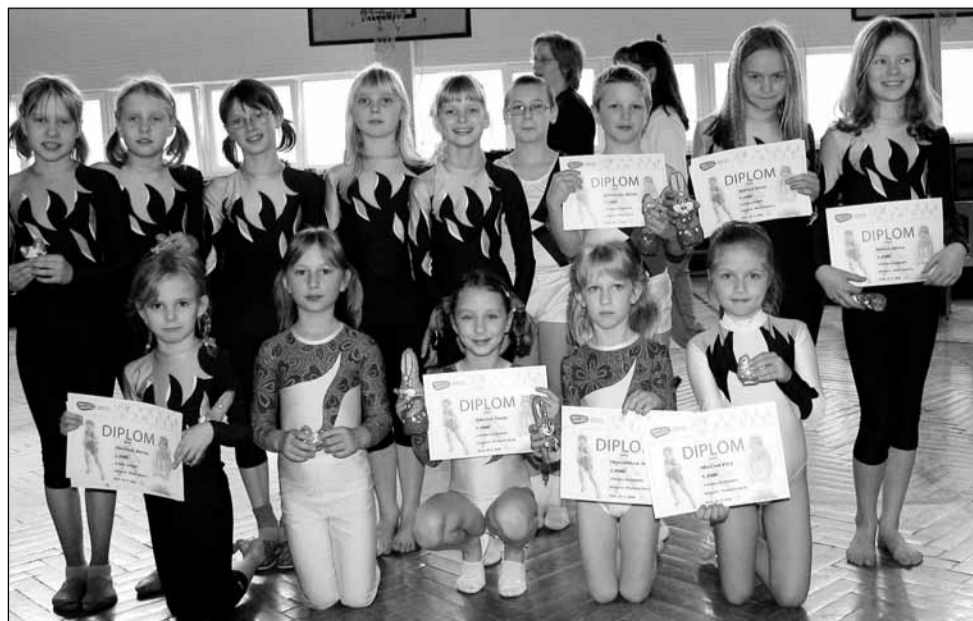
Přeborníci. Blanenská výprava byla na krajských gymnastických přeborech mimořádně úspěšná.