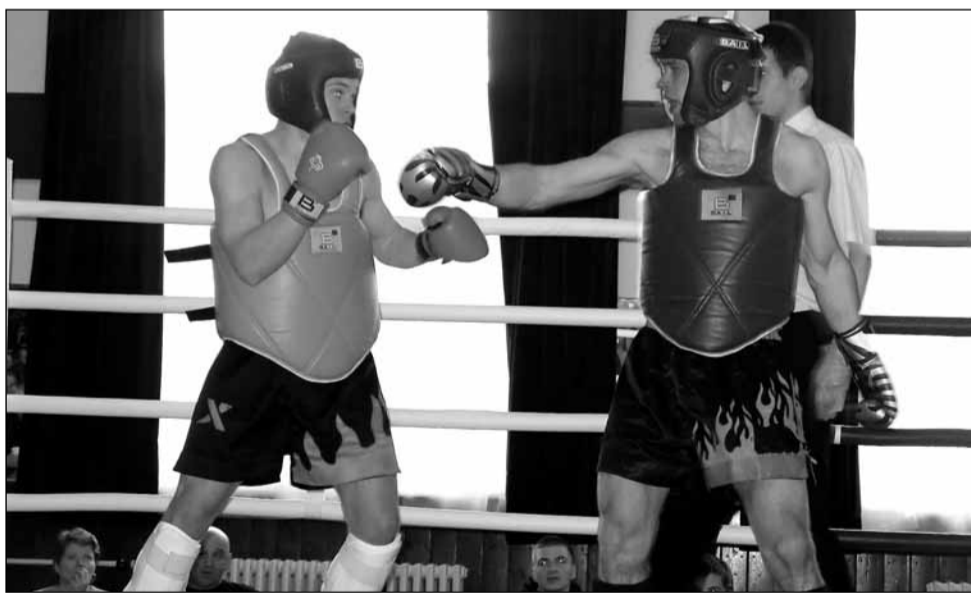
Turnaj. Thajský box se představil poprvé divákům v Boskovicích.