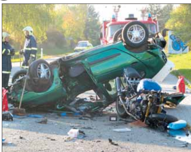
Nehoda. Velmi tragické následky měla v loňském roce nehoda u Svinošic.

Smrt číhala také na takzvaných okreskách, konkrétně u Žernovníku. „Vždy říkám, opraví se silnice, narostou nehody.