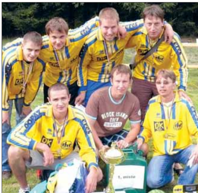
Sehraný tým. Družstvo hasičů z Horního Poříčí tvoří stabilní špičku Velké ceny Blanenska.

„Posledních patnáct let tvoří historii sboru vlastní historie požárního sportu. Zásahy jsou našťastí jen minimální. A tak jsme veškerou snahu upřeli ke sportu. Dobré výsledky děláme proto, že