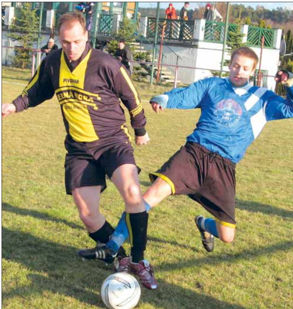
Derby. Kunštát potěšil své příznivce výhrou v derby s Černou Horou.