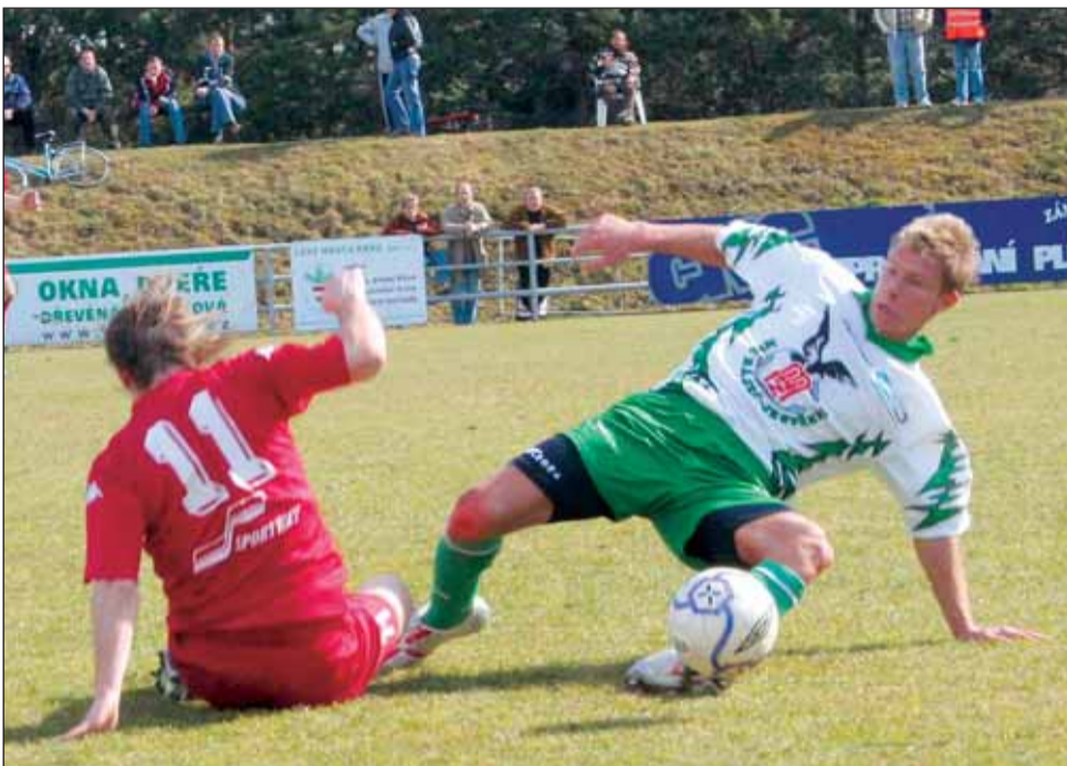
Remíza. Hráči Rájce dokázali vyrovnat stav s Židenicemi na spravedlivou remízu.