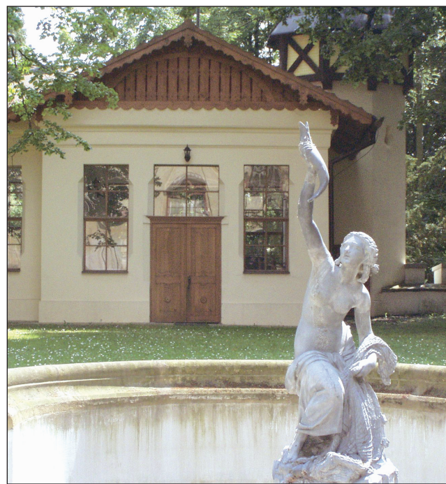
Altánek. Zámecká zahrada se v létě stane místem, kde se budou odehrávat kulturní akce.

řešit drobné stavby. V parku byla poustevna nebo spodní bazén a schody. Musíme doplnit zahradní mobiliář. Do budoucna bychom chtěli dá do pořádku i zámeckou, tak zvanou Květnou zahradu. Máme původní plány, takže víme jak vypadala. Ta se ale dá řešit až po kompletní obnově zámku, ukončené fasádou. V plánu