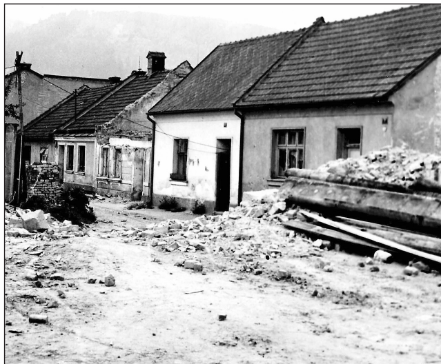
Historie. Poznáváte? Snímek Wanklova náměstí z roku 1962.