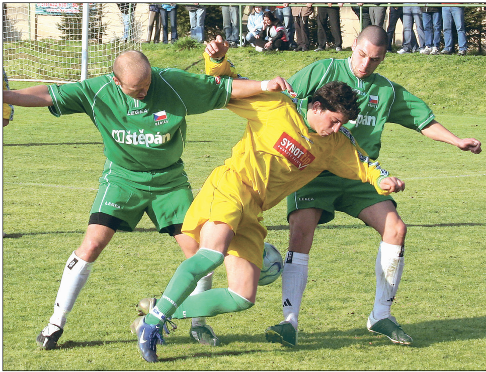
Remíza. Cenný bod proti vedoucímu týmu soutěže si připsali fotbalisté Ráječka.

Po změně stran přidal dalekoslovnou střelou druhou branku ve 47. minutě Němec, aby po třech