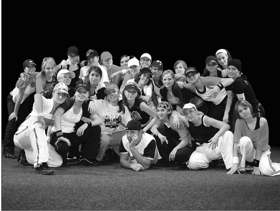
Akce. Členové taneční skupiny AD'S Crew.

A co musí udělat člověk, který má zájem naučit se tančovat hip hop a chtěl by se stát členem taneční skupiny? „Žádné speciální požadavky nemáme. Nejdříve ale potřebuji dotyčného člo-