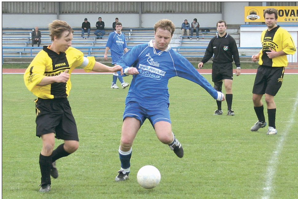
Souboj. V sobotním utkání mezi Blanskem B a Kořencem se diváci branky nedočkali.