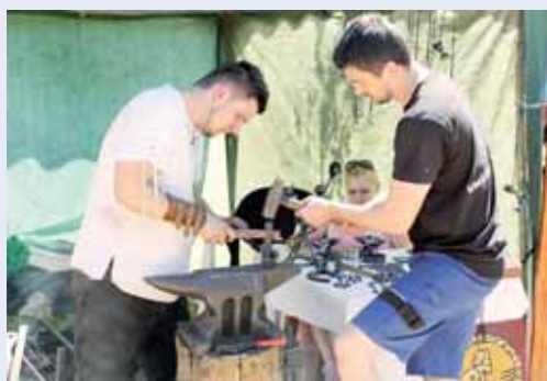
Řemesla. Panská zahrada v Kunštátě ožila Svátky řemesel. Lidé si mohli prohlédnout desítky stánků s výrobky tradičních řemesel. Připraven byl i bohatý doprovodný program. více na izrcadlo.eu