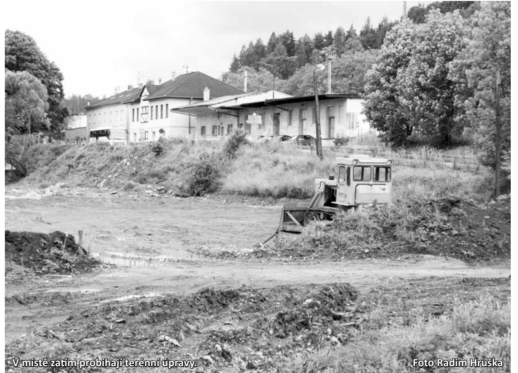
V místě zatím probíhají terénní úpravy.