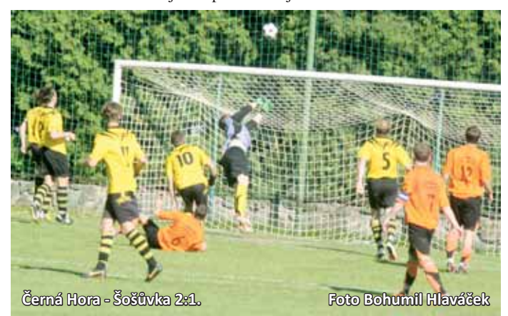
Černá Hora - Šošůvka 2:1.