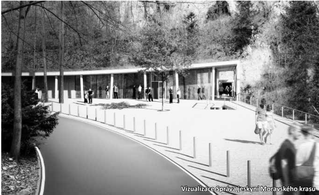
Vizualizace Správa jeskyní Moravského krasu

Samotná stavba nové budovy začne v červnu a potrvá rok. Nový