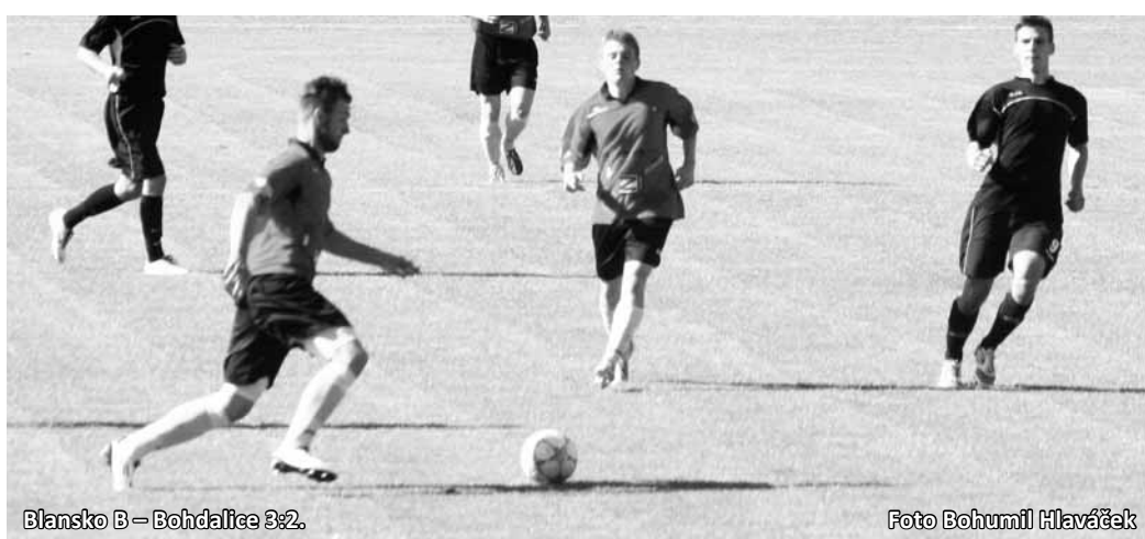
Blansko B – Bohdalice 3:2.

Svatka – Rájec-Jestřebí 2:1 (1:1) , Sedlák. Rájec-Jestřebí: Polák – Žilka, Klimeš, Čepa, Štrof – Palkaninec, Farník, Sedlák,