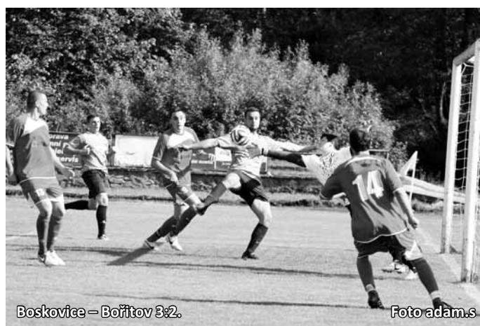
Boskovice – Bořitov 3:2.

Utkání za úmorného vedra skončilo spravedlivou remízou. Hosty poslal do vedení Boček, Soběšičtí