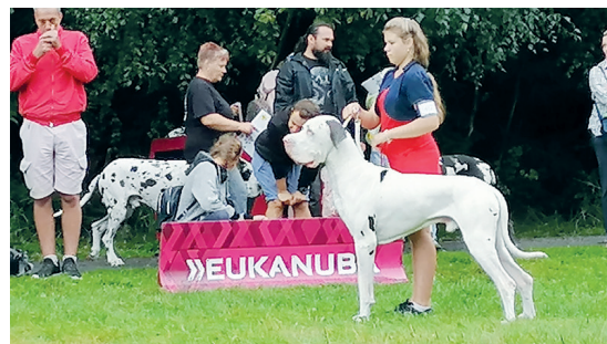
Iva Soldánová uspěla na Klubové výstavě německých dog v Ránsné se psem Lustig Quincy Etc. Je to velký úspěch vzhledem k jeho nestandardnímu zbarvení a velké konkurenci.