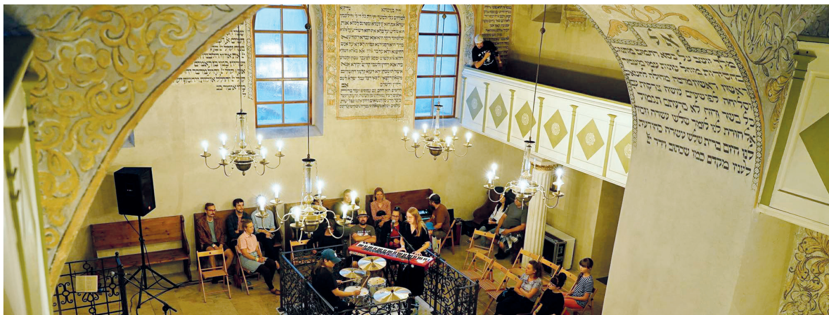
Ani letos nechyběl v Boskovických festival pro židovskou čtvrť. Fotoreportáž z akce naleznete na straně 6.

DOUBRAVICE - V neděli 20. září od 15 hodin odpoledne přijďte do farního areálu v Doubravici nad Svitavou. Na oslavách představíme publikaci vydanou k výročí, pracovníků hospice se můžete zeptat na vše, co vás o hospicové péči zajímá, máme přichystaný program pro děti i dospělé. Čeká vás lukostřelba, děti malování na obličej a další hry. V 16 hodin odpoledne můžete na své blízké zesnulé zavzpomínat při mši svaté pod širým nebem, po celé odpoledne bude pro soukromé chvíle ticha otevřen místní kostel. Akce se koná za každého počasí, máme zajištěnou dešťovou variantu. Vladěna Jarůšková