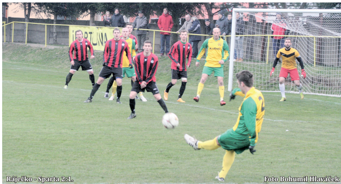
Ráječko - Sparta 2:1.