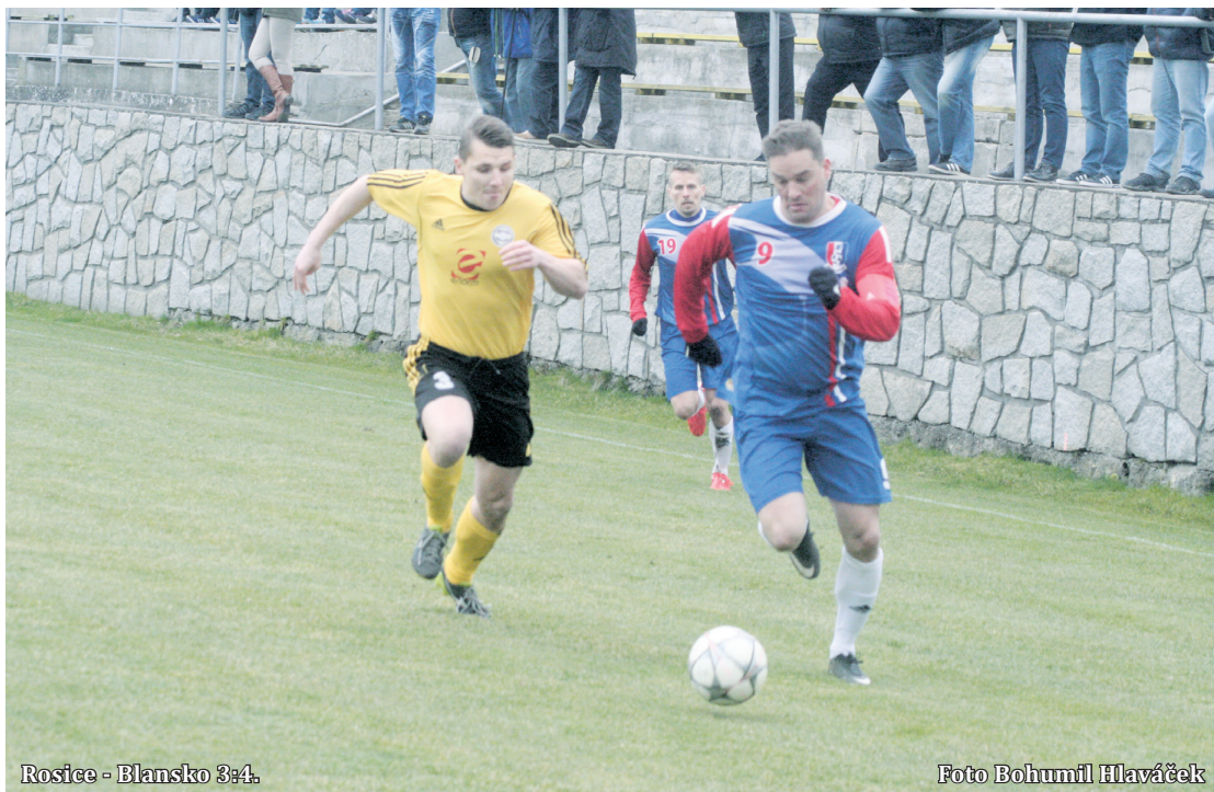
Rosice - Blansko 3:4.