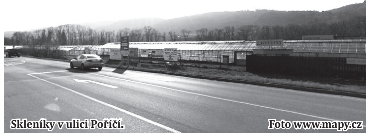
Sklenky v ulici Poříčí.

Investorem obchodní zóny u řeky Svitavy na místě dnešních sklenků je firma M. S. Blanenská. Areál se su-