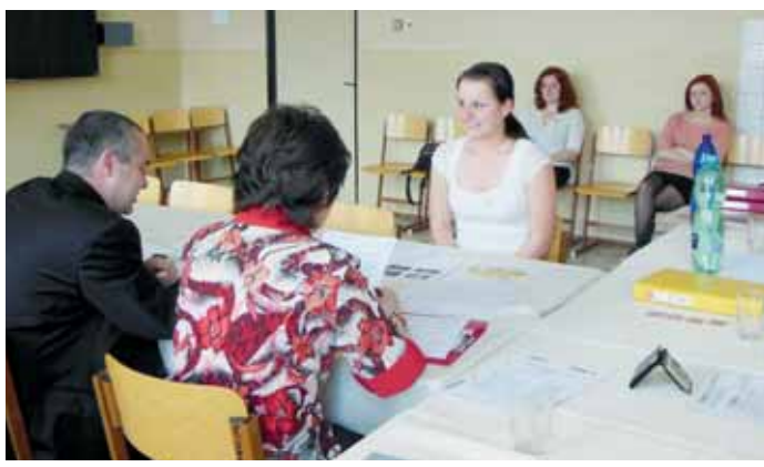
Maturita. Zkoušku dospělosti skládali v uplynulých dnech také studenti boskovického gymnázia.