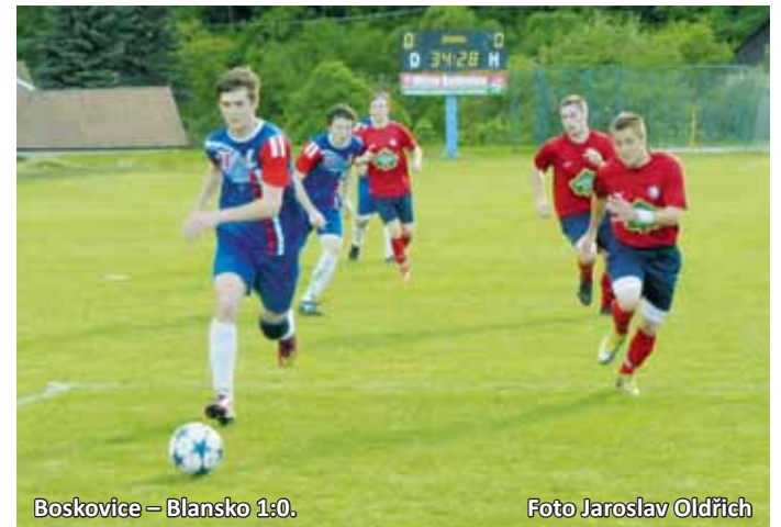
Boskovice – Blansko 1:0.