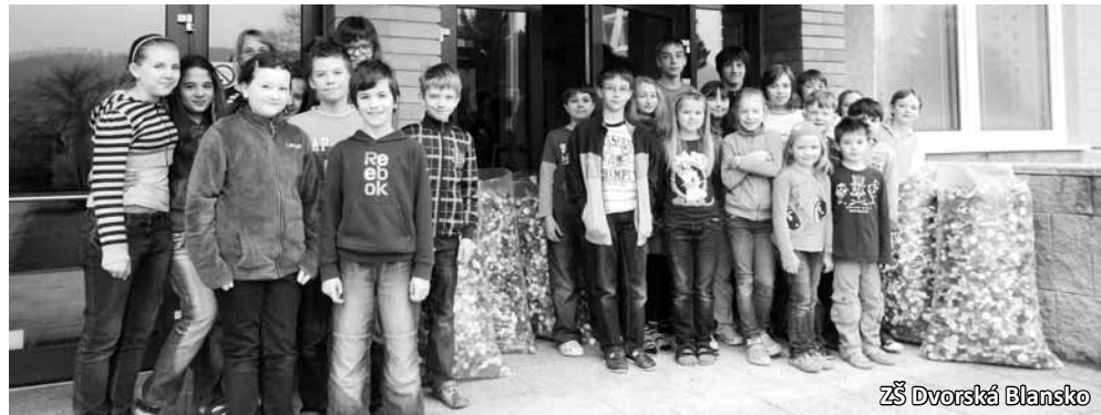
ZŠ Dvorská Blansko