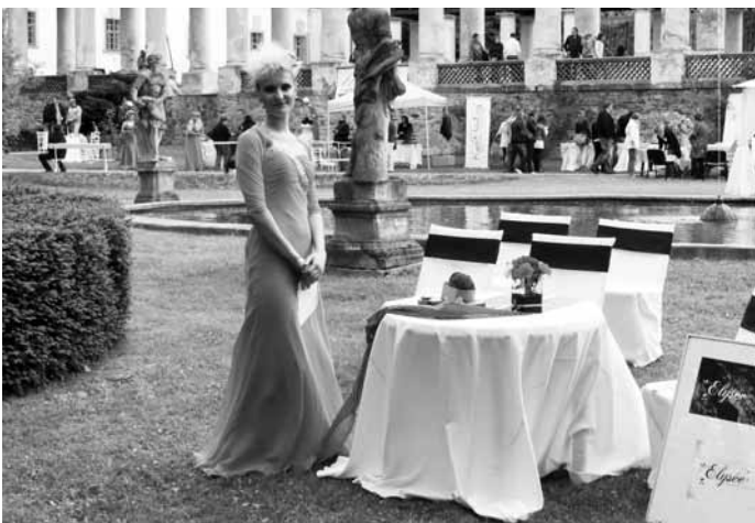
Show. Lysický zámek patřil uplynulou neděli Svatební show. Připraven byl bohatý program včetně přehlídky satebních šatů. Více fotografií na www.zrcadlo.net.