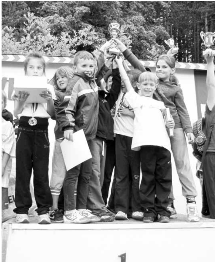
Tradiční akce. Ve Velkých Opatovicích proběhla již patnáctá Olympiáda prvních tříd za účasti 18 škol nejen z našeho okresu, ale i z Protivanova a jedné z Prahy: Celkovým vítězem se stala ZŠ a MŠ Dvorská z Blanska, která s počtem 31 bodů předstihla ZŠ Svitávka (26 b.) Na třetím místě skončila ZŠ Erbenova Blansko se ziskem 24 bodů. Hostem akce byla mistryně světa ve sportovní gymnastice z roku 1979 Věra Černá.