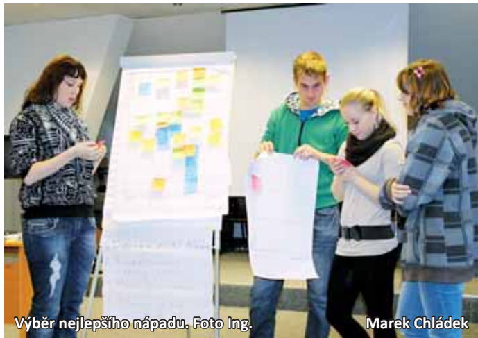
Výběr nejlepšího nápadu.

Konkrétně půjde o vytvoření míst k odpočinku u budovy školy Tyršova 25 a u Domova mládeže, kde je zároveň ordinace lékaře. Vzhledem k tomu, že tato místa nejsou nijak uzavřená, využívala by je široká veřejnost. Pod lípou u Domova mládeže bude umístěna lavička a také informační tabule o městě a o tom, co může nabídnout. Na druhém stanoví-