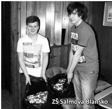
ZŠ Salmova Blansko