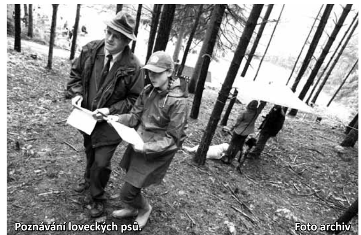
Poznávání loveckých psů.

Soutěž Zlatá srnčí trofej se skládá ze tří postupových kol – místní, okresní a národní. V každém z nich děti absolvují test, který prověří jejich teoretické znalosti a praktickou část. Okresního kola se zúčastnilo 53 dětí ve třech ka-