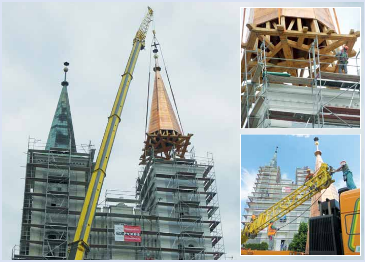
Rekonstrukce. Vanovičtí dokončili rekonstrukci jedné z věží tamního evangelického kostela. Poslední fází bylo usazení nové vrcholové části za pomoci jeřábu. Opravy se ještě letos dočká i druhá věž a fasáda. Fotoreportáž naleznete na www.zrcadlo.net .