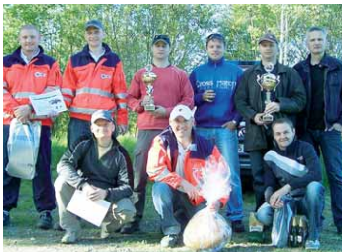
Vítězové. Úspěšný tým boskovických hasičů a zdravotníků z Velkých Opatovic.

„Soutěž, která se konala na Masarykově náměstí v Rokycanech,