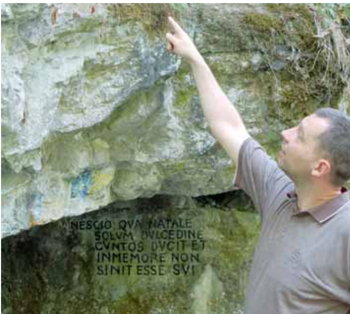
Historický nápis. Skalnímu ostrohu v zátočině cesty mezi Křtinami a Adamovem se říká Salve-Vale.

Dalších pět objektů Lesnického Slavína bude opraveno díky úspěšnému projektu z prostředků programu Rozvoje venkova získané prostřednictvím Místní akční skupiny Moravský kras. Jedná se o památník K. J. Schindlera u stejnojmenné studánky, památníky J. Nimburského a A. Zlatníka. Na opravu letos čeká také studánka Pod Janem a památník Pocta půd.