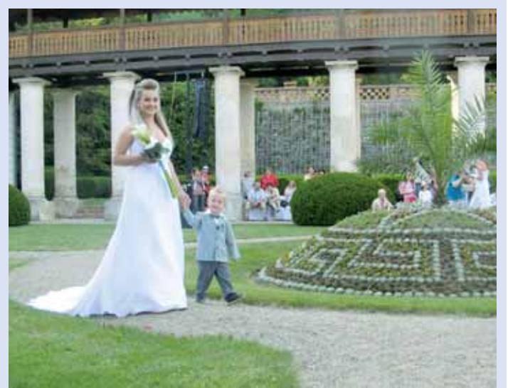
Svatba. Zahrada lysického zámku hostila uplynulou sobotu Svatební show. Návštěvníci si mohli prohlédnout prezentaci firem, ale také přehlídku svatebních šatů nebo šermířské vystoupení.