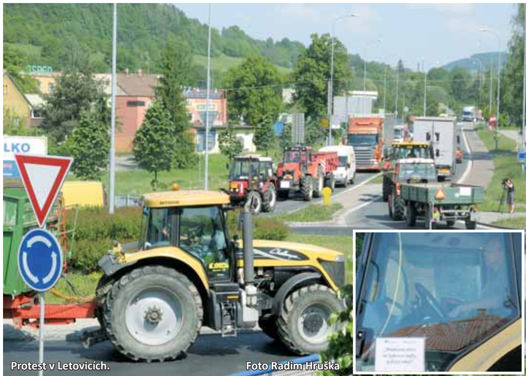
Protest v Letovicích.

„Technika vyjžděla na silnici I/43 v Letovicích, Sebranicích, Lysicích a Bořitově. Kolony byly nasměrovány na Lipůvku a od Letovic až na hranice okresu. Akci jsme koordinovali, protože jsme chtěli, aby nedošlo k poškození majetku nebo zdraví a byla zachována bezpečnost. Traktory jely pomaleji, proto jsme se obávali, že některý z řidičů ztratí nervy. Silnici jsme brzdili dvě hodiny. Naše stroje nemají konstrukční rychlost tak velkou jako normální auta, pro-