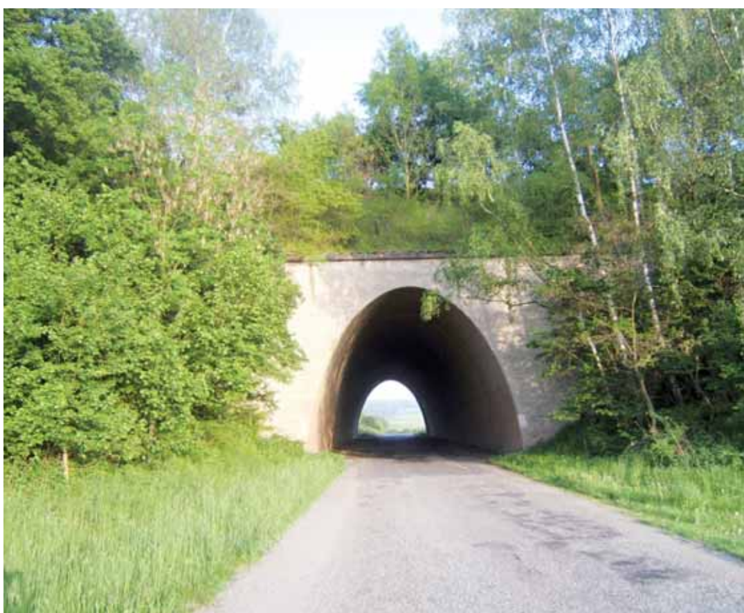
Most. V místech křižovatek nebo křižení toků jsou vybudované nádherné silniční stavby, mimo jiné silniční most u Bačova ve tvaru dokonalé paraboly.

Pochod se uskuteční v sobotu 29. května a je určen všem lidem, kteří chtějí podpořit myšlenku výstavby