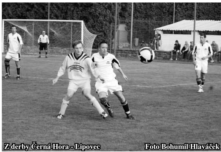
Z derby Černá Hora - Lipovec