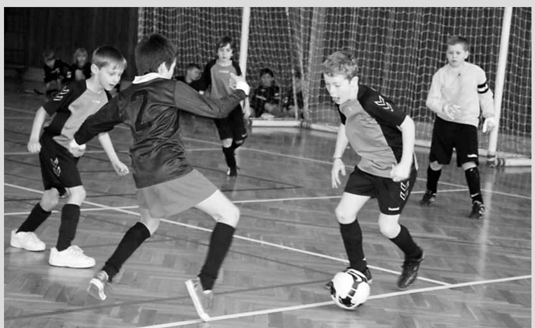
Turnaj. Devět týmů příprav se v sobotu sjelo do sportovní haly v Letovicích. Vítězství vybojovali mladí fotbalisté Boskovic.

Poslední zápas. Pro basketbalisty Sokola Boskovic skončila o víkendu základní část oblastního přeboru I posledními dvěma utkáními. V sobotu hostily Boskovic Tesla Brno, kterou porazily 94:70. Následující den pak jednoznačně přehrály tým SKB Černovice 82:57. V tabulce jim na začátku nadstavbové části patří ve finálové skupině první příčka. Po roce tak mají možnost znovu bojovat o účas ve třetí lize, ze které v loňském roce po boji sestoupily.