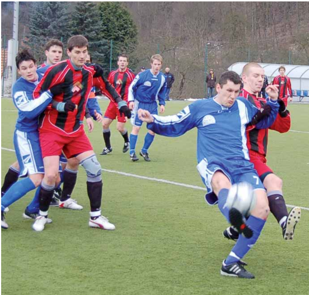
Nepovedený start. V prvním jarním divizním utkání přenechali boskovičtí fotbalisté tři body celku Konice. Jsou tak nadále velmi blízko pásmu sestupu.