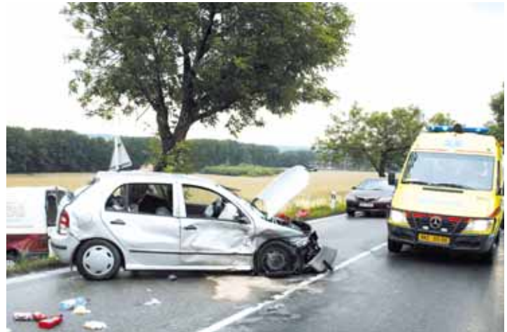
Havárie. Kvůli častým tragickým nehodám si komunikace I/43 vysloužila přezdívku „Silnice smrti“.