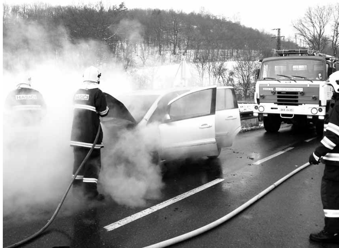
Zásah. V loňském roce několikrát hasiči vyjžděli také k požárům automobilů.

„Při požárech loni zahynuli čtyři lidé. Shodou okolností na jednom