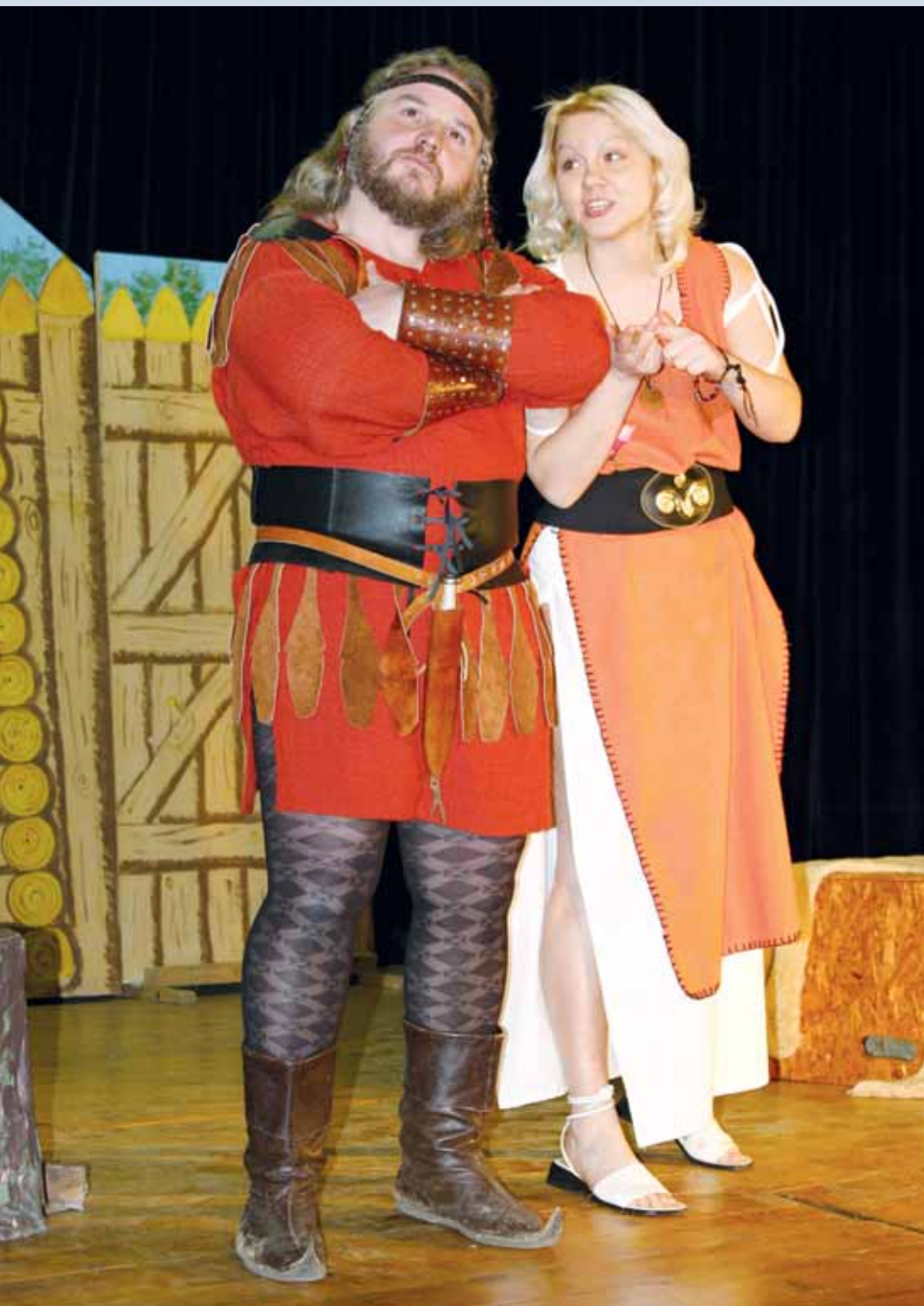
Ochotníci. Divadelní společnost Knínice si pro diváky připravila známé představení Františka Ringo Čecha Dívčí válka. Komedii sledoval do posledního místa zaplněný kulturní dům.