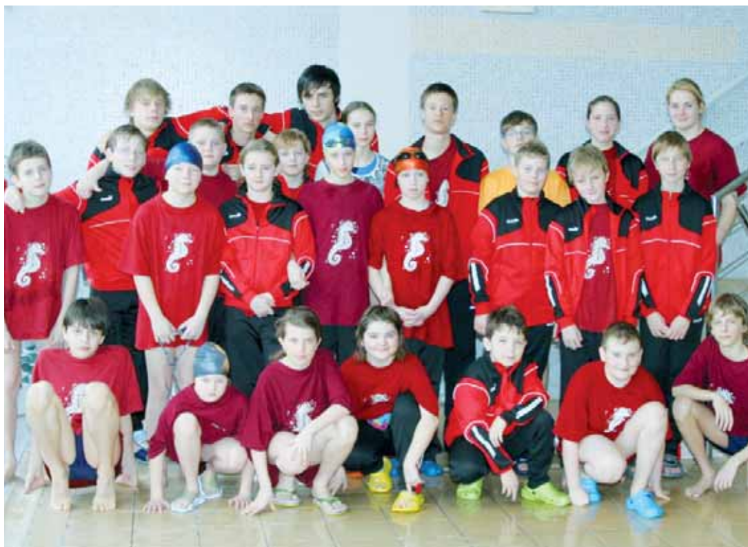
Úspěšná blanenská výprava