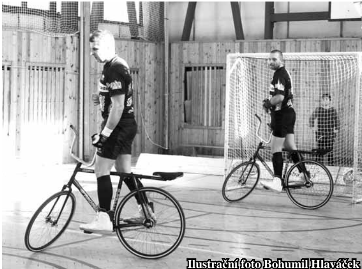
Ilustrační foto Bohumil Hlaváček

ka s Waldispühlem ze Švýcarska,“ myslí si Jiří Hrdlička. Turnaj měl vysokou úroveň, představila se na něm absolutní špička tohoto sportu. „Bylo to těžší než na světovém šampionátu,“ je přesvědčen. Následující víkend čeká Svitávku druhé kolo domácí nejvyšší soutěže, které se uskuteční v Brně. (bh)