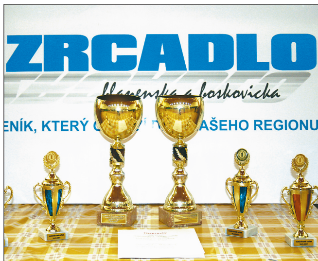
Poháry. Nejúspěšnější účastníci Kunštátské laťky si odvezli ceny věnované týdeníkem Zrcadlo Blanenská a Boskovická a Pivovarem Černá Hora.