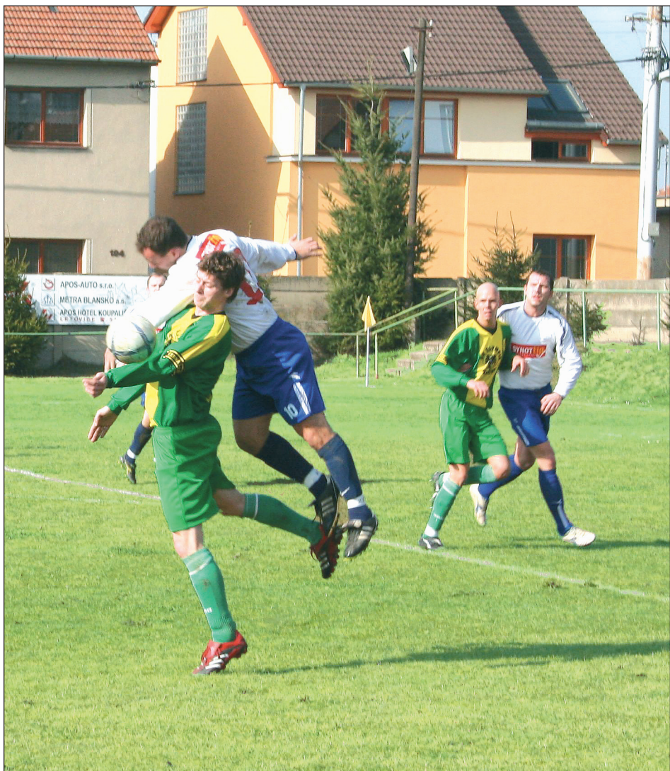
Úvod. V sobotu a v neděli začala jarní část fotbalové sezóny také pro týmy z Blanenska hrající divizi a krajský přebor. Kromě Ráječka všem start vyšel. Více na str. 12.