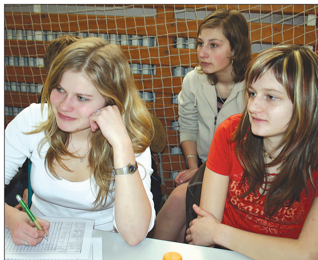
Zapisovatelky. O zdárný průběh závodu se postarala také děvčata, která zapisovala pokusy závodníků.