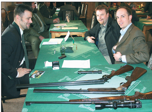
Zkoušky. Budoucí myslivci musí složit poměrně těžké zkoušky.

Uchazeči projdou před zkouškami tak zvaným teoretickým kurzem, který trvá dva měsíce, a pak jdou na praxi do honitab. Myslivost je obor, který je velmi široký. V dnešní době se zaměřuje hodně na ekologii. Ta nabyla velkého významu. „Mělo by platit, co myslivec, to ochránce přírody. Skutečně se tomu tak děje. Někde ještě převládají názory, že myslivci jen střílí, ale opak je prav-