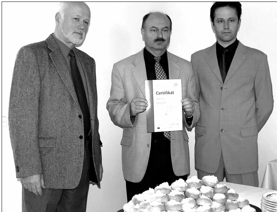
Jako ze svatby. Koláče z pekárny akciové společnosti Zemspol Sloup zastupují celou plejádu výrobců oceněných modrou kapkou.

„Certifikátu si velice vážíme a chceme propagaci značky regionálních produktů pomáhat. Máme v plánu vybudovat na frekventované trase Brno-Svitavy značkovou prodejnu, kde budeme zájemcům nabízet právě výrobky s logem modré kapky,“ řekl