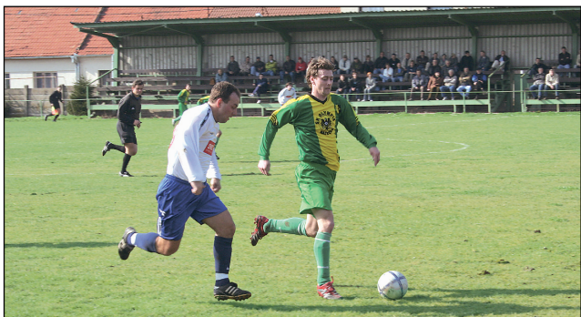
Okrok vepředu. Ráječkovský Torda uniká jednomu ze soupeřů, v závěru byli ale šťastnější hosté.

Trenér Zapletal šel do utkání s cílem napodobit výhru Blanska z předchozího dne. „Hraje atraktiv-