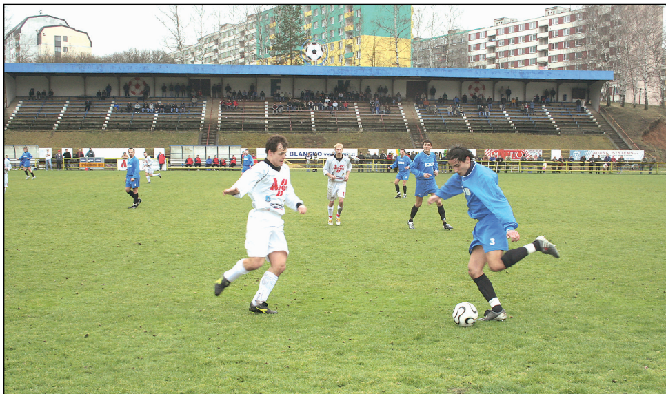
Nezájem. Ani utkání o první místo nepřilákalo do ochozů blanenského stadiónu větší diváckou návštěvu.

Blansko vlétlo do utkání jako vítr. V osmé minutě však všichni ztuhlí. Po správně odpískané ruce v pokutovém území přišla penalta a hosté šli do vedení. Minutu poté se ale začínalo znovu. Přímý kop zakroutil Farník do vápna hostů přímo na Karaffovu hlavu