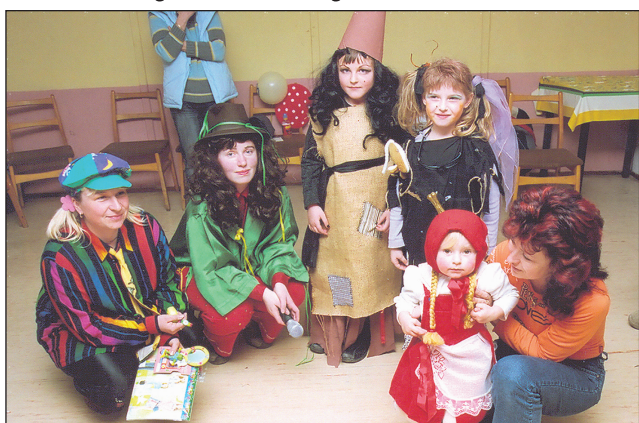
Karneval. Nejúspěšnější účastnice soutěže o nejlepší masku s organizátorkami akce.