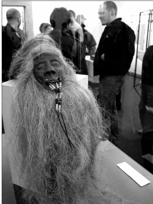
Zdobení. Boskovické muzeum v těchto dnech patří zkrášlování lidského těla tetuáží.

Návštěvníci si mohou prohlédnout jak textové, tak obrazové dokumenty. „Panely obsahují textovou část, kde je probráno tetování od historie až po současnost. Ve vitrínách můžou