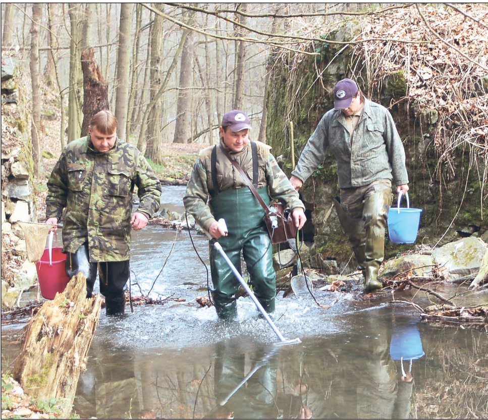
Na potoce. Adamovští rybáři mají po celý rok plno povinností. Patří k nim i péče o chovné potoky.